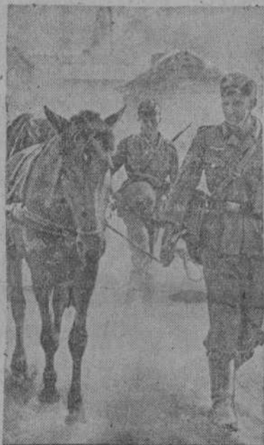
Una columna de municionamiento alemana se dirige a primera línea.

De un total de 81 grandes ciudades, las fuerzas alemanas han ocupado 17, con una población de cinco millones setecientos mil habitantes. Nueve ciudades, con nueve millones novecientos mil habitantes se encuentran al alcance de las fuerzas alemanas, entre ellas Moscú con cuatro millones trescientos mil, San Petersburgo, con tres millones doscientos mil, Charkov con ochocientos mil y Rostov con quinientos mil.—EFE.