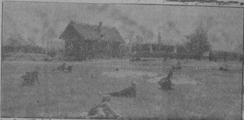
Mientras la artillería hace fuego, los grupos de ataque