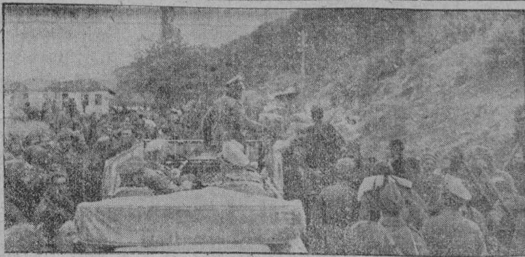
Ante la gran avalancha de prisioneros rusos, el jefe del regimiento especial "Adolfo Hitler", se abre dificultosamente paso.