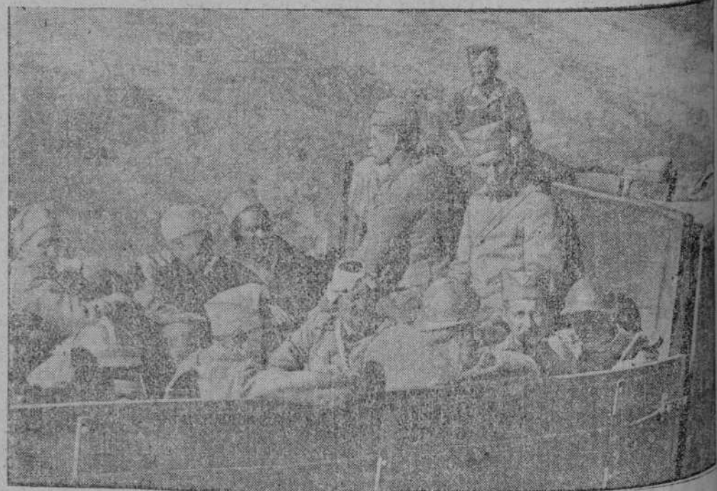
La gran cantidad de prisioneros rusos cogidos, ha obligado a establecer grandes campos de concentración. Un grupo es conducido a uno de ellos.

Todos los diarios han publicado ediciones especiales dedicadas a Besarabia y Bucarest. El vicepresidente del consejo ha pronunciado un discurso dirigido a la nación rumana en el que declaró especialmente que el ejército rumano, junto al victorioso ejército alemán, acaba de recortar para siempre los territorios robados. "Se ha abierto una nueva página gloriosa en la historia de nuestra patria. Debemos esta victoria a Adolf Hitler, el gran defensor de la civilización europea, al ejército rumano general Antonescu. El presidente termina su discurso con entusiastas vivas a la misión rumana, a su ejército alemán, a los países aliados del Eje y a Hitler, destructor del bolchevismo.—(Efe).