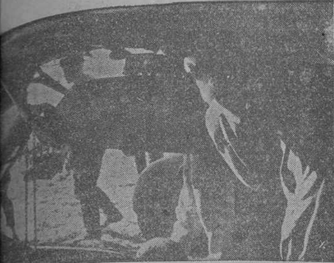
bombas son alzadas con un aparato elevador en el fuselaje del avión.

AVIONES PICADORES ALEMANES ANTES DE LA PARTIDA