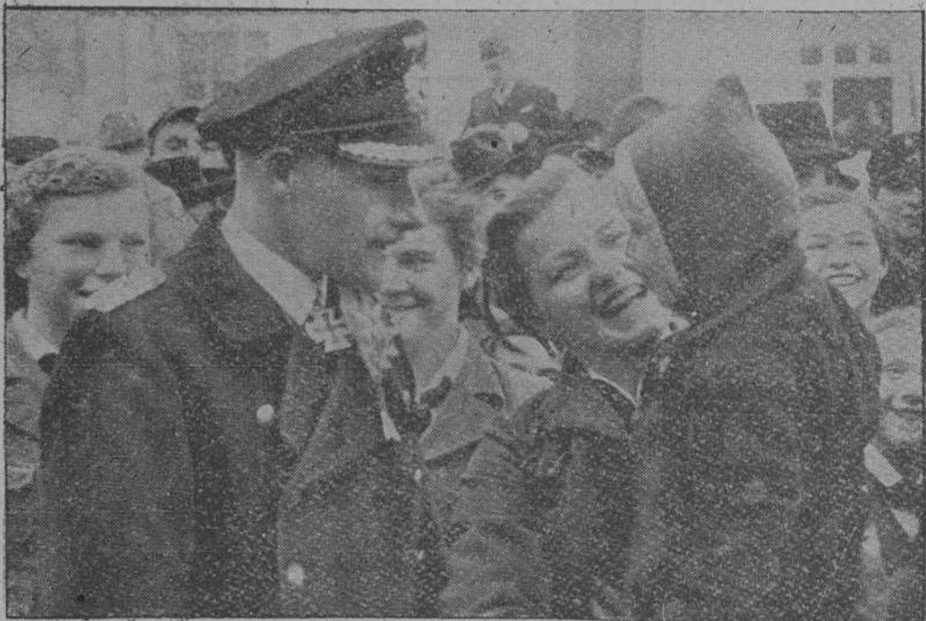
El comandante de submarinos alemán von Stockhausen, fue perseguido en su pueblo, ya salvado por la población entera.