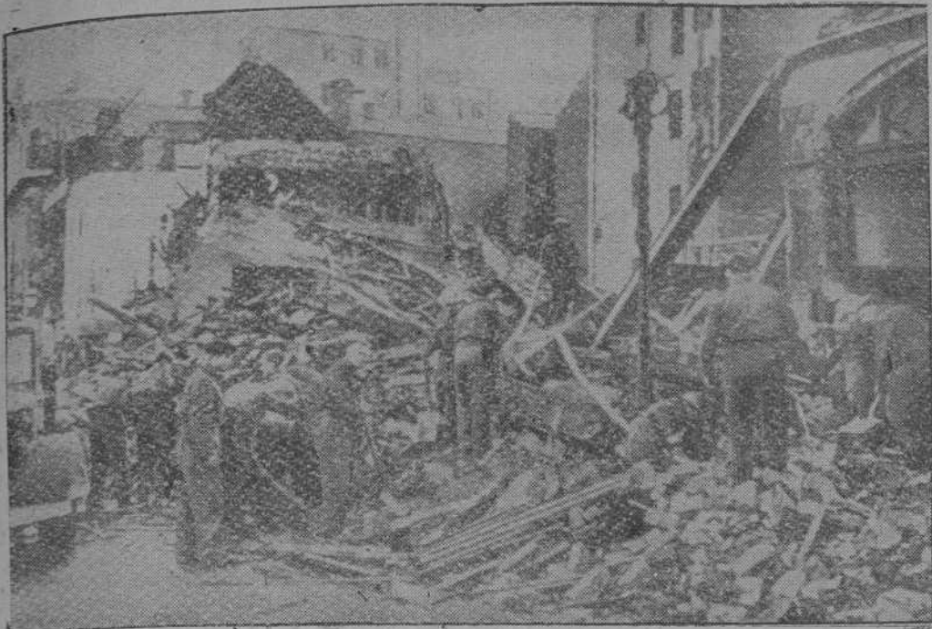
Trabajos de descombro en Birmingham, importante centro industrial inglés que ha sido atacado repetidas veces por la aviación alemana.