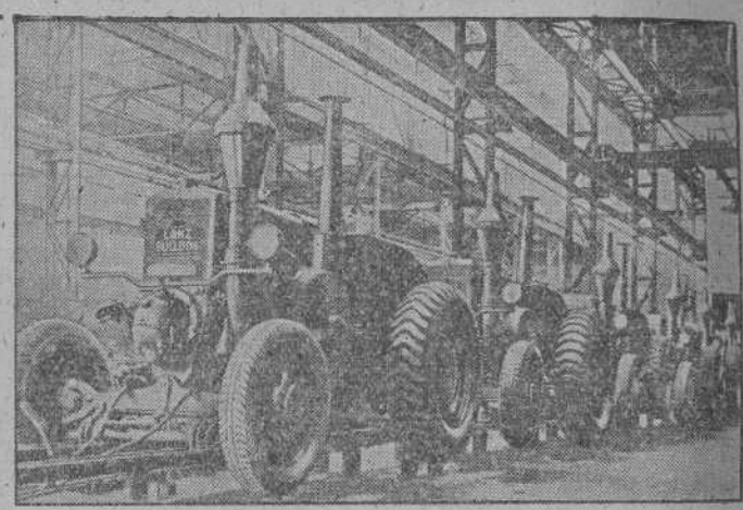
Aspecto de la fabricación en serie de tractores, gran parte de los cuales están destinados para el extranjero