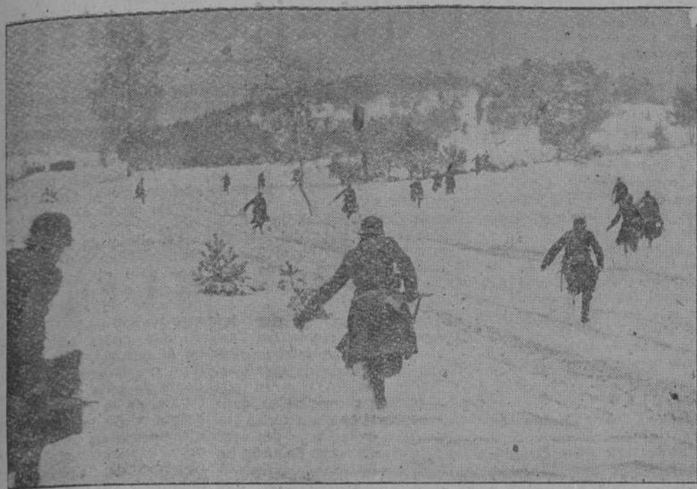
El Regimiento "Gran Alemania", que se distinguió especialmente en las campañas del Oeste, intervino recientemente en importantes maniobras.