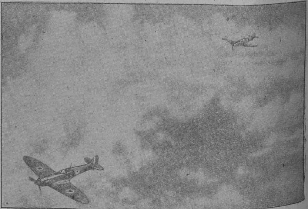
Un aparato de caza "Me 109" persigue a un caza inglés

"Viva actividad artillera. Nuestras baterías antiaéreas derribaron dos aviones enemigos. Además otros dos sufrieron daños visibles.—(Efe).