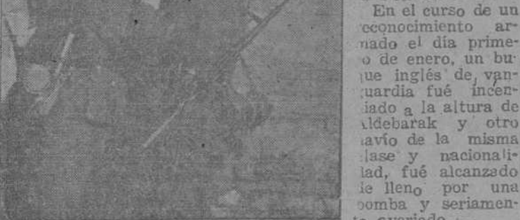
Hombres de una Compañía de Probanda alemana transmiten por radio los detalles de una acción aéreo-naval en la costa del Canal

"Un crucero auxiliar alemán, que opera en aguas del Pacífico comunica que durante su crucero diez barcos mercantes enemigos, o que navegaban a servicio del enemigo han sido por él hundidos. El total de estos mercantes asciende a: 64.155 toneladas. Las tripulaciones de estos barcos fué trasladada por el buque de guerra alemán a una isla de la Polinesia.