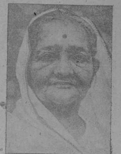
La esposa de Gandhi, enemiga acérrimo de Inglaterra, fué detenida hace poco en Bombay