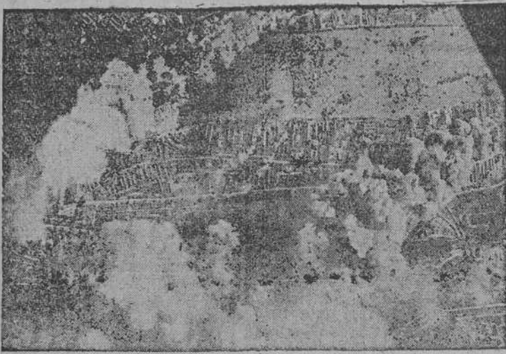
La aviación alemana bombardeando las instalaciones de Victoria Dock a orillas del Támesis.