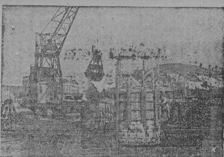
Grúas flotantes y dragas desembarazan las aguas del Sena de los restos de un puente volado por los "añados" en Rouen.

Se ha recibido en esta redacción la partitura y las hojas correspondientes a los respectivos instrumentos de un pasodoble de concierto titulado "Lamparilla" y dedicado a este nuestro compañero de redacción. La obra es original del director de la Banda Municipal de Ponferrada y los entendidos dicen que es interesante. Acusamos por hoy recibo del envío del nuevo pasodoble "Lamparilla" y esperamos no se ponga éste muy "flamenco", si lo oye.