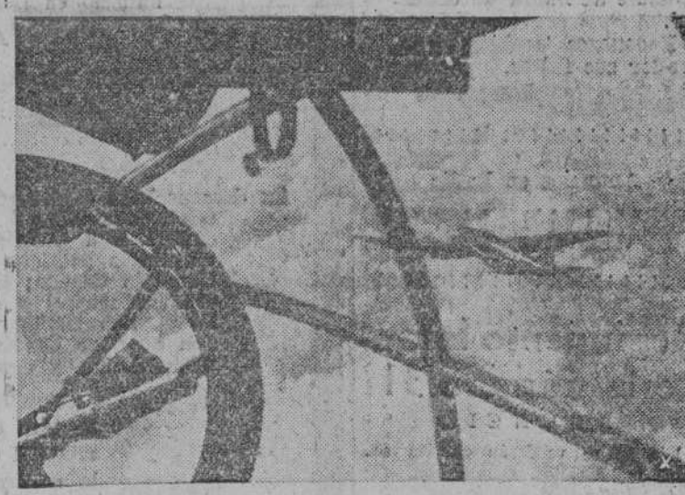
Una escuadrilla alemana en plena acción sobre Inglaterra.

El Cairo, 18.—Reina gran indignación en los medios árabes por las tentativas inglesas de impedir las peregrinaciones anuales a La Meca. La prohibición, no se ha anunciado abiertamente hasta ahora, pero ya se va propagando por medio de rumores.—EFE.