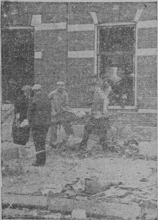
Las gracias a los antiguos aliados.—La aviación inglesa no cesa en bombardear poblaciones holandesas apartadas de todo objetivo militar

ha dado la sexta alarma de la jornada en Londres.—EFE.