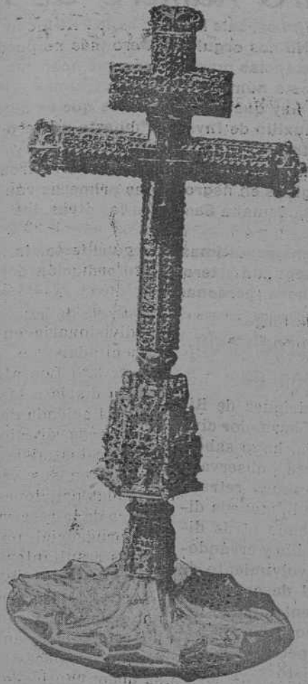
PIEDAD Y ARTE LEONESES.—La valiosa y venerabilísima reliquia del Lignum Crucis , de la Real Colegiata de San Isidoro de León, joya singular del pueblo católico leonés, en su magnífico relicario del siglo XV.