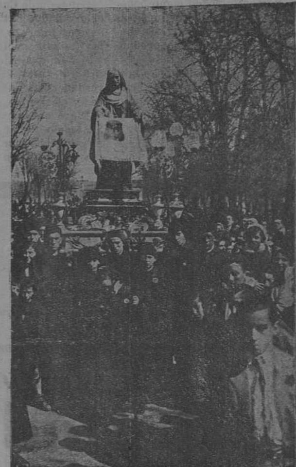
SEMANA SANTA EN LEÓN.—Por las calles de la vieja ciudad pasan estas imágenes, bien por venerables, a hombres de los clásicos pasos. A la imaginería antigua ha ido aumentándose esta otra moderna, como la preciosa efigie de la Verónica que figura en esta fotografía.

¡Oh raíz de Jesús: eternamente florida para señal de los pueblos: a quien invocarán las naciones. ¡Ven para librarnos: no quieras tardar más!