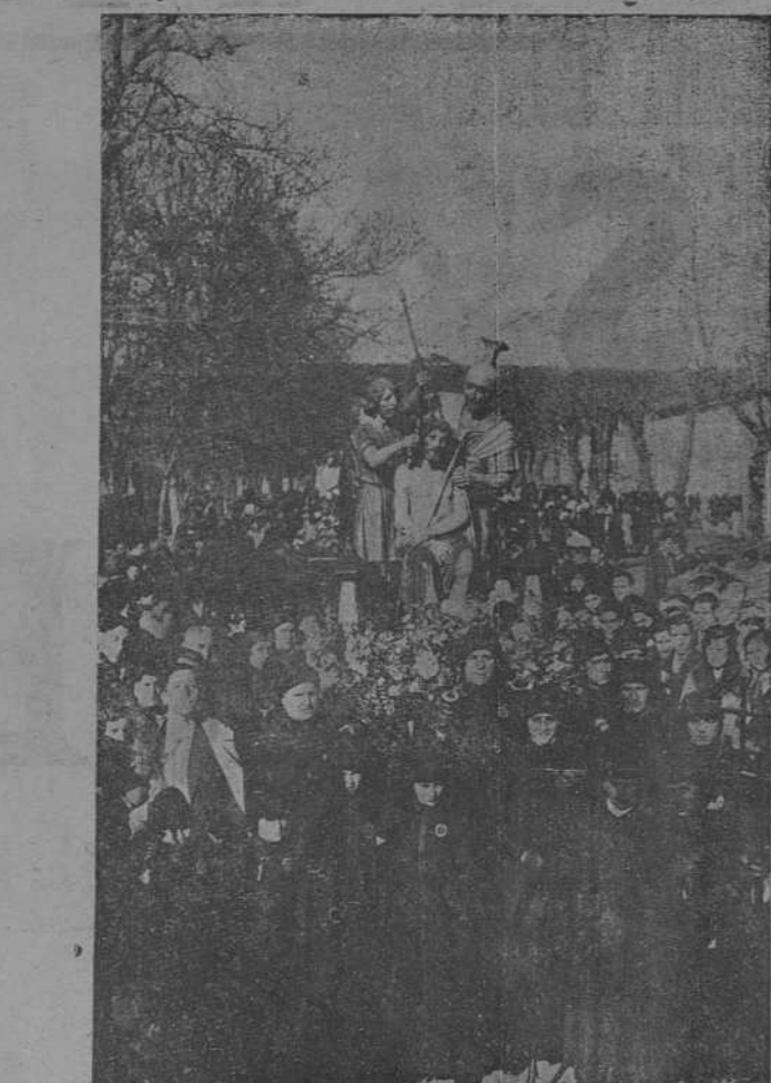
SEMANA SANTA EN LEÓN.—La Coronación de Espinas. Magnífico «paso» que figura en nuestras procesiones, entre los de factura moderna, y que suscita gran devoción por su realismo.