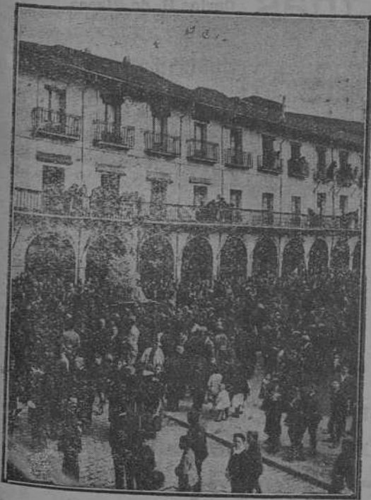
La Procesión de Semana Santa en la Plaza Mayor (León) ¡Qué mundo de evocaciones, de tradición, de piedad y de españolismo evocan tan sencillas palabras!