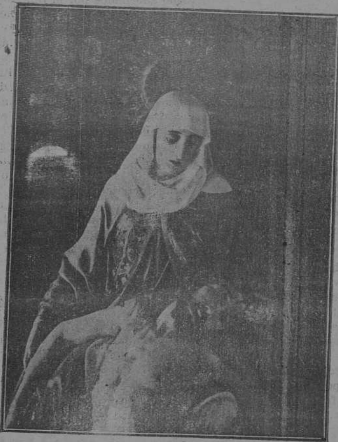
SEMANA SANTA LEONESA.—Hoy, Viernes Santo, a la luz de plata de la luna llena, y entre la luminosidad de faros y velas en hilera, la Madre de los Dolors, venerada en la iglesia de San Martín, mostrará, en la Procesión del Santo Entierro, la amargura del Hijo muerto en sus brazos virginales y amorosos.