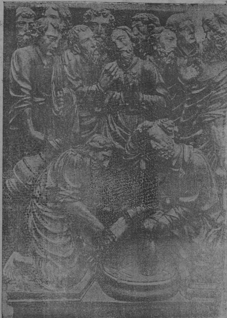
Arte antiguo leonés.—Jesús lava los pies a sus discípulos.—Talla en madera de la iglesia de San Pedro, en Coyanza, del famoso escultor Doncel, autor del coro de San Marcos, de León.