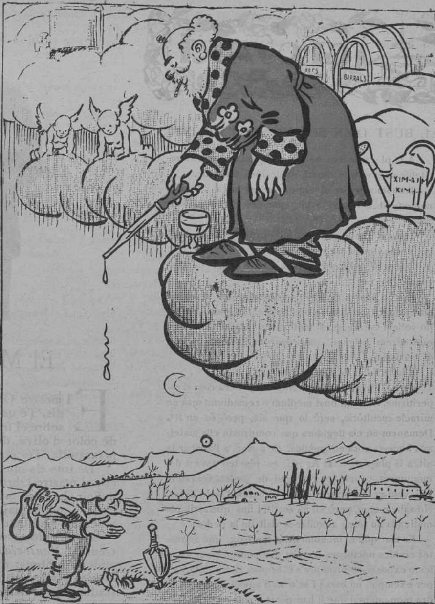
—Deixi anar l'aigua a bots i a barrals i no amb compta-gotes, senyor Sant Pere.

Ben al revés d'ara; que sempre tens d'estar amb l'ai al cor pressentint la visita d'un farcell... d'una taronja o si altra no, d'una lata de sardines o etc., de qualsevol altra porqueria. I lo pitjor és que prenent totes les precaucions, moltes vegades no pots evitar l'«encuentro» i quan has fet tota la gimnàsia, et retires fet un drap brut.