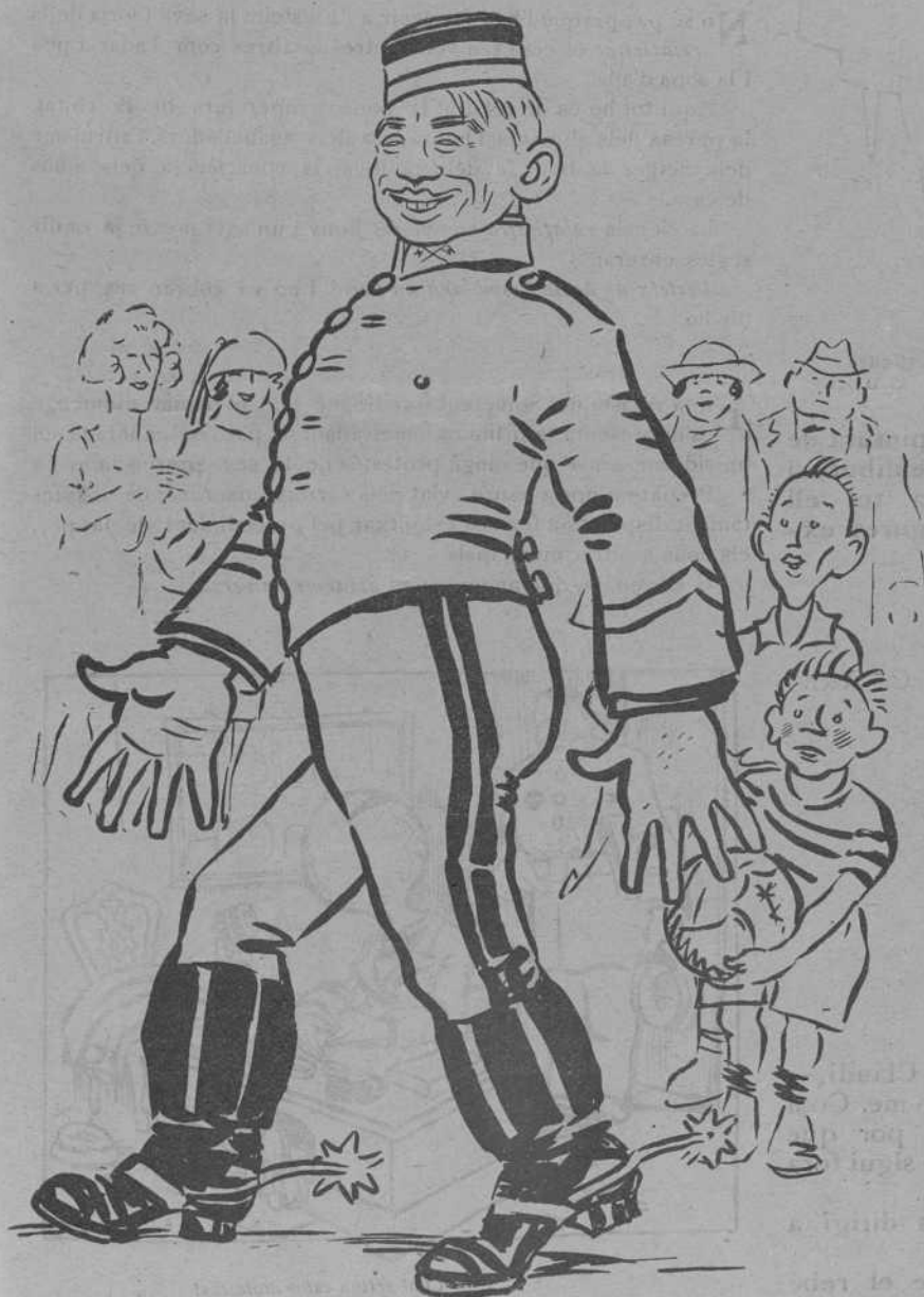
—En Zamora de cavalleria? Trobo que hauria sigut millor de peu .

A la llista dels macos, cal apuntar-hi un nom amb lletres de pam; el d'En Pons i Arnau, un pintoràs de les Laietanes que malgrat els seus cognoms catalans, vé del cor de la Meseta , amb un devassall de claror i de colorines que enlluer-