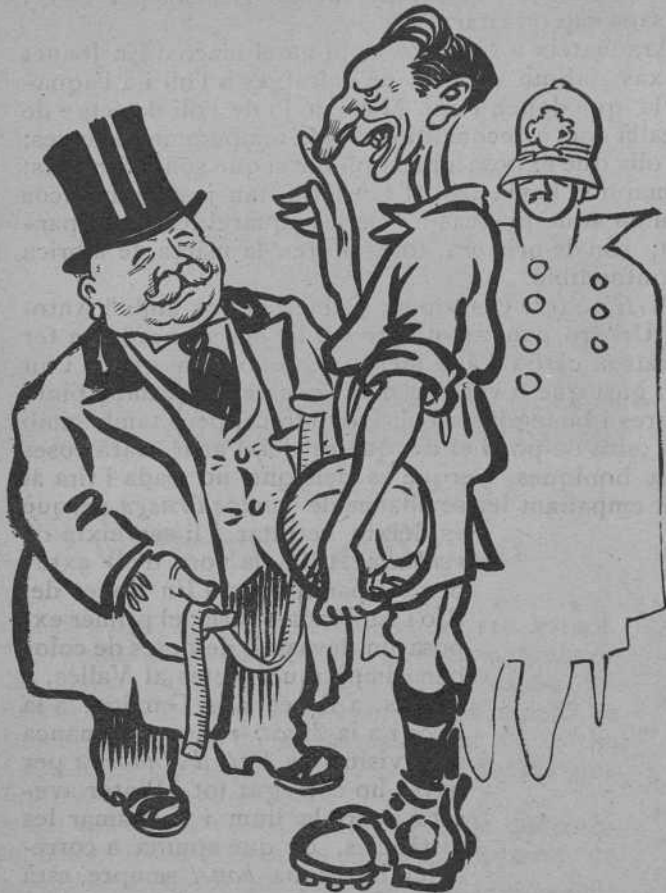
El governador pren mides... futbolístiques.

na. Què migrada i trista i febla resulta la pintura de la nostra joventut al costat de la fermesa de dibuix i de construcció d'aquest foraster entusiasta, tot ell braó, que el mateix fa un quadre plé de figures expressives que un paisatge imponent.