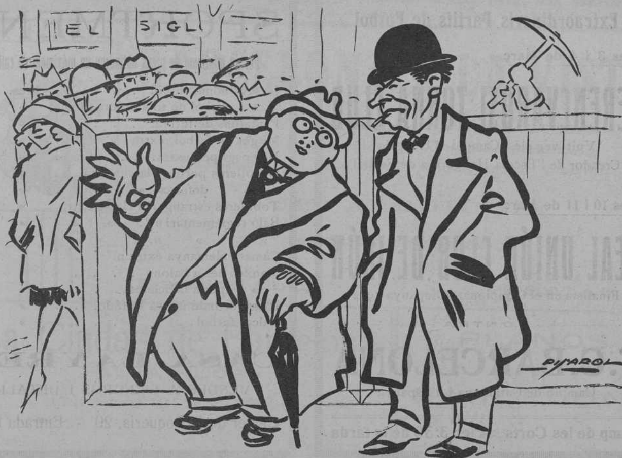
LA VALLA DEL «METRO».

L'incommensurable «Xenius», l'home de la mentalitat exquisida, el filòsof profund desocbridor de la teoria de l'arbitrarietat, acaba de trobar la seva veritable posició política: s'ha fet ciervista segons la premsa diària ens conta.