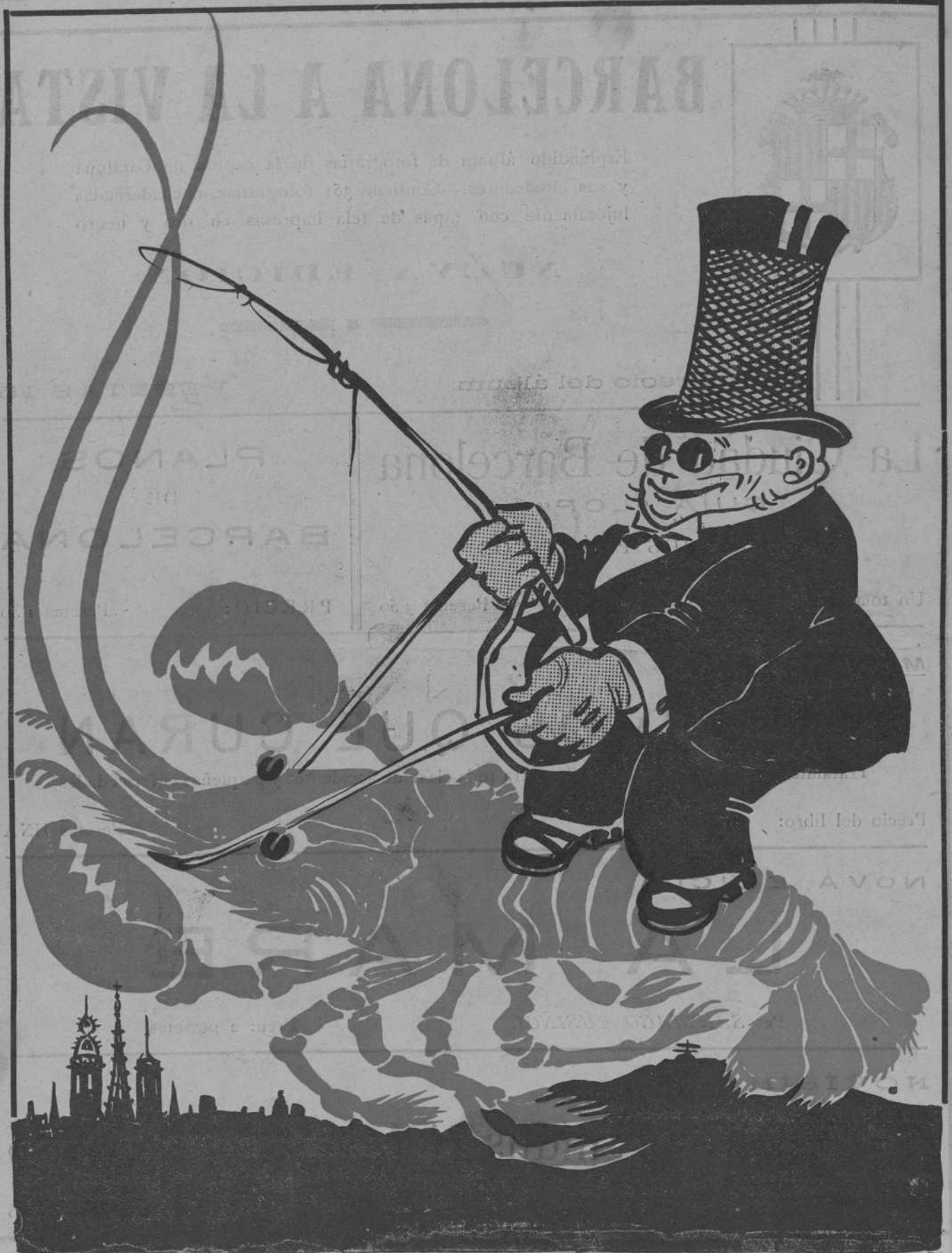
— Amb llagosta vingue'n Quaresmes!