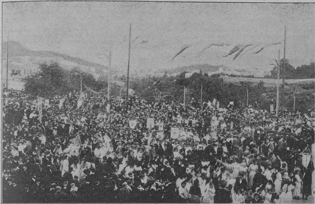
Els alumnes de las escoles públiques de Barcelona, reunits el diumenje passat á l' esplanada del Frare Blanch , ab motiu de la «Festa del Arbre.»

De mena nyícris, tenia un organisme tan débil que, á pesar de ser ja tot un tros de mico, qualsevol de nosaltres l' hauria girat de revés ab una petita batzegada.