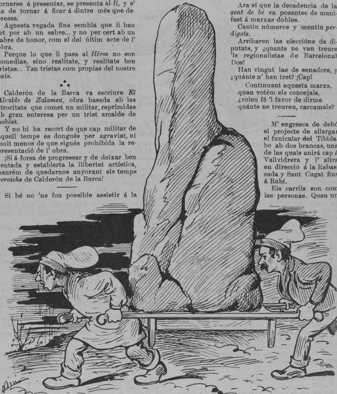
Portant el Caball Bernat al Concurs hípich.

Els carrils son com las personas. Quan un