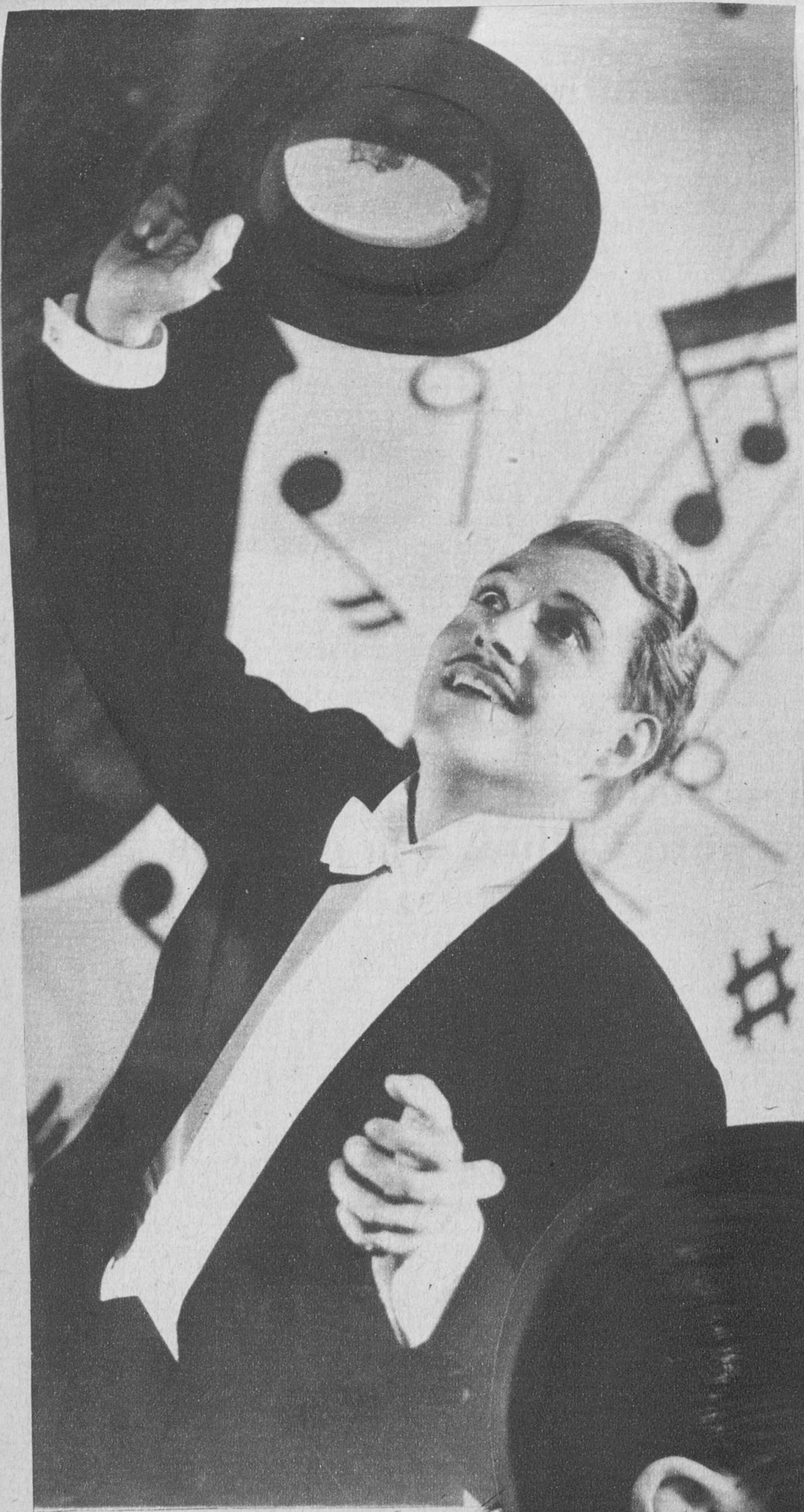
Nelson Eddy, de M. G. M.