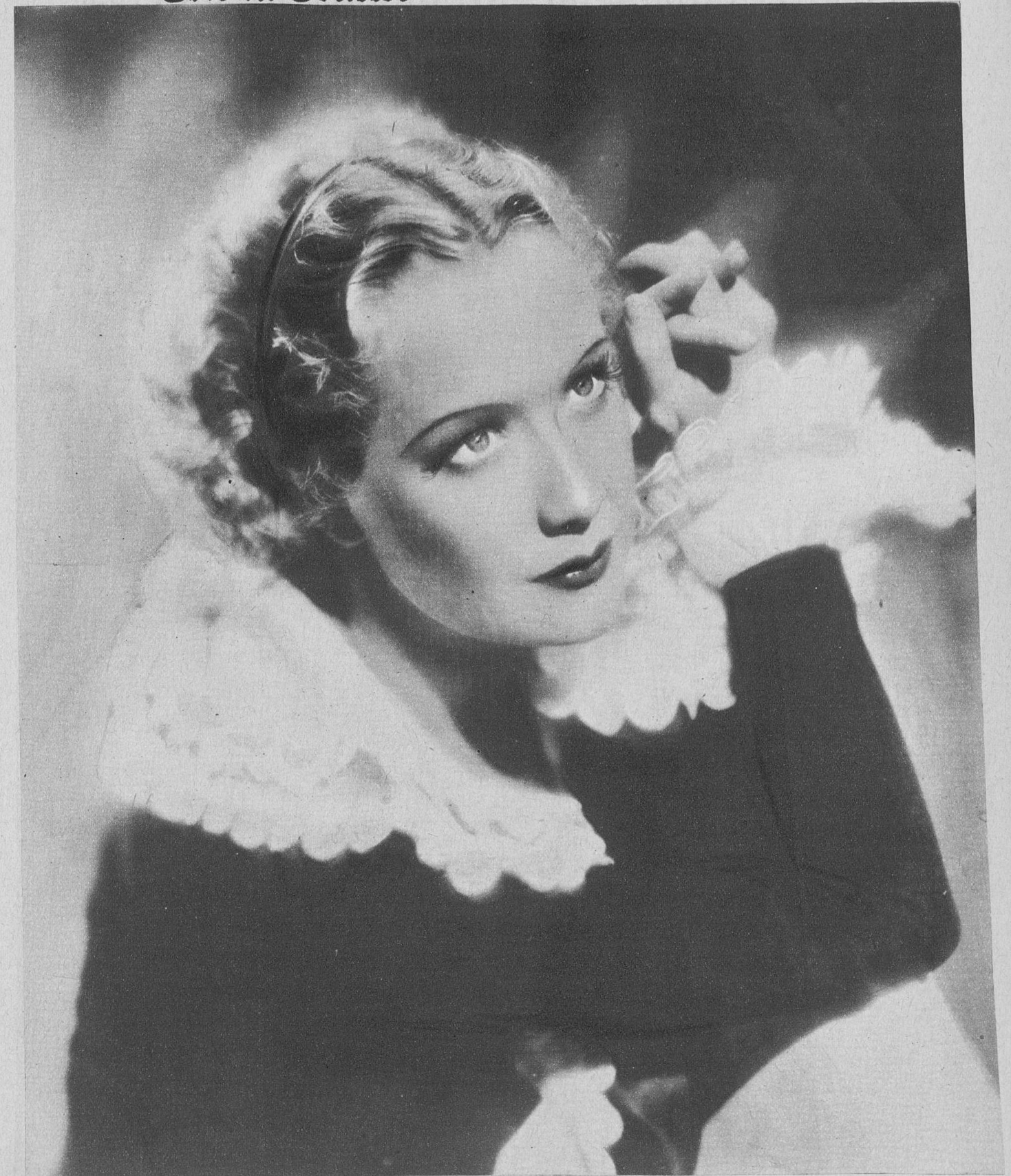
Miriam Hopkins, estrella de la Paramount