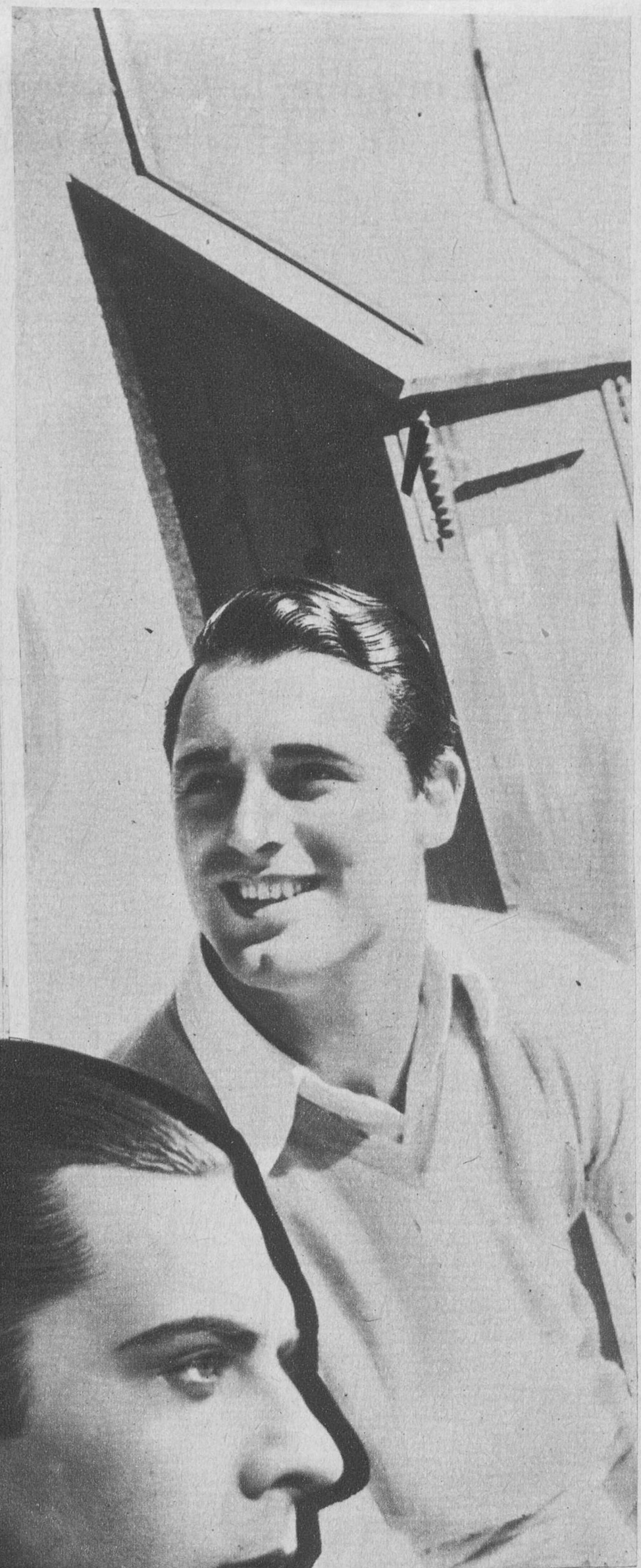
Gary Grant, de la Paramount