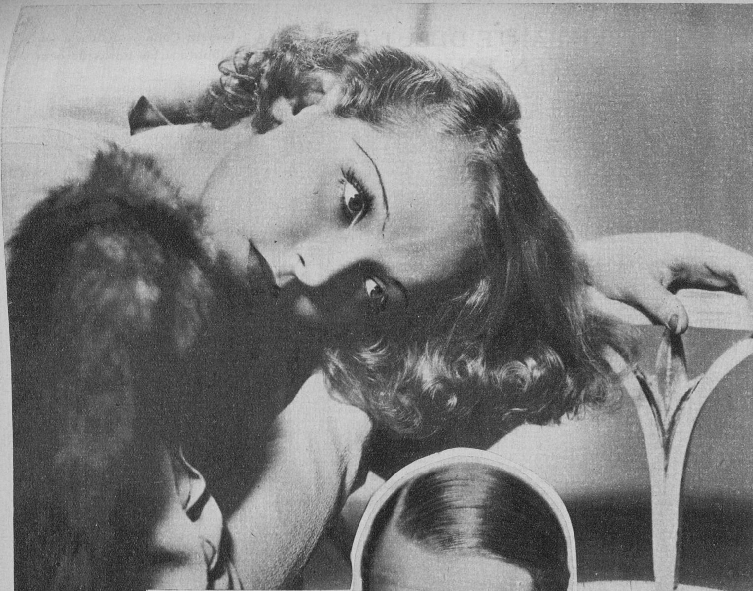
Sally Blane, protagonista del film «Consejero en amores», película de Artistas Asociados