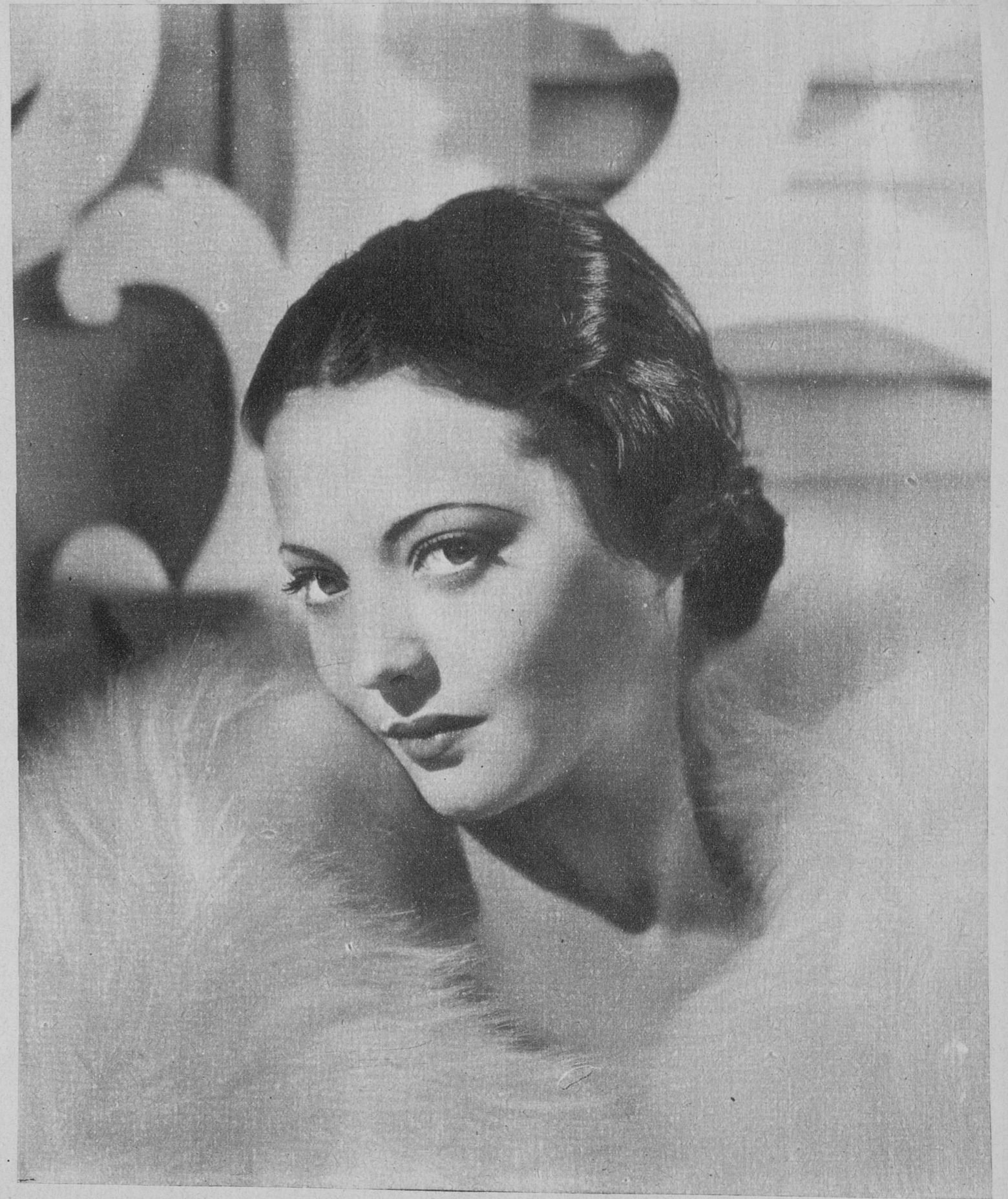
La bellísima Silvia Sidney, destacada estrella de la Paramount