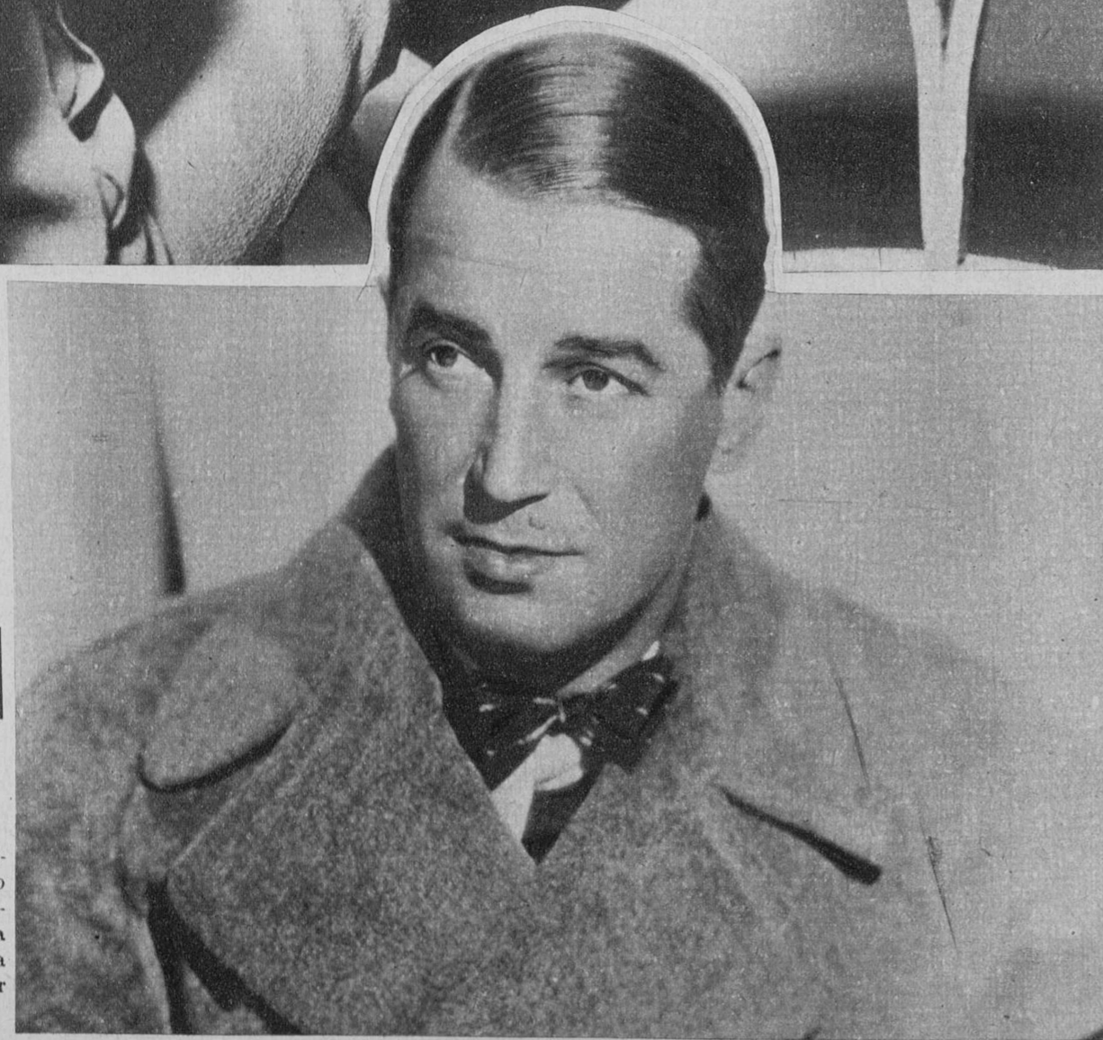
El famoso actor Maurice Chevalier, que junto con Jeannette Mac Donald están rodando «La viuda alegre», para la Metro Goldwyn Mayer