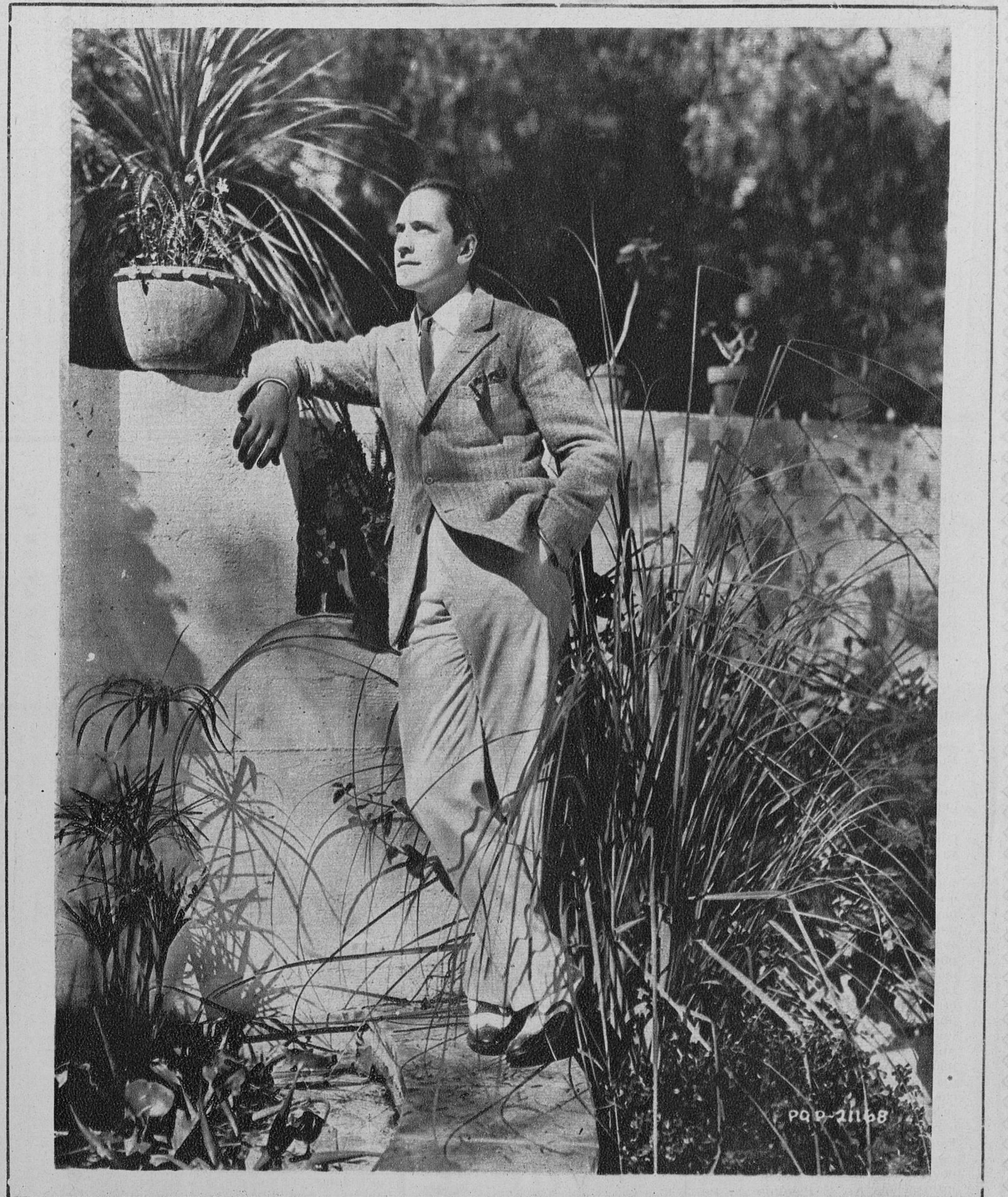
Friedrich March, el notable actor, en su residencia de Beverly Hills. Este actor del gesto sobrio, es uno de los intérpretes de «El signo de la Cruz»