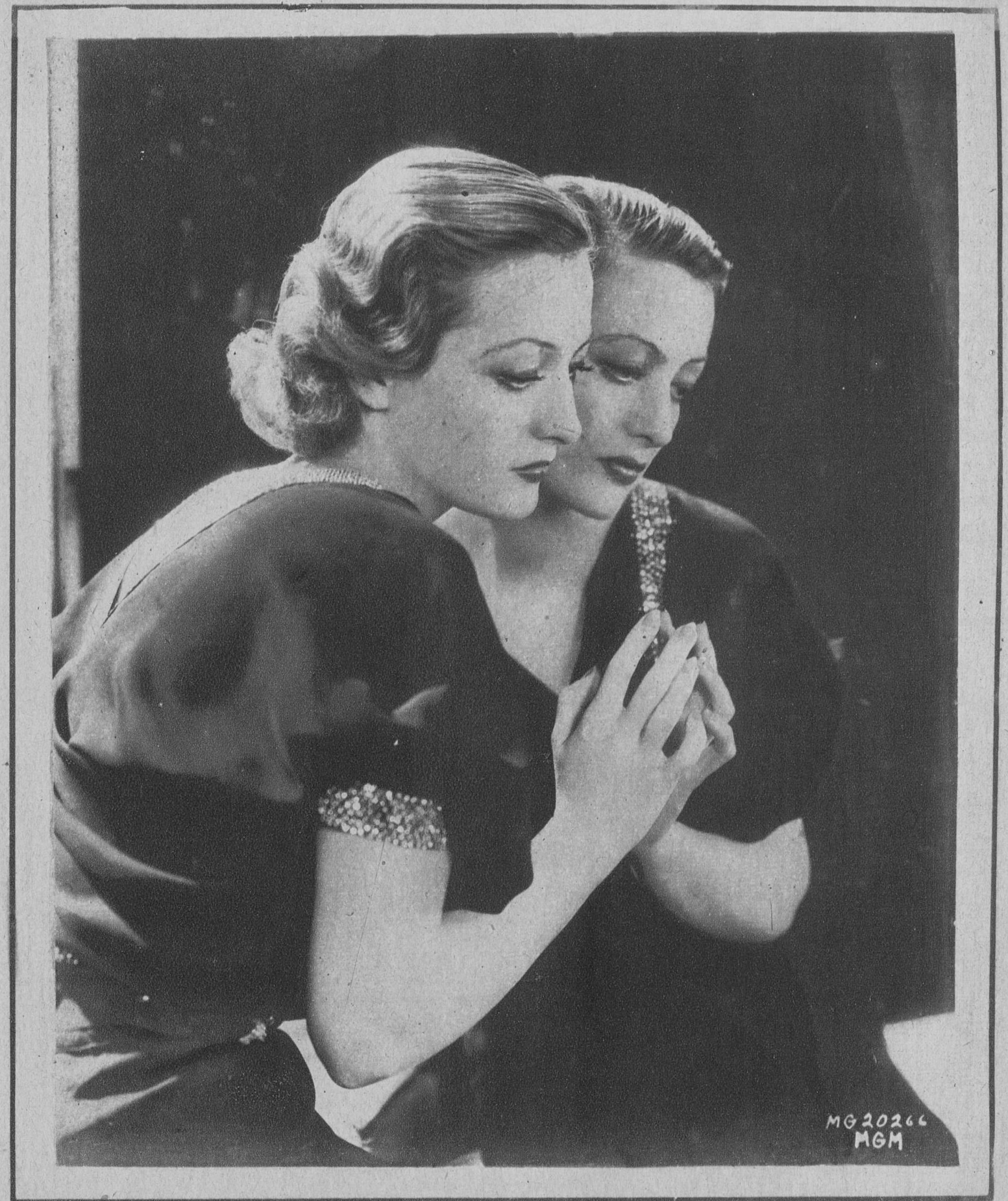
Con ayuda del espejo, el fotógrafo de la M. G. M., nos ofrece este original retrato de Joan Crawford