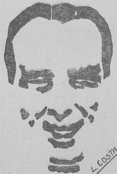
DOUGLAS FAIRBANKS