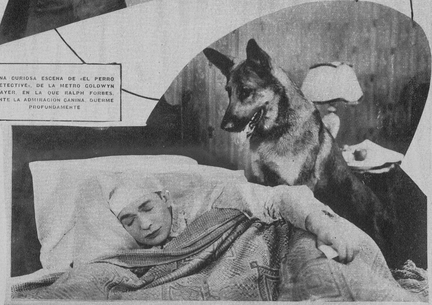
UNA CURIOSA ESCENA DE «EL PERRO DETECTIVE», DE LA METRO GOLDWYN MAYER, EN LA QUE RALPH FORBES, ANTE LA ADMIRACION CANINA, DUERME PROFUNDAMENTE