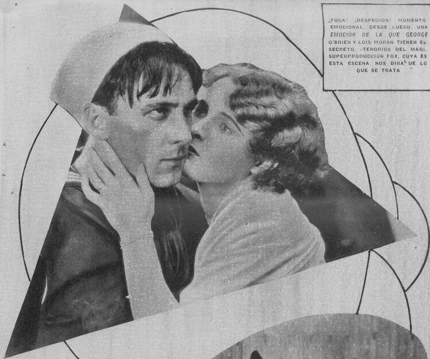
¿FUGA? ¿DESPEDIDA? MOMENTO EMOCIONAL, DESDE LUEGO. UNA EMOCION DE LA QUE GEORGE O'BRIEN Y LOIS MORAN TIENEN EL SECRETO. «TENORIOS DEL MAR», SUPERPRODUCCION FOX, CUYA ES ESTA ESCENA, NOS DIRA DE LO QUE SE TRATA