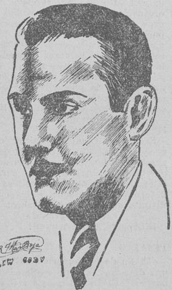
LEW CODY (Por Ramón Mas Beya, de Barcelona)

Fitzgerald, hija del Mayor del Ejército, John F. Fitzgerald de Boston.