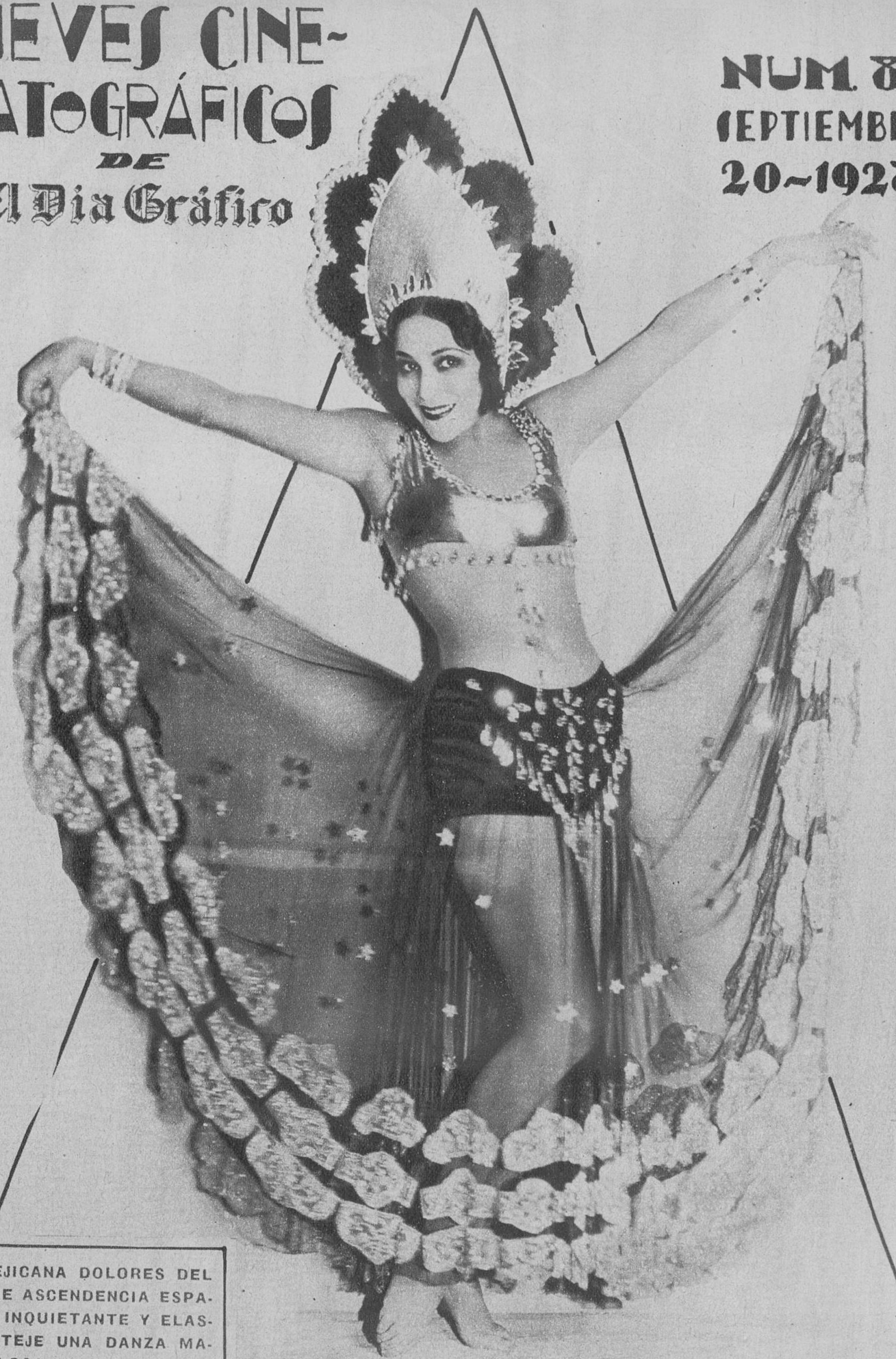
LA MEJICANA DOLORES DEL RIO, DE ASCENDENCIA ESPAÑOLA, INQUIETANTE Y ELÁSTICA, TEJE UNA DANZA MARAVILLOSA EN EL FILM TITAN FOX «LA BAILARINA DE MOSCU»