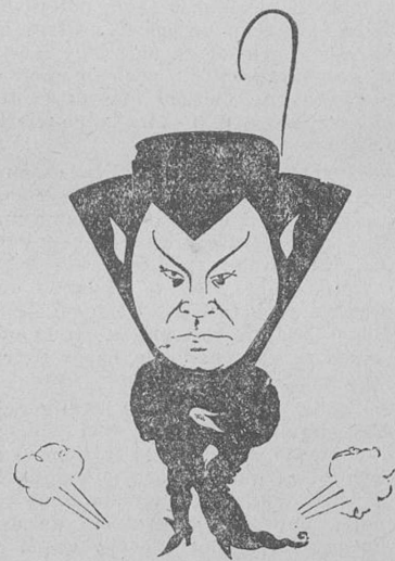
EMIL JANNINGS En Mehistóteles, en la película «Fausto»

Sus allegados, la Prensa y miembros de la cinematografía en general, dicen que este joven banquero de Boston no ha hecho más que empezar, y que para el futuro nos reserva grandes y sensacionales sorpresas.