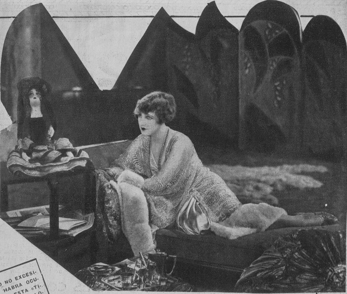
FIESTA MUNDANA, PERO NO EXCESIVAMENTE CORDIALIDAD. ¿QUE HABRA OCURRIDO PARA DAR LUGAR A ESTA «TIRANTE» ESCENA DE «LA VIRGEN LOCA», DEL PROGRAMA BALART Y SIMO?