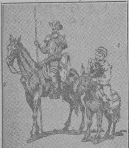
El más grandioso suceso de la cinematografía será, sin duda, la famosa "SELECCION GAUMONT DIAMANTE AZUL"

Dentro de pocas semanas se estrenará en las treinta principales ciudades que hicieron el concurso de "La pequeña vendedora", cuyas ganadoras fueron huéspedes de Mary Pickford en Hollywood. Esta propaganda, unida a la edición de la novela y a su publicación en el Collier, hacen suponer que "La pequeña vendedora" es la película que más propaganda ha tenido de todas las de Mary.