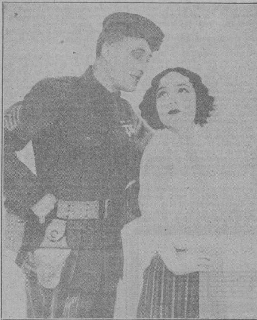
... Otra personificación espléndida: la de Dolores del Río en "Charmaine". Y Edmund Lowe nos dió una grata sorpresa, de la que pueden enorgullecerse tanto él como su compañía."

New York Evening Journal: "El Precio de la Gloria" es una maravilla, y Victor McLaglen en el papel de capitán Flagg ha realizado la creación más soberbia del año. Los caracteres son reales. La trama abunda en drama, comedia y romance. Los pasajes cómicos contuvieron al auditorio de repetida hilaridad... ... el ataque a través de los bosques, bajo la lluvia de acero, gases y llamas, impresionan hasta al espectador de temperamento más frío... Raoul Walsh ha seguido fielmente la creación teatral, pero entre líneas ha intercalado ciertos pequeños toques chistosos que realzan la obra e intensifican el crescendo emocionante del conjunto." The New York Sun: "Con las escenas más espeluznantes y realistas jamás presentadas en la pantalla y con—por lo menos—dos estupendas caracterizaciones: la de Victor McLaglen y Dolores del Río, "El Precio de la Gloria", de los conocidos escritores Stallings y Anderson, es la película más hermosa que se exhibe actualmente en Broadway. Esta cinta, de la Fox Film, es una de las mejores que se hallan dentro o fuera de Nueva York." The World: "... es realmente cómica a la vez que gloriosamente libre de rebuscados eutemismos en su intenso realismo creador. ... Aquí se ve la guerra cruel, nauseabunda, horrible. Pero sobre todo se destaca el capitán Flagg, interpretado