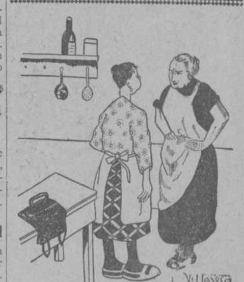
—Dice usted que sabe planchar. ¿Er que conoce que la plancha está caliente? —En que se tuesta la ropa y huele a chamusquina.

Minutos después, cuando se disponía a tomar el autobús para volver al pueblo, Manuel se encontró sin tres mil pesetas, suma que acababa de cobrar.