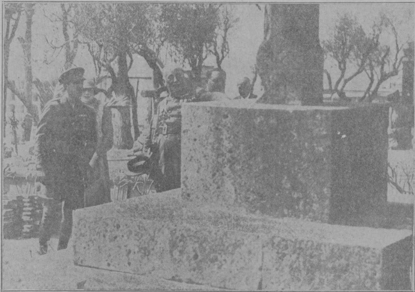
Sus Majestades Don Alfonso y Doña Victoria, con el Presidente del Consejo, durante la visita que hicieron al cementerio de Tetuán, depositando flores en las tumbas de los muertos en campaña.

Durante todo el día los alrededores del Hotel Príncipe de Asturias estuvieron invadidos por la gente, deseosa de ver a los Soberanos.