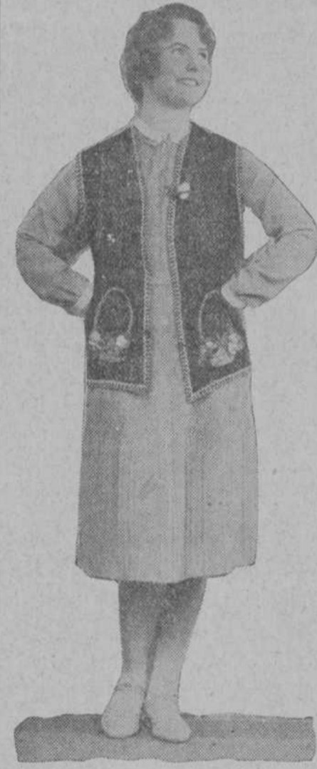
La bellísima "estrella" Lois Moran, que ha ingresado en el elenco de la Fox.

¡HOY! ¡HOY! ¡HOY! Formidable programa LOS MISERABLES según la célebre obra de Victor Hugo.