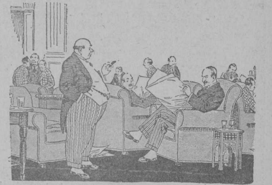
EN EL CIRCULO