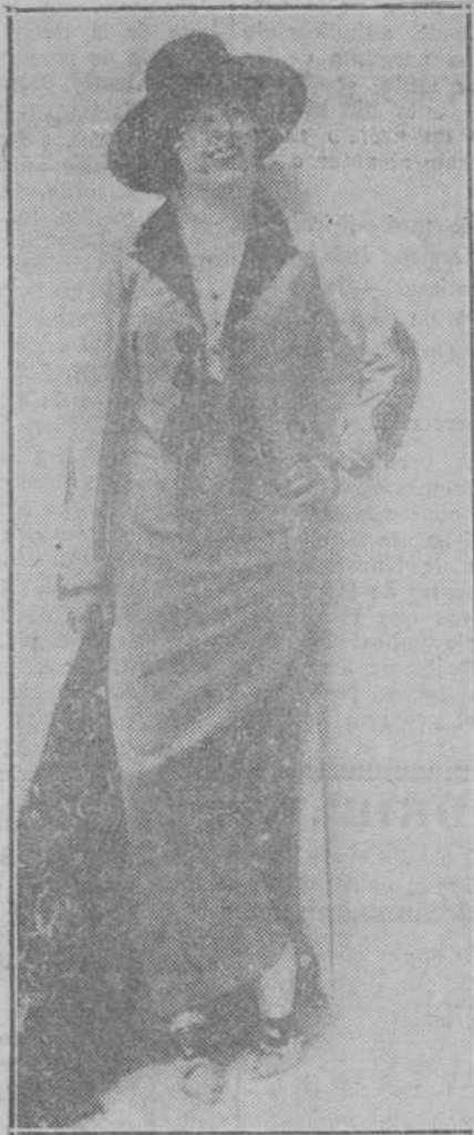
La bella artista de variedades Carmen Diadema.