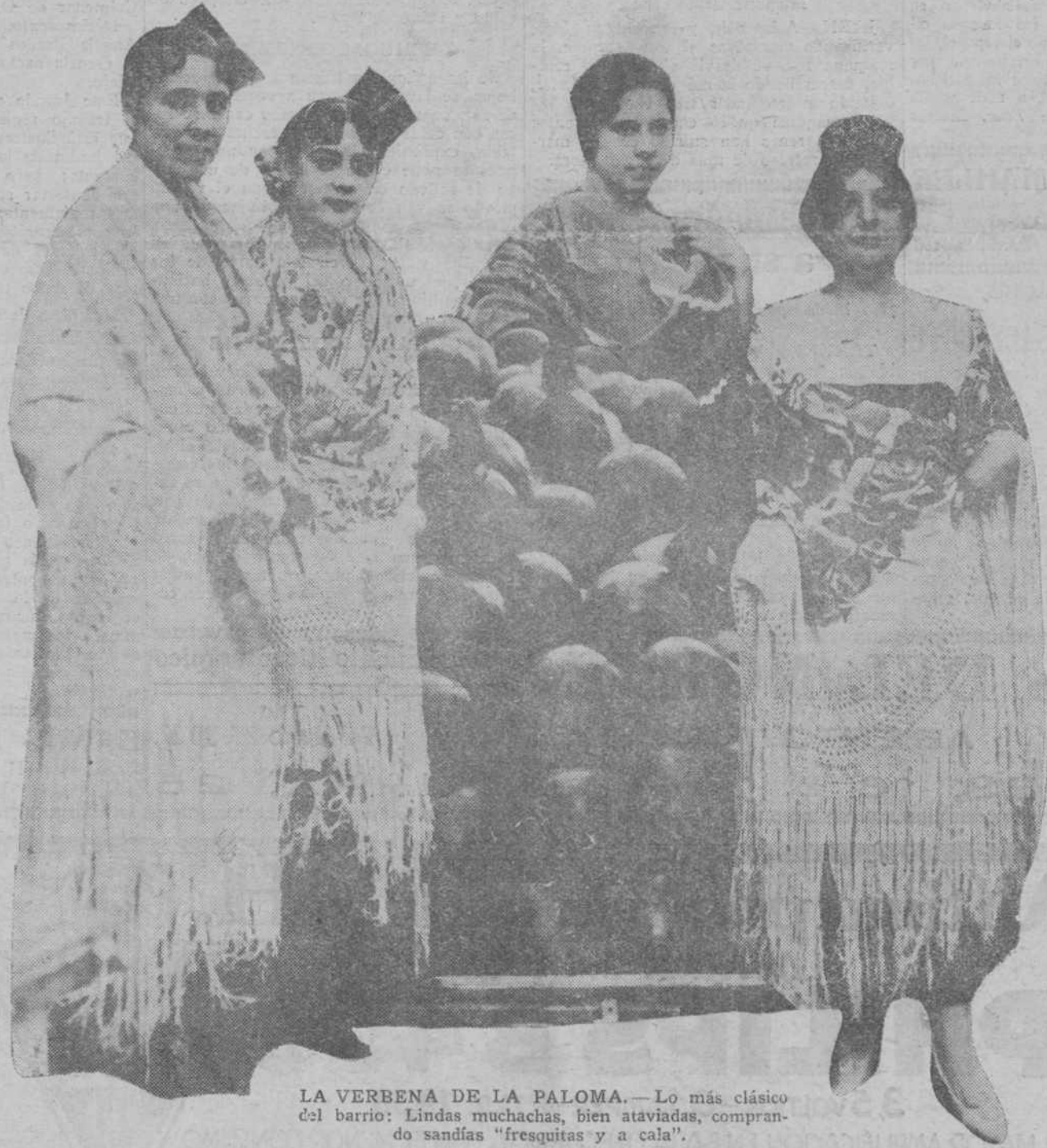
LA VERBENA DE LA PALOMA.—Lo más clásico del barrio: Lindas muchachas, bien ataviadas, comprando sandías "fresquitas y a cala".