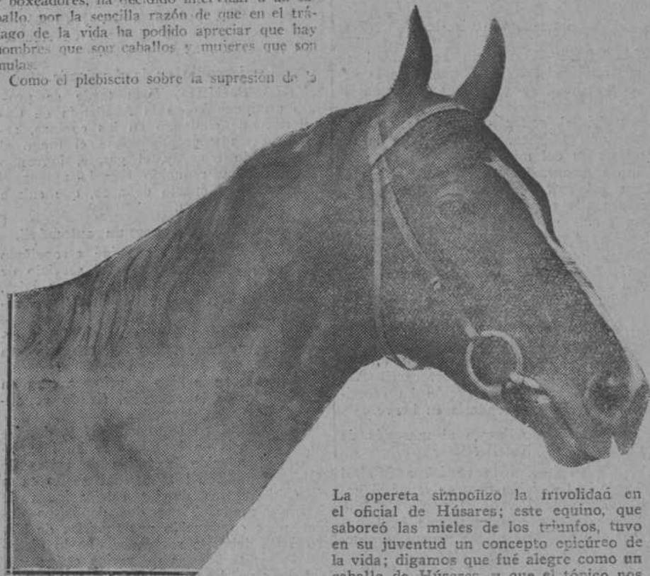
La opereta simpoñizó la trivialidad en el oficial de Húsares; este equino, que saboreó las mieles de los triunfos, tuvo en su juventud un concepto epicúreo de la vida; digamos que fué alegre como un caballo de Húsares, y que el tópico nos da la calificación justa.

El pobre caballo de este cuento dobló la cabeza, mirando con sus ojos muy abiertos al tendido, dándole una muchachumbre que se