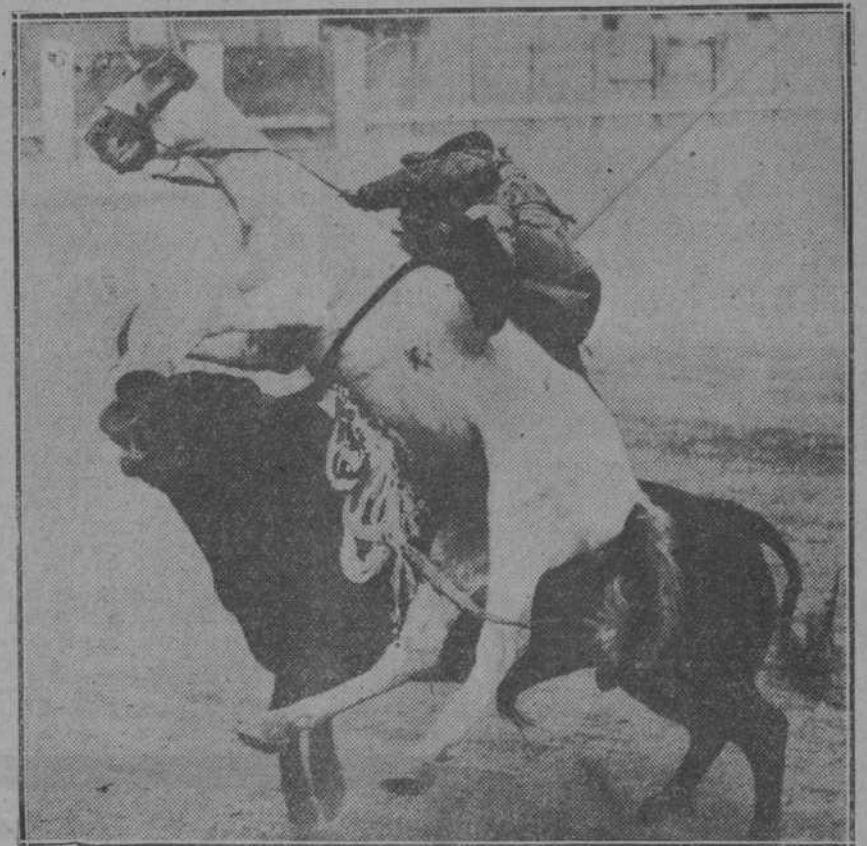
Les explicaremos a ustedes este cuadro: los cuernos del toro son como la rueda que hila los paquetes intestinales del caballo; esto no es literatura, es "realidad" comprobable en cualquier circo taurino.

—Eso son habas de otro costal. El rejoneador empieza por ser un estúpido caballista, no un tumbón, que defiende al caballo como a su propia vida. En esa suerte se puede sucumbir; pero por la desgracia, defendiéndose; no se muere a sabiendas.