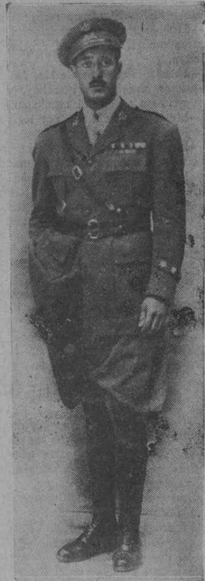
El heroico capitán Zabalza, a cuyos restos le impuso ayer el Presidente del Consejo de Ministros la Medalla Militar.

Los poblados en masa se sometían a su paso, entregando centenares de fusiles y muchas municiones. Durante el avance ha cogido un espléndido botín, pues además