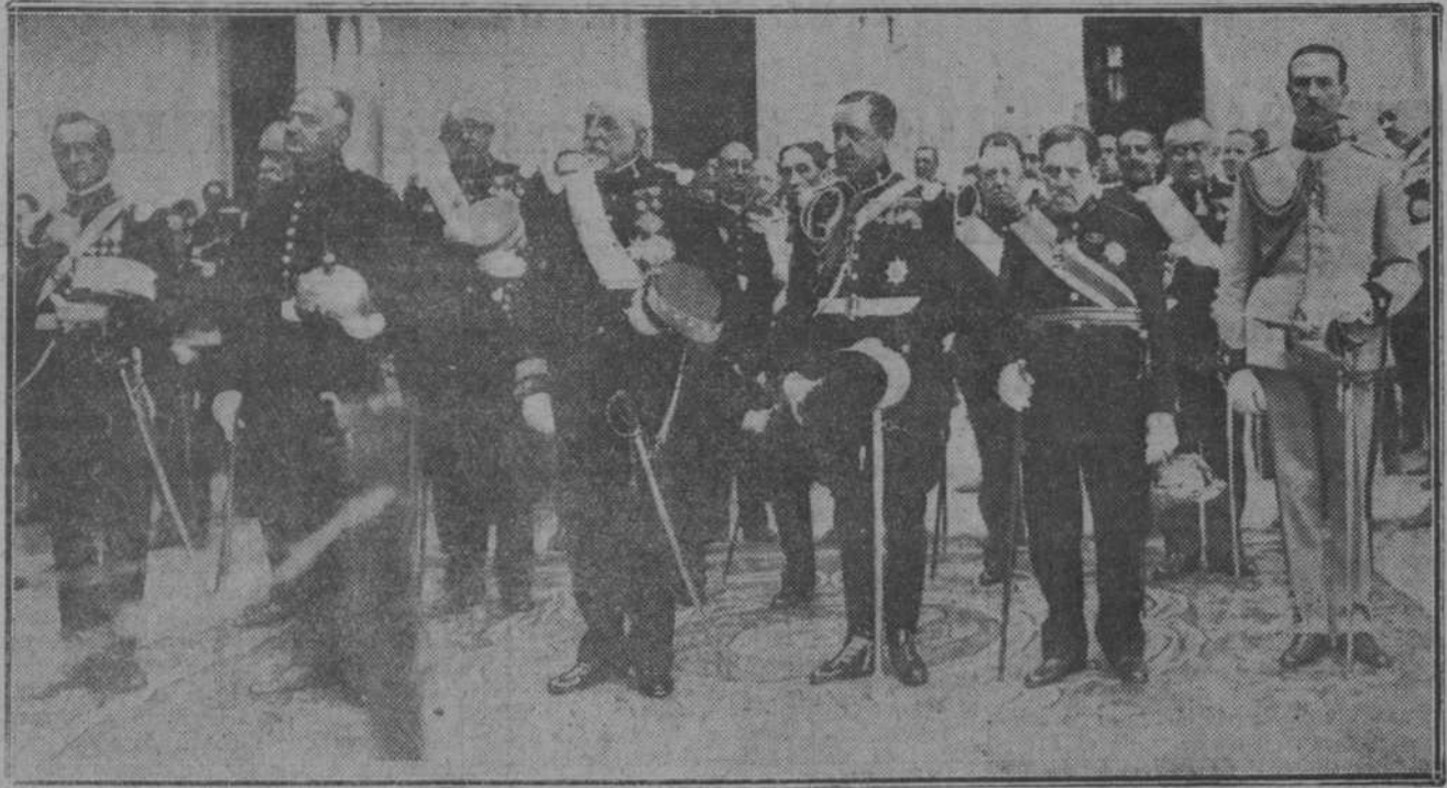
MADRID.—Los generales Weyler, Marvá y Pozas presidiendo la misa celebrada en el cuartel de la Montaña para solemnizar el Patron de Ingenieros.

LÁPIDAS MOLINERO Plaza del Progreso, 10. MAYOR, 66. Teléfono 23-29 M.