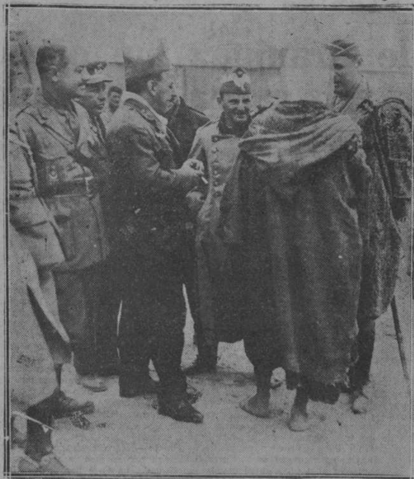
Los generales Sanjurjo y Goded hablando con un soldado francés ex prisionero, que para evadirse del campo enemigo y refugiarse en nuestras líneas recurrió al ardid de disfrazarse de moro.

cut y llega al Arbaa de Taurirt, pasando Ait Kámara, Had Tizar, Cudia Chekran e Izatimen, dominando desde ella casi toda la cabila de Bocoya y la de Beni-Urriaguel.