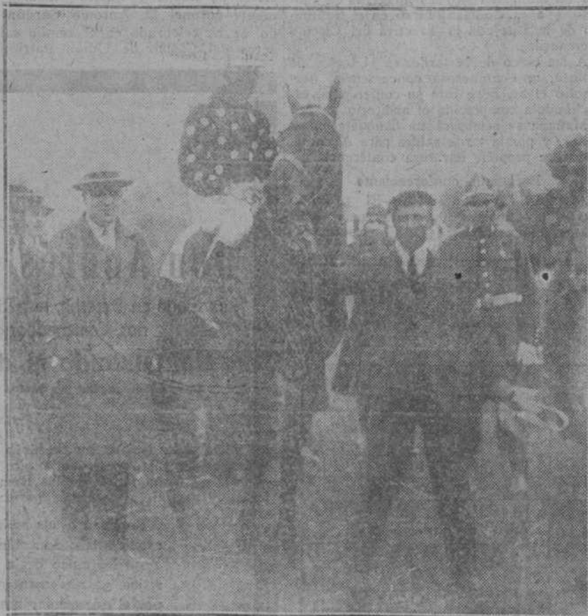
“Martinete”, del conde de la Cimera, ganador del premio de Su Majestad el Rey (10.000 pesetas) en las carreras celebradas ayer en el Hipódromo madrileño.