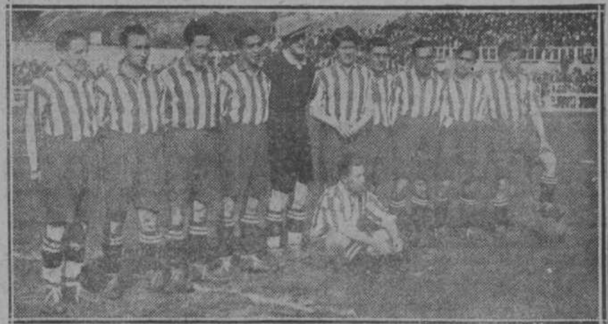
He aquí los once leones que representaron a Cas... de Mestalla. Perdieron; pero su derrota es de las que glorifican a un equipo.

Tercero, a remonte, Ochotorena y Tacolo, rojos, contra Jurico y Zumeta, azules. En este partido se igualaron en los tantos 1, 2, 3, 10 y 11. Ganaron los rojos cuando los azules se apuntaron el tanto 34.