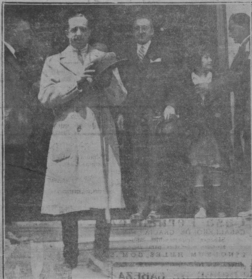
Su Majestad el Rey y el Presidente del Consejo, saliendo de inaugurar la Asamblea de Sericicultura, celebrada ayer con gran esplendor en la Exposición de Ganados.