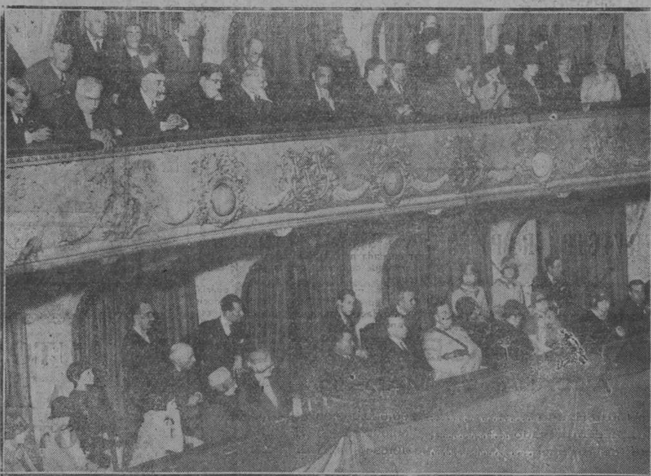
Palcos que ocupaba el Cuerpo diplomático acreditado en Madrid durante el homenaje celebrado ayer, en el teatro del Centro en honor de los valerosos aviadores que tan brillantemente han efectuado el vuelo Madrid-Filipinas.

Y termina el doctor Montes su magnífico discurso diciendo que España salvará la civilización con ese "raid", pues la llegada de nuestros aviadores avivará nuestra espiritualidad, y no perderemos nada de