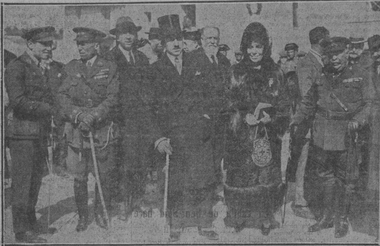
La madrina de la bandera del Somatén de Pozuelo, marquesa de Heredia Spinola; el general Flores, el gobernador civil de Madrid y otras autoridades que asistieron al acto de la entrega de la bandera.

riando su más vivo anhelo, por impedirse lo inaplazables ocupaciones, ya que conocido es de todos su entusiasmo por los Somatenes, puesto que ha sido y es el alma de ellos y su más fervoroso paladín, pues dicha institución cívica y ciudadana, que antes sólo tenía un carácter regional, hoy, gracias al impulso mágico de su voluntad férrea, había resurgido a nueva y esplendorosa vida, extendiendo su campo de acción por toda España, lo que constituye para el insigne caudillo general Primo de Rivera un timbre más de gloria y un servicio más que añadir a los altos e inestimables que ha prestado a la