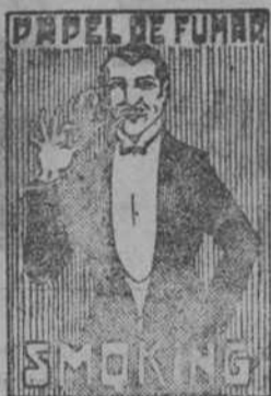
SERA EL PREFERIDO POR LOS FUMADORES DE COSTO

DOLOR DE CABEZA Neuralgias y jaquecas desaparecen en cinco minutos con la HEMICRANIA del Dr. M. CALDEIRO 3,50. Pídense en farmacias.