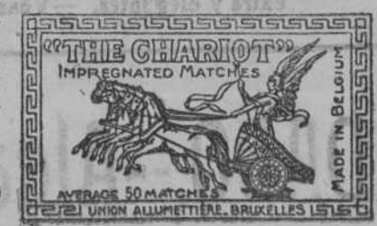
En todos los establecimientos

Al acto pueden asistir cuantos señores lo deseen.