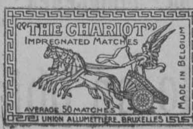
En todos los estancos

Rabat. La semana pasada se ha destacado por un hecho saliente en el aspecto económico del protectorado. Frecuentes son las visitas que vienen realizando elementos técnicos en el comercio, la agricultura y la economía, cuyo primordial objeto no es otro que el de conocer de visu el desarrollo colonizador de Francia en Marruecos. Una de las visitas que más interés han despertado en los medios oficiales ha sido la de los miembros de la Cámara de Comercio americana de París. Son estos viajeros—viajes en que se ponen de manifiesto el interés de otras naciones que ponen su vista en el orden financiero y económico en el protectorado francés. Ha tenido esta excursión un carácter sino oficial, casi oficioso. Dos organismos del protectorado han acompañado a los súbditos americanos en su viaje de estudio a las ciudades más importantes de la zona, y el viaje se ha cerrado, quizás por ese carácter oficial de que hablamos, con un acto que ha presidido el Residente General y en el que éste pronunció un discurso de vivo interés. Señaló el Residente las actitudes colonizadoras del imperio marroquí. Pacificada, edificada y organizada, se ha creado ella misma en un espacio de veinte años.