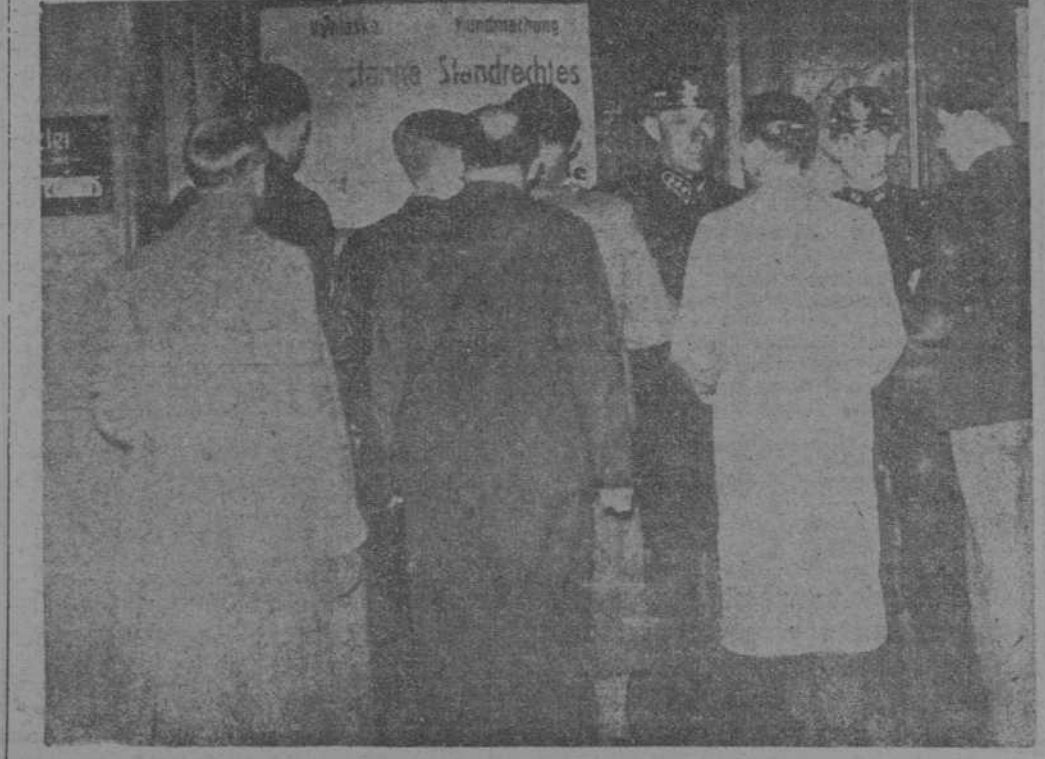
Los habitantes de la región de los sudetas leyendo la proclamación

de la fuerza, de acuerdo con Francia, Checoslovaquia y Rusia.