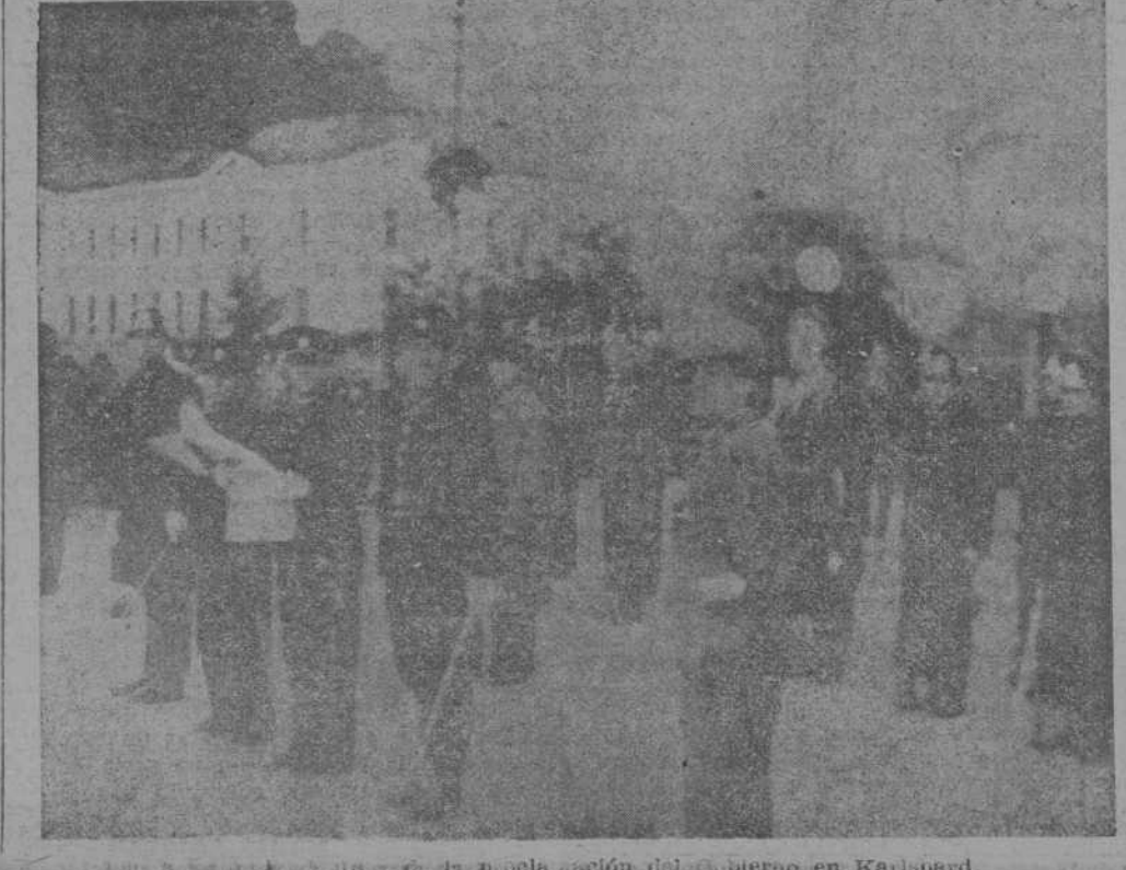
La proclamación del Gobierno en Karlova