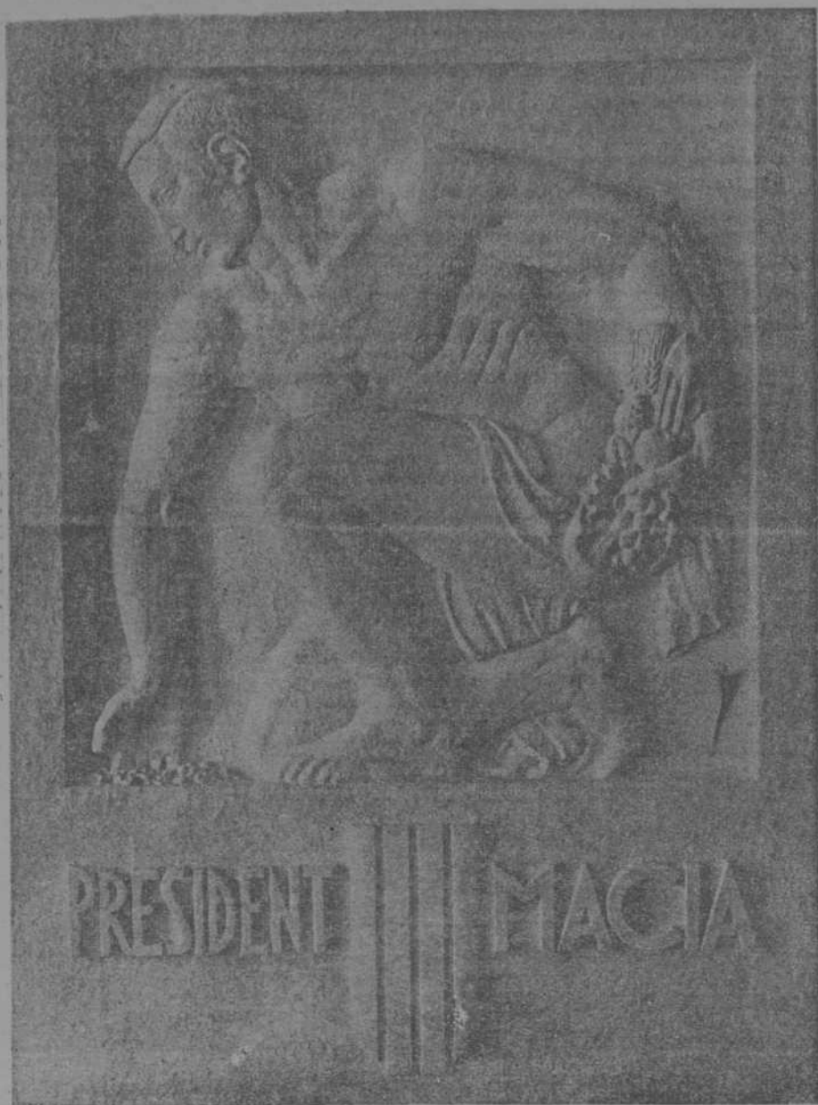
De ella es autor el escultor Rafael Solano y Balus y ha sido premiada con 5.000 pesetas en el concurso convocado por la Consejería de Trabajo de la Generalidad