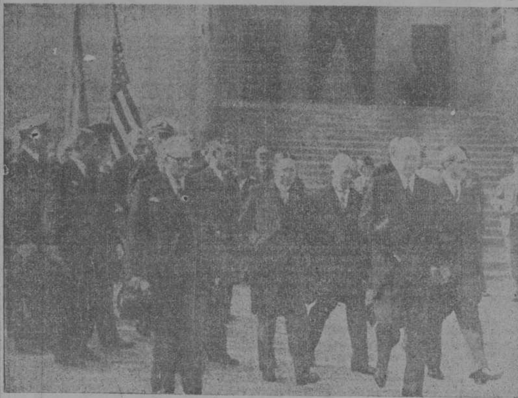
El ministro de Colonias M. Mandel, el embajador de los Estados Unidos Mr. W. C. Bullit y el ministro de Negocios Extranjeros M. Bonnet, en la inauguración del monumento conmemorativo del desembarco de los primeros soldados norteamericanos en Francia