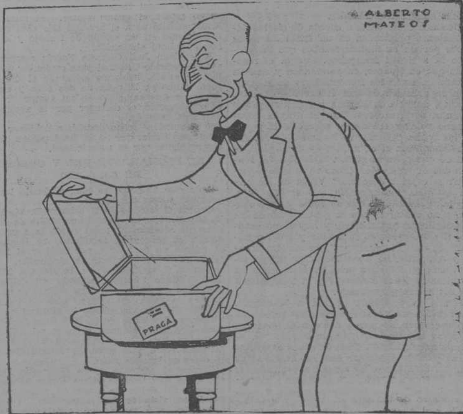
—Está visto que lo único que puedo hacer aquí es la maleta.