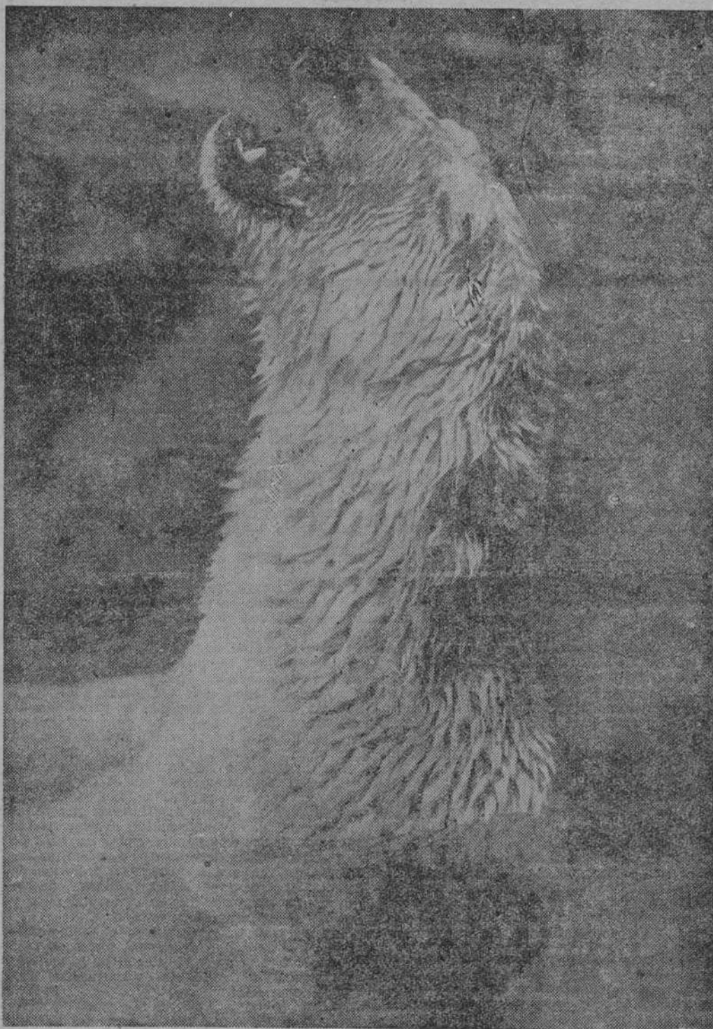
En el Parque Zoológico de Vincennes el oso, a pesar de permanecer casi siempre en el baño, no puede librarse de los efectos de la elevada temperatura