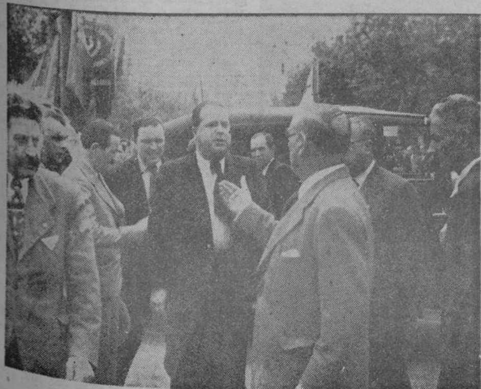
El alcalde al llegar frente al monumento a Pi y Margall