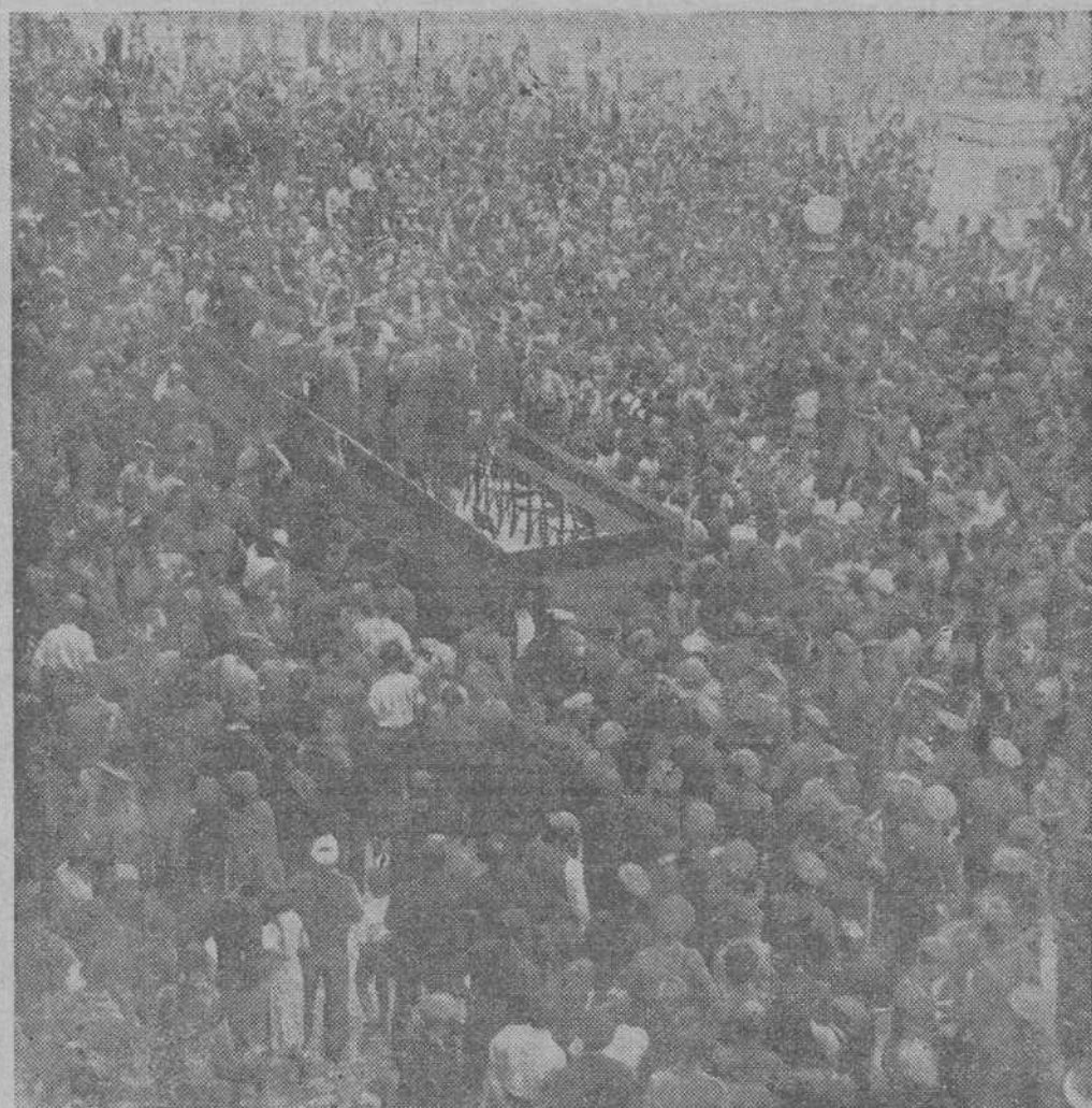
LA HEROICA 43 DIVISION Gerona. — El acto de la recepción en la Plaza de la Independencia, con asistencia del ministro de Estado don Julio Alvarez del Vayo

Mr. Chamberlain — es que de vez en cuando tratamos de averiguar si existen perspectivas razonables de éxito para la finalidad que nos proponemos. Si llegara ese momento, nos consideraríamos muy felices con ofrecer nuestros servicios, solos o en unión de otros, para poder poner fin al conflicto español".