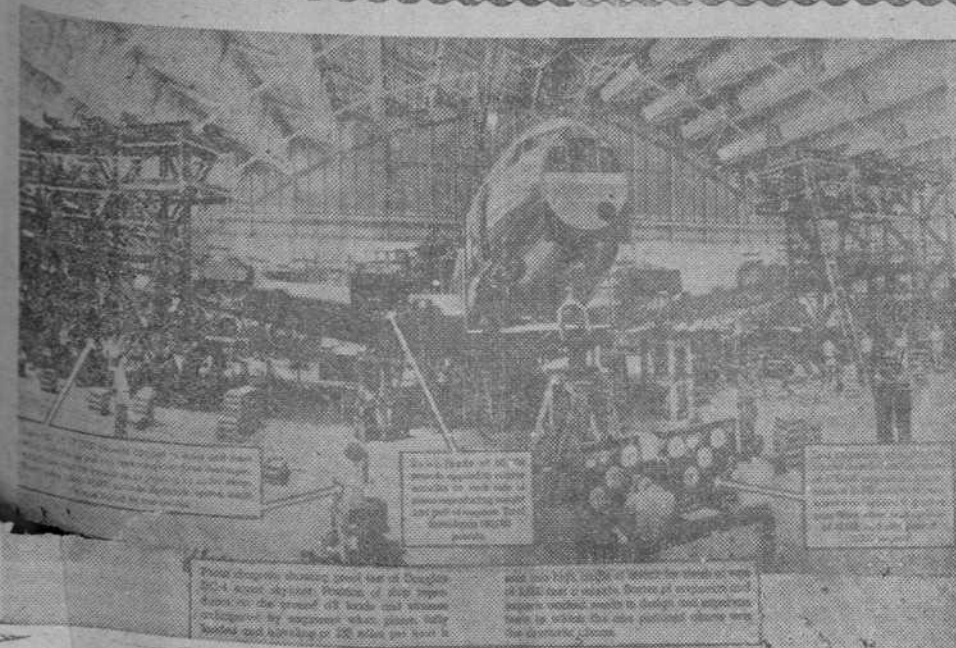
LA AVIACION AMERICANA Santa Mónica (California). — El nuevo avión Douglas, de transporte, que se está contruyendo

la idea de reconocer el bloqueo de las costas gubernamentales, reconocimiento que Franco busca obtener mediante la intensificación de los bombardeos. Demuestra el poco valor del argumento de que la mayor parte de los buques ingleses que trafican en los puertos españoles son extranjeros y sólo enarbolan la