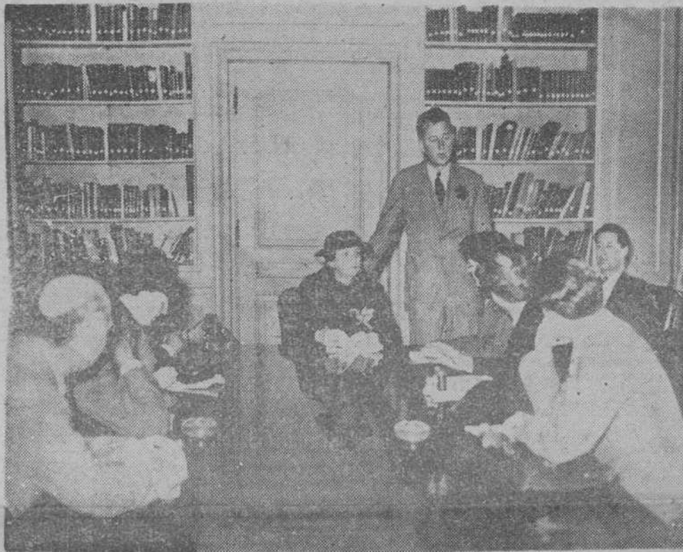
LA CONFERENCIA INTERNACIONAL DEL TRABAJO. Ha asistido a la Conferencia Internacional del Trabajo, celebrada en Ginebra, el ministro de Trabajo Miss Perkins, que a su paso por París, fué interrogada por los informadores en la Embajada de los Estados Unidos

Londres, 16. - La Sección de Gales de la Unión Nacional de Marineros dirigió un comunicado no una protesta contra las declaraciones del primer ministro. En el país de Gales se han organizado varios mítines que han aprobado nuevas protestas. La cuestión será planteada en el Congreso anual de la Unión Nacional de Marineros que se celebrará en Londres el día 11 de julio. - Ag. España.