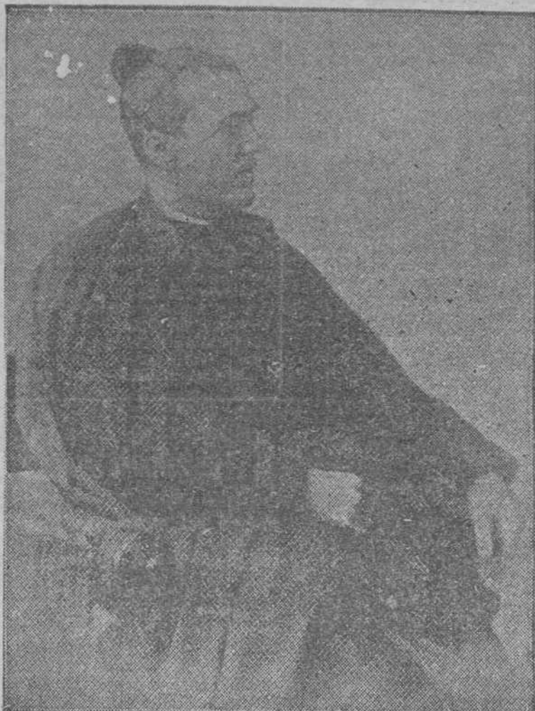
RETRATO DEL POETA, EN SU VEJEZ