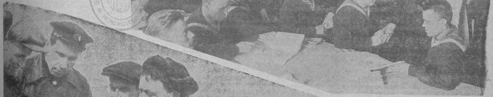
LA CLASE DE HISTORIA DE LOS PUEBLOS DE LA U. R. S. S. Los marineros de la Flotilla militar del Dnieprar