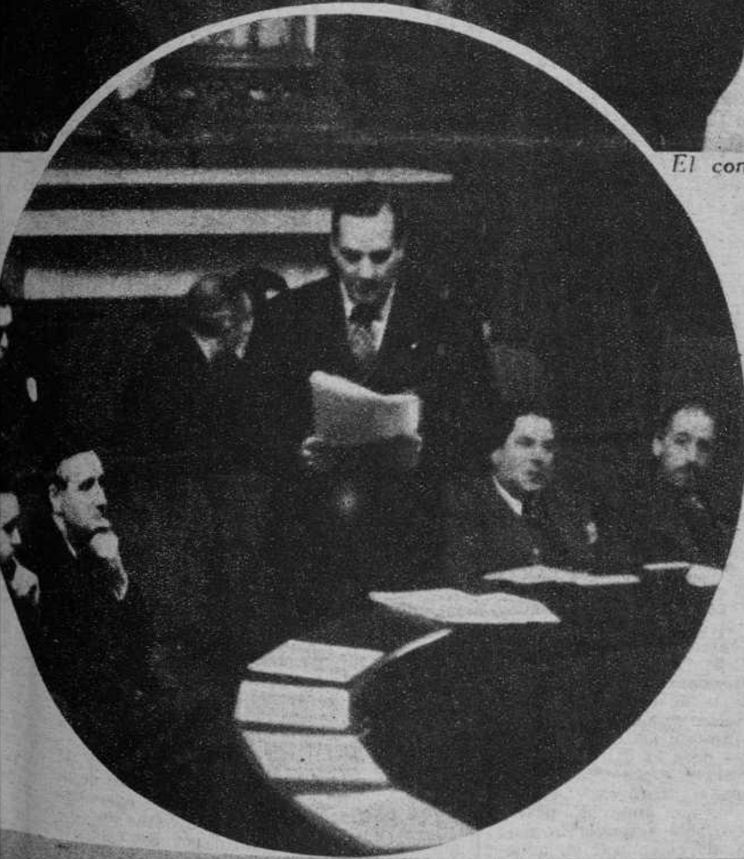
El consejero Tarradellas, durante la lectura de su discurso