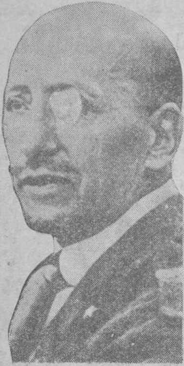
D'Annunzio ha muerto

Gardone Riviera (Brescia), 1.—Urgente.—A las ocho y media de la noche ha fallecido el poeta Gabriel d'Annunzio.