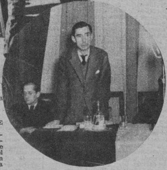
General Miaja en la Plaza de la República

La conferencia de José Bergamín sobre "La verdadera historia de "La mano tendida"