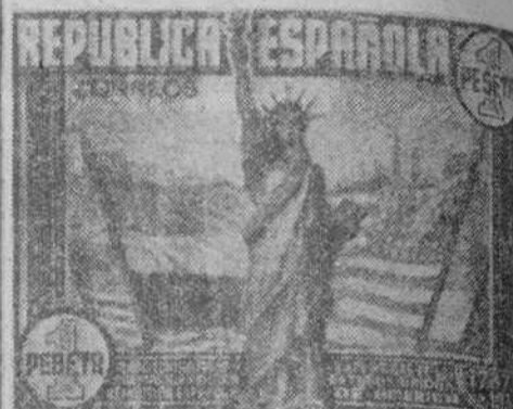
Sello conmemorativo de la confraternidad hispanoamericana