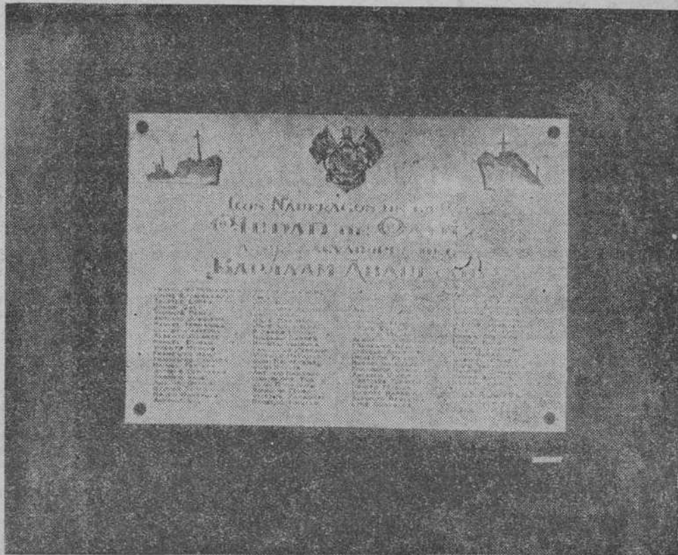
La placa dedicada a los tripulantes rusos del "Arlaban Abarcoa"