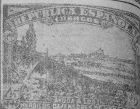
Sello editado en conmemoración de la heroica defensa de Madrid