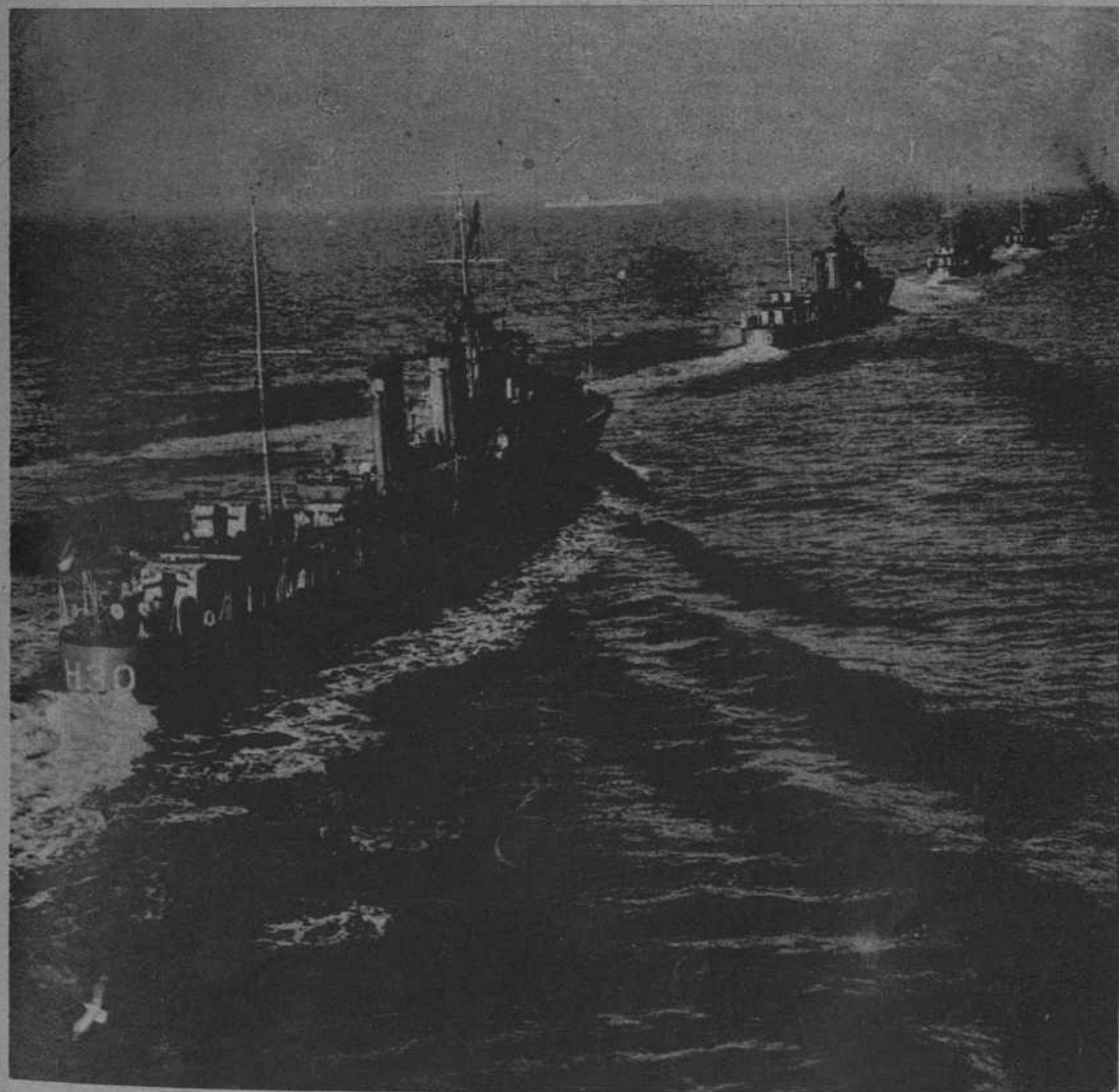
La octava división en alta mar, con rumbo a Gibraltar

El petrolero británico "Stanbridge", fué bombardeado por la aviación italiana en el puerto de Gijón, causando grandes destrozos en el puente de mando, en las canoas de salvamento y en la cubierta. Al regresar a Falmouth se ha obtenido la fotografía que ofrecemos, que constata el éxito de la no intervención de Mr. Eden. Las patrullas británicas que con las francesas evitarán en el Mediterráneo que sean atacados por los piratas los buques franceses y británicos, permitiendo la agresión a los de la República española