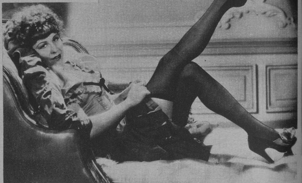
Anna Sten, actriz europea actualmente en los Estudios norteamericanos, a quien muy en breve veremos en «Naná», de los Artistas Asociados