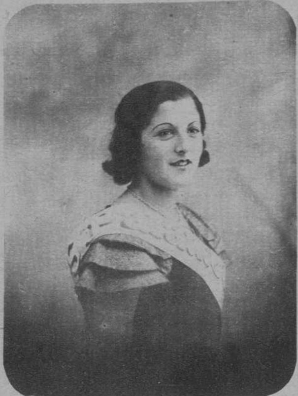
«Miss Palamós 1934»