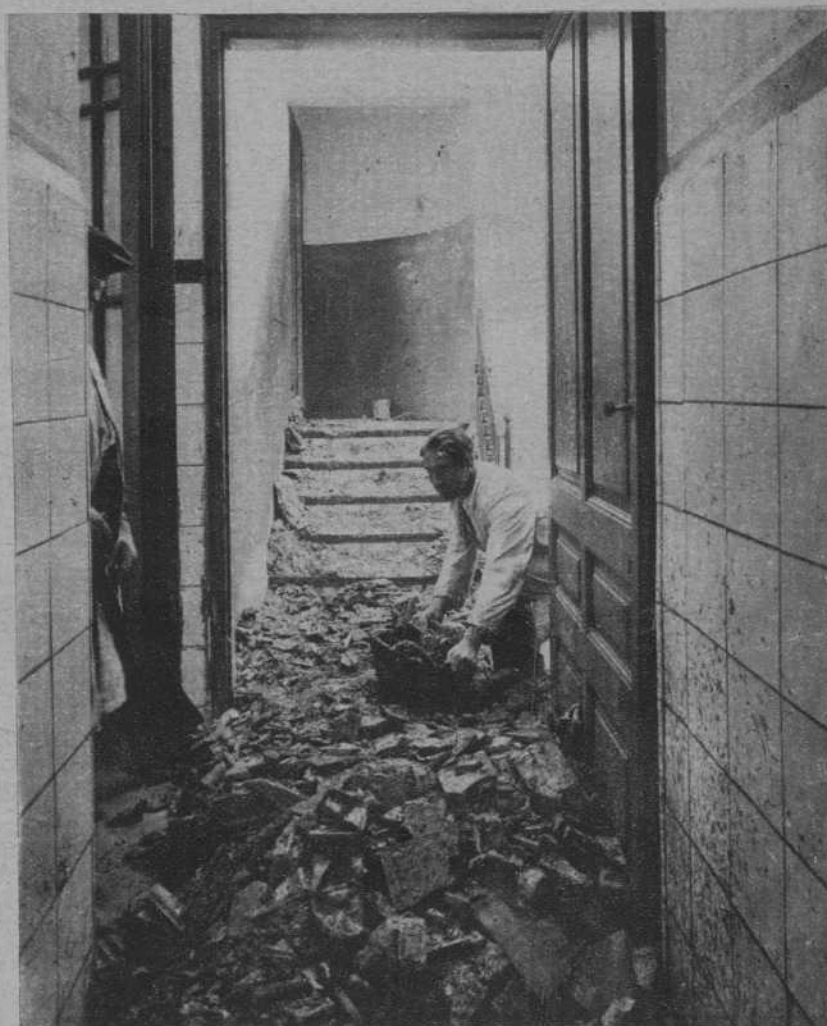
Un pasillo de la sala del Manicomio de San Baudilio de Llobregat. Retirando los cascotes del techo derrumbado. — (Foto P. de Rozas)