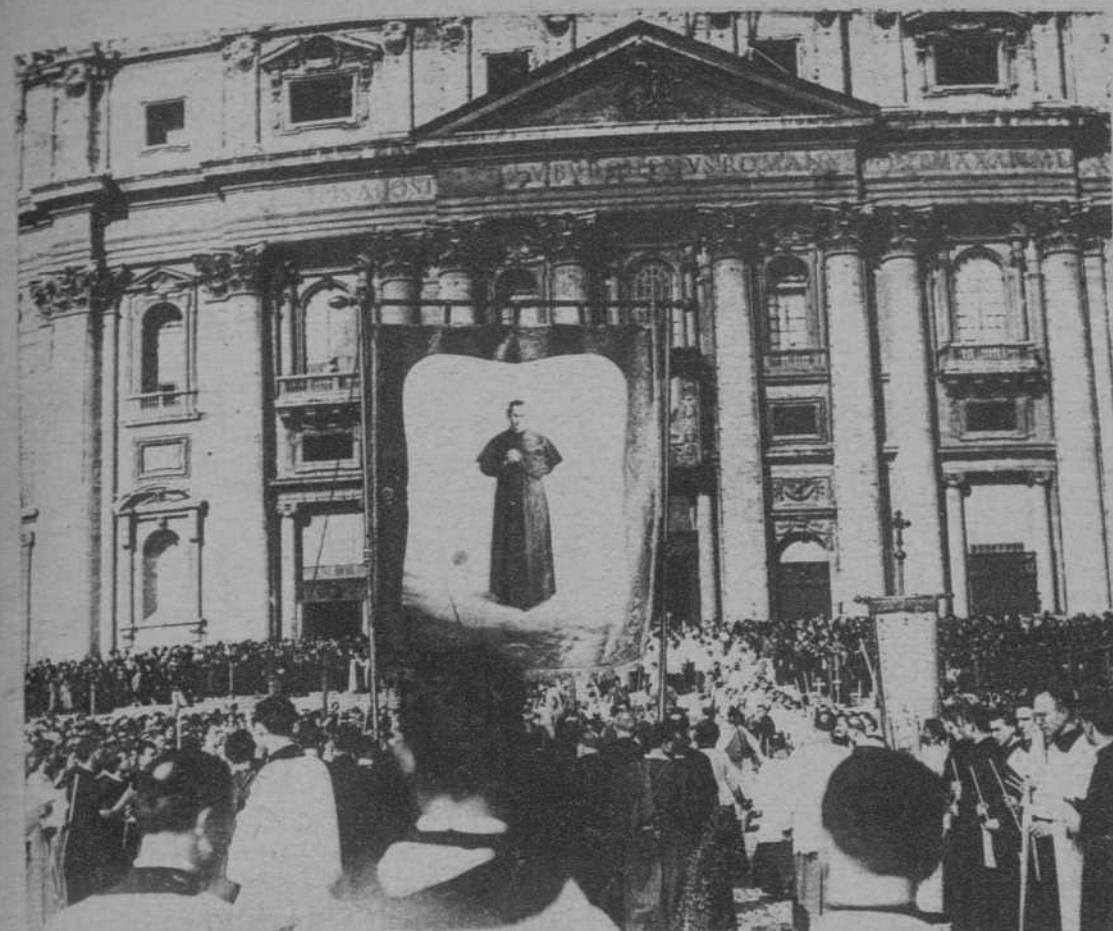
La procesión celebrada en Roma, con motivo de la canonización de Dom Bosco.