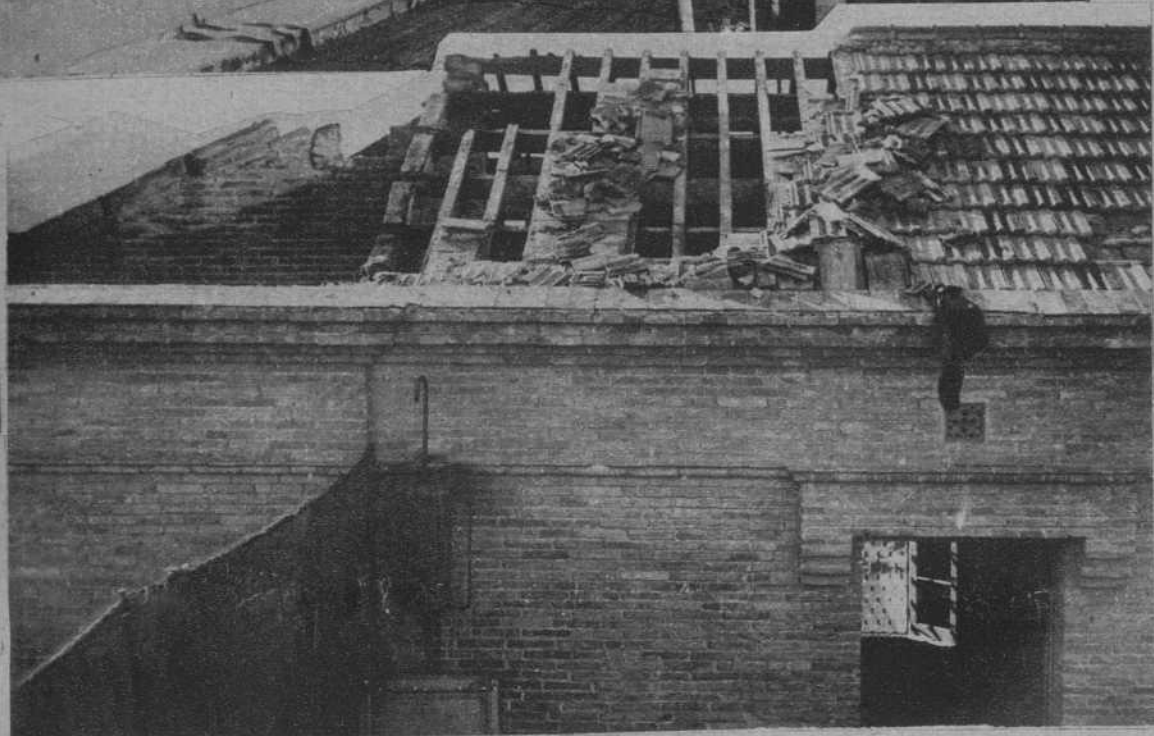
El techo derrumbado de la sala de calderas.