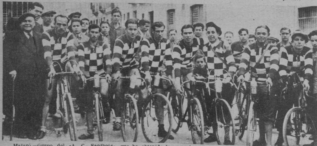
Mataró.—Grupo del «A. C. Santbotà», que ha obtenido la copa del «Sport Ciclista Mataroní» en la carrera ciclista.