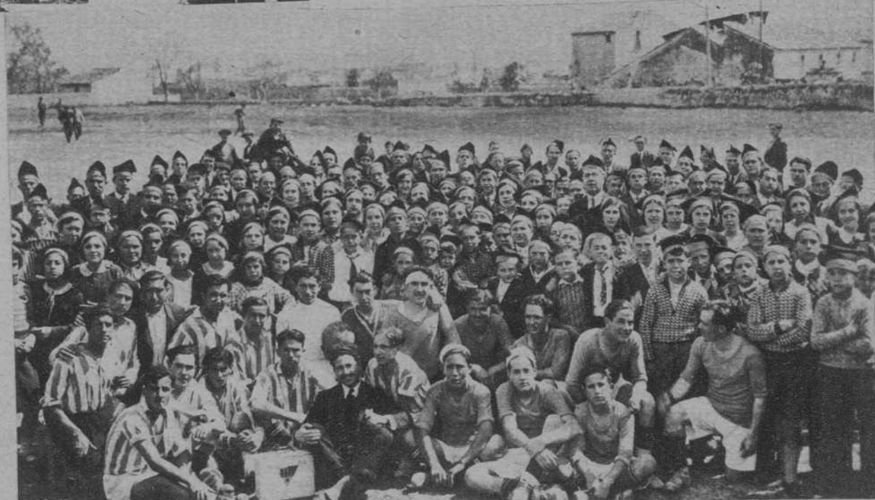
Torredembarra.—La Sociedad Coral, que dió un concierto a beneficio del Hospital, en el campo de Fútbol