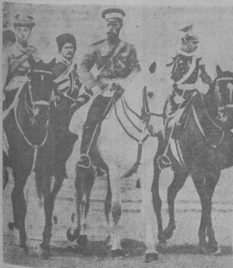
El Zar Nicolás con sus hijos, en una revista militar.