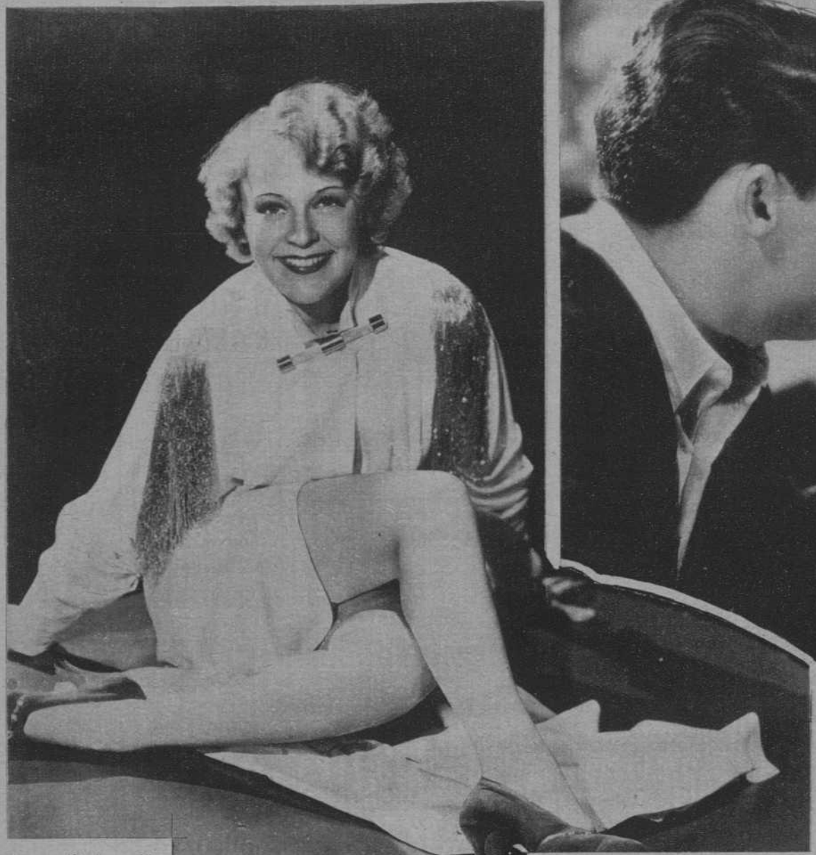
La gentil Jean Howard, de la M. G. M., luce en esta foto una elegante capa, de gran moda en Hollywood