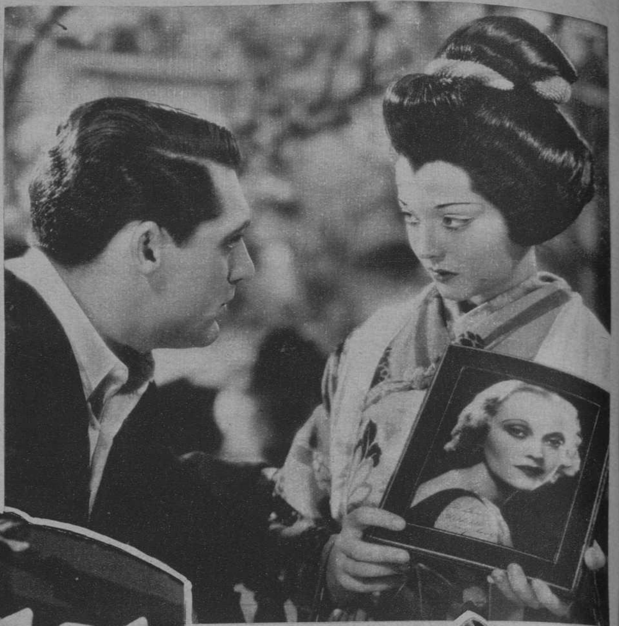
Sylvia Sidney y Gary Grant, los dos famosos artistas de la Paramount