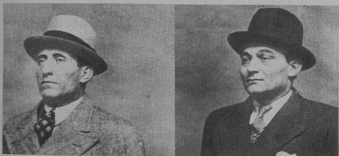
El barón de Lugsats (a la izquierda) y Ventura. Clamado, Carbone, miembros del hampa internacional, detenidos y acusados de haber participado en el asesinato del magistrado M. Prince, aunque hasta ahora no ha podido probarse su culpabilidad.