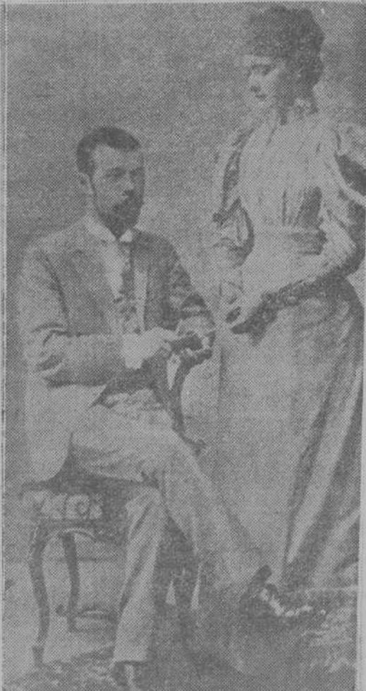
El Zar Nicolás y la Emperatriz Alejandra, en los días de su matrimonio, a finales del siglo XIX, con silueta de dos buenos burgueses

Se examinó la llamada casa de Ipatieff, donde fueron muertos los zares, casa que les servía de prisión y