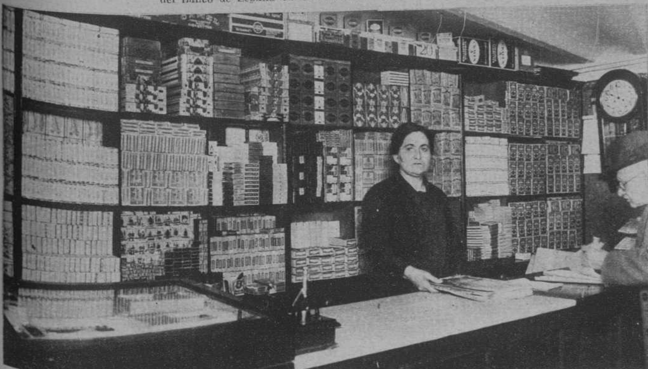
El estanco del Paseo de la República, núm. 2, en el que entró un individuo que se apoderó de una carpeta que contenía 2.200 pesetas en sellos y timbres móviles.