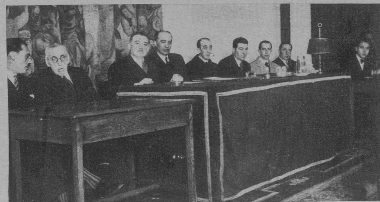
Madrid.—La presidencia de la sesión de apertura de las Conferencias Francoespañolas de la Entrepayuda Universitaria Internacional.