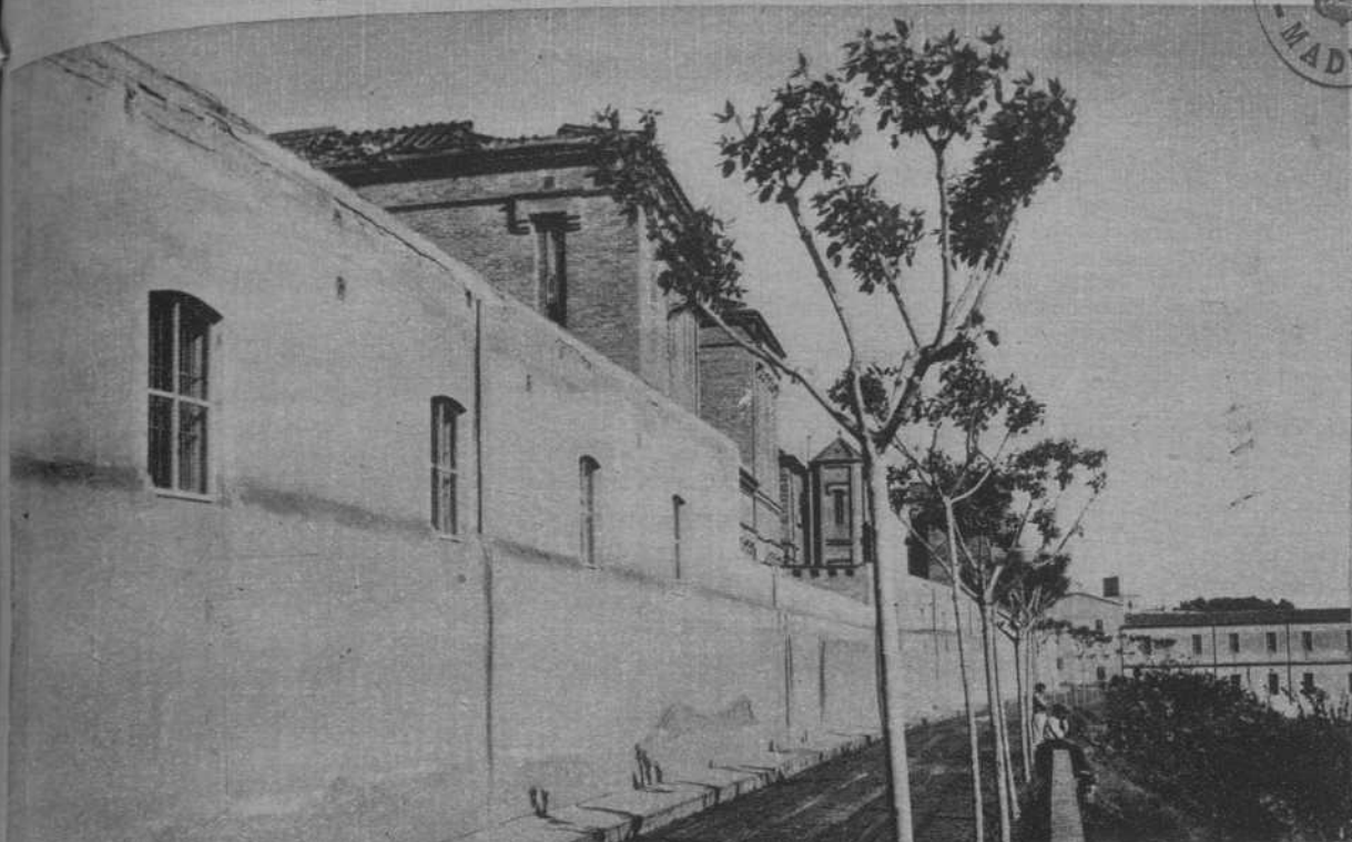
La parte incendiada ayer tarde en el Manicomio, vista desde la carretera