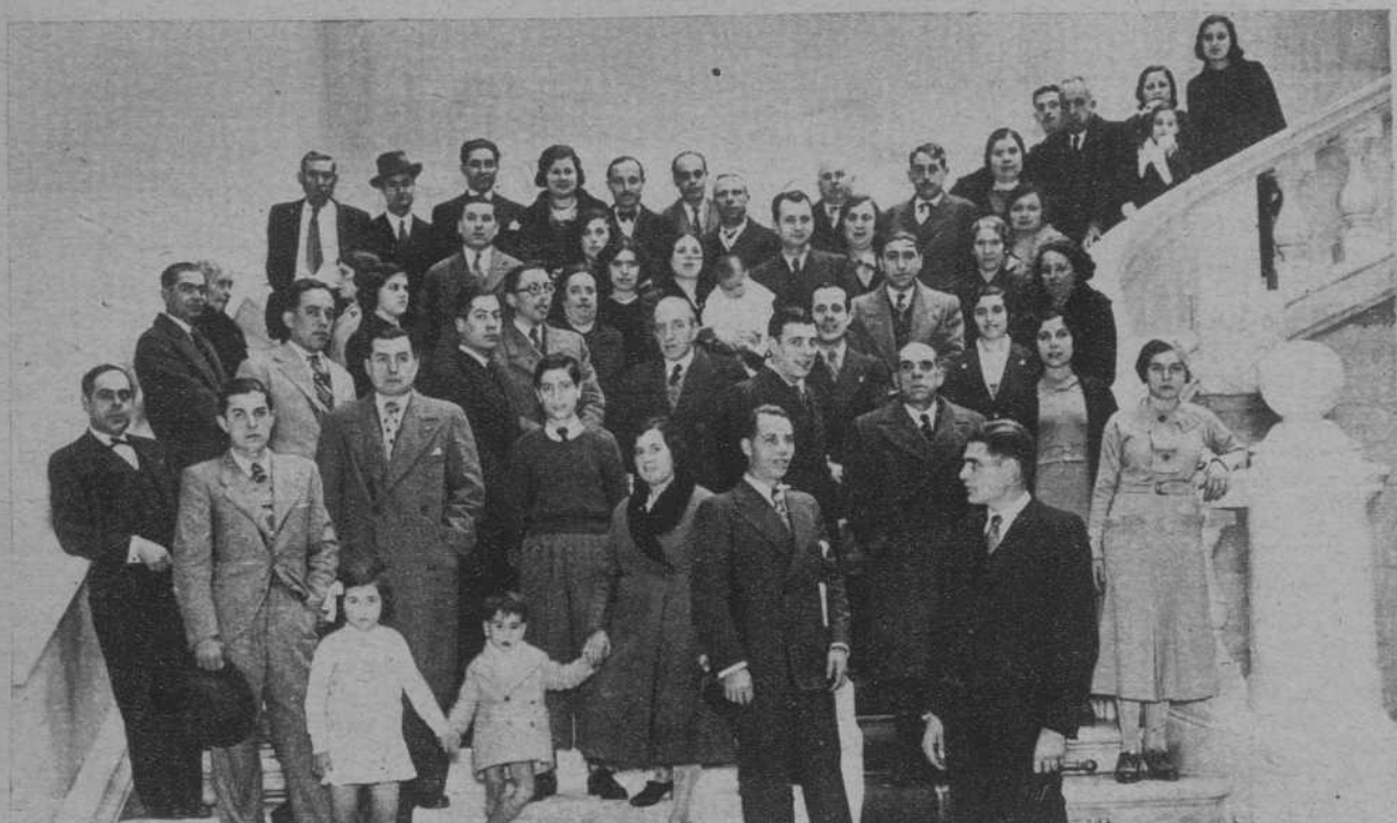
Visita al Parlamento de Cataluña de la Sociedad Cultural «Patria Nova».