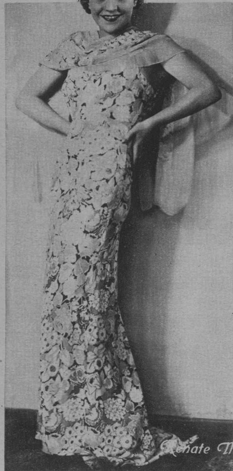
La sugestiva «star» alemana, Renate Müller