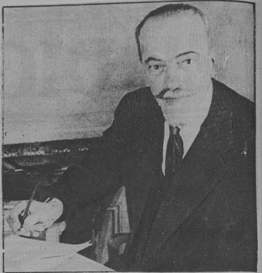
El gran duque Alejandro de Rusia, que acaba de fallecer.