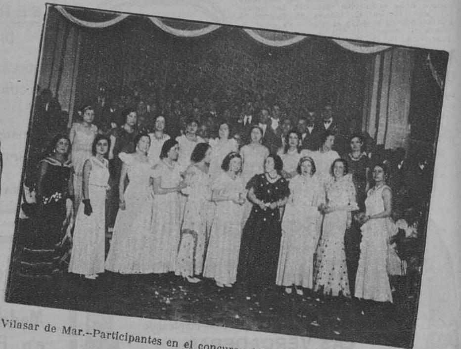
Vilasar de Mar.—Participantes en el concurso del vestido de cuatro pesetas