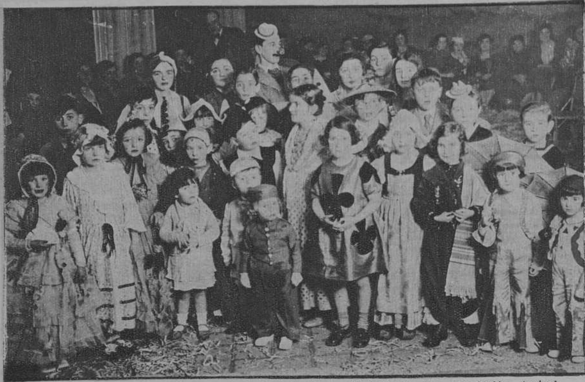
Grupo de niños que asistieron a la fiesta infantil de disfraces de la «Asociación Amical Francesa».