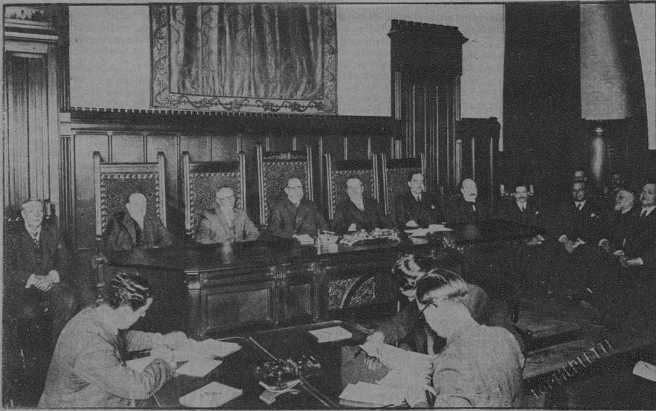
Sesión celebrada en la Caja de Pensiones, para festejar el XXV aniversario de la fundación del Instituto Nacional de Previsión