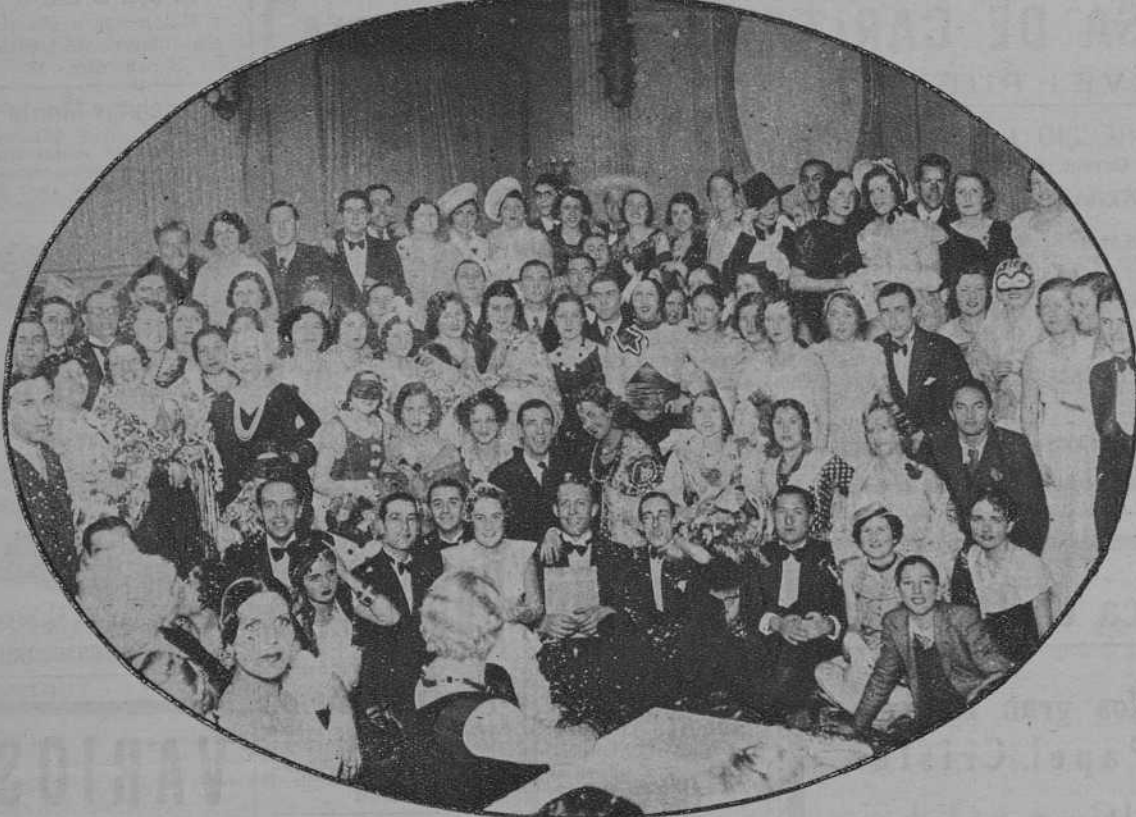
El baile de máscaras de la colonia italiana, en el Parque.