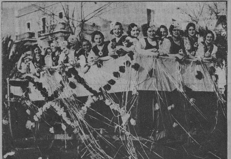
Córdoba.—Una carroza premiada en la batalla de flores.—(Fot. Santos)