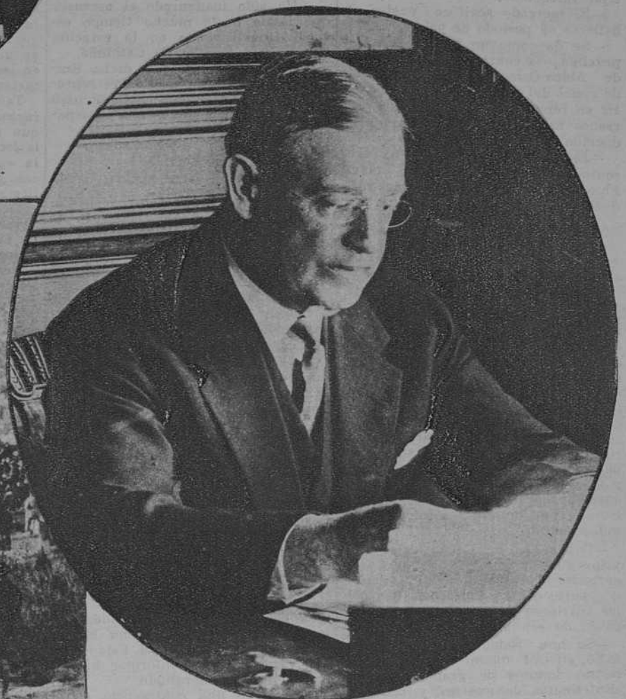
M. Edge, embajador de los Estados Unidos en París, al que el Presidente de la República impuso las insignias de la Legión de Honor.