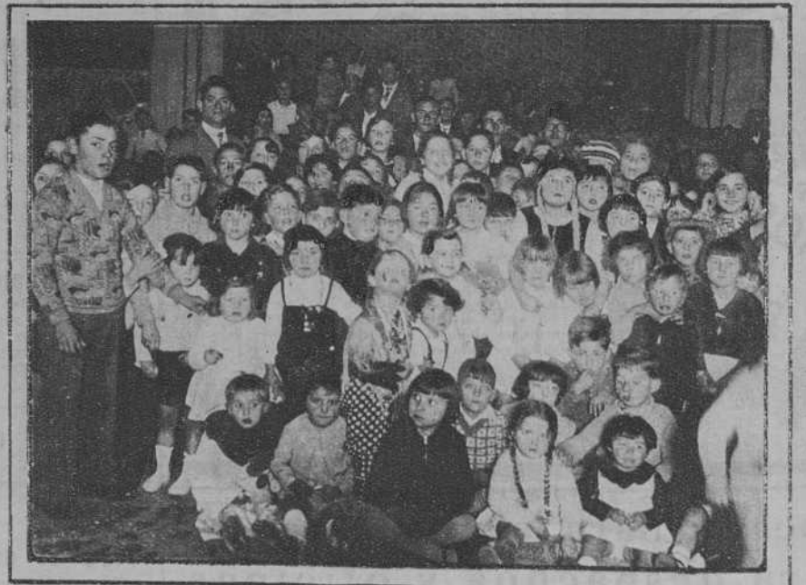
Vilasar de Mar.—Baile infantil