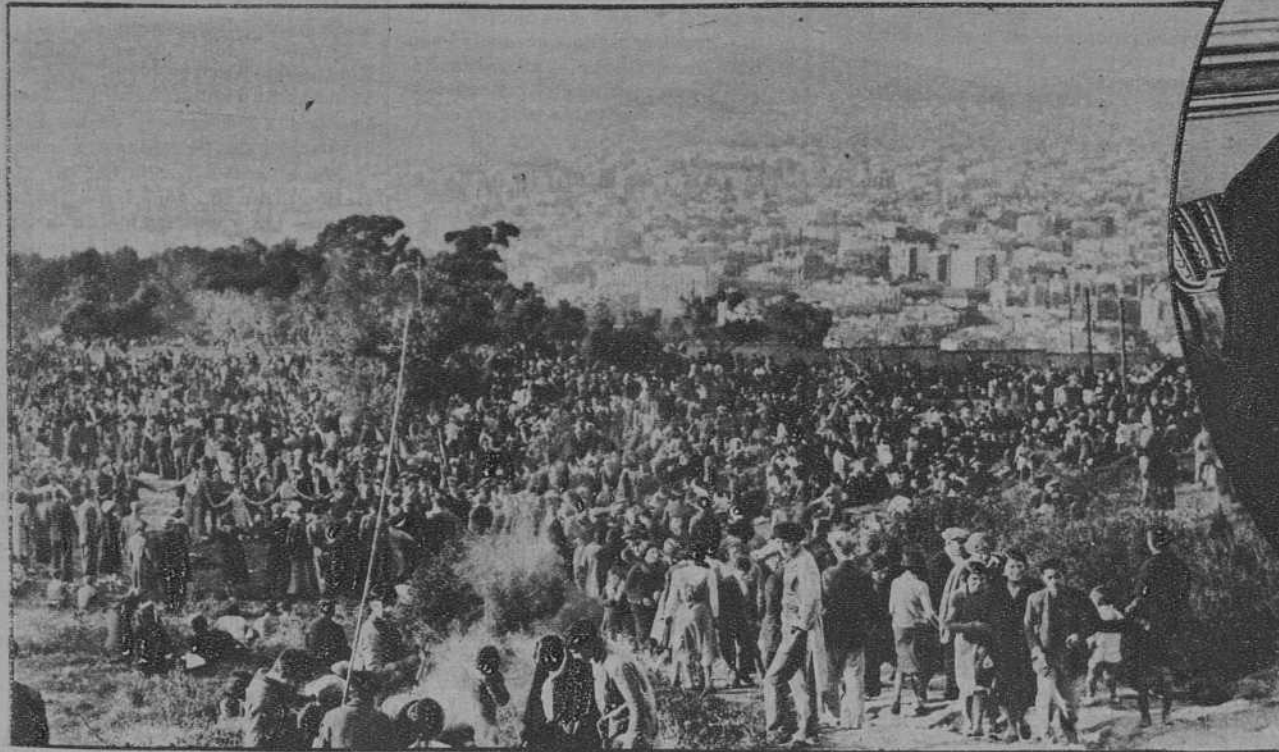
La multitud, en la montaña de Montjuich, celebrando el entierro de la sardina.