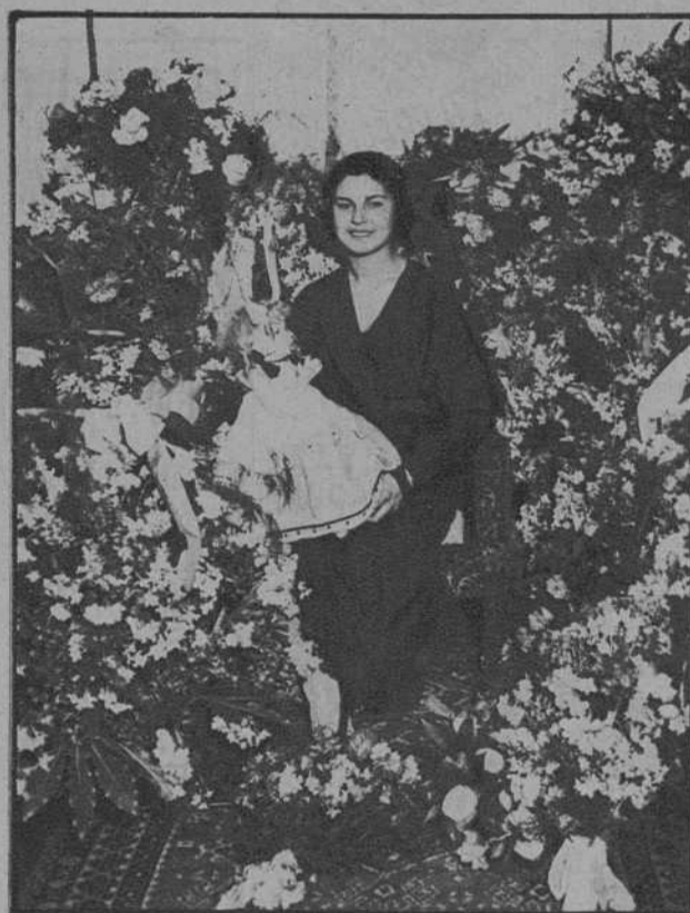
Vigo.—«Miss España», en su casa, rodeada de flores