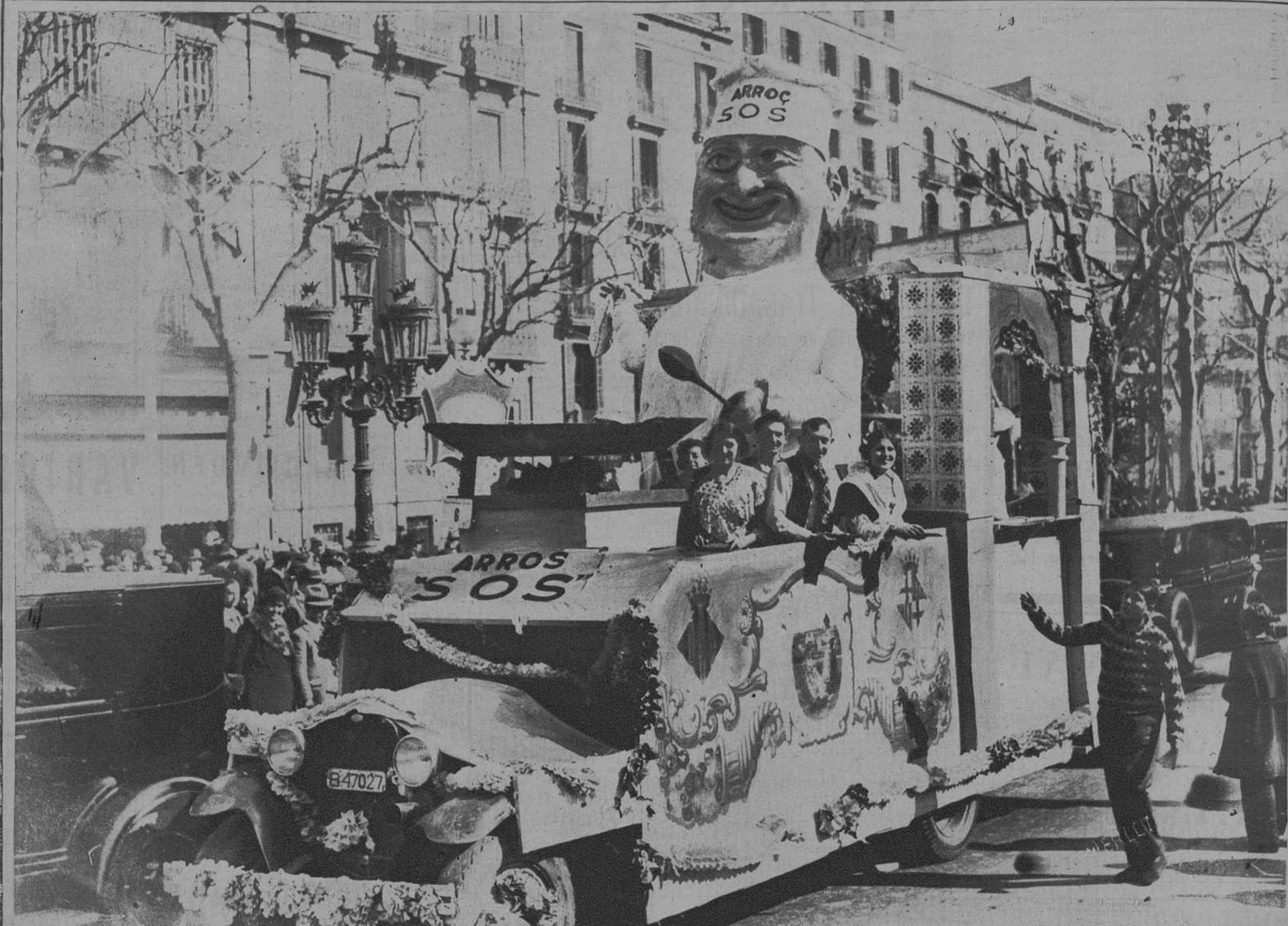
Una de las mejores carrozas premiadas por el Excmo. Ayuntamiento de Barcelona, «Arroz SOS», presentada por los Sres. Hijos de J. Sos Borrás, de Algemesi (Valencia), y que ha llamado poderosamente la atención del público.