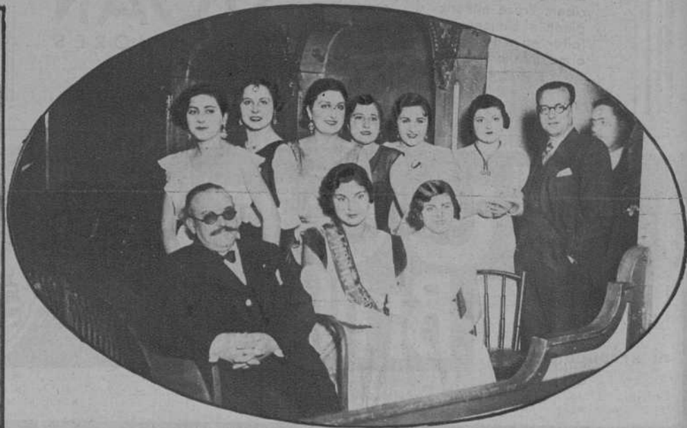
«Miss España» y las Mises gallegas.