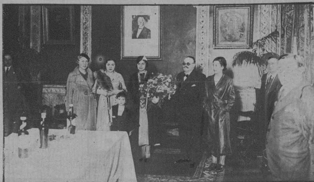
Vigo.—«Miss España», con el alcalde