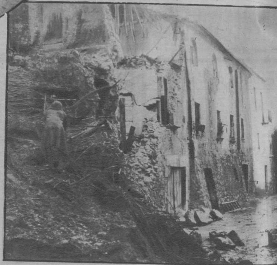
Casa del barrio de Pedret, derrumbada a causa del temporal