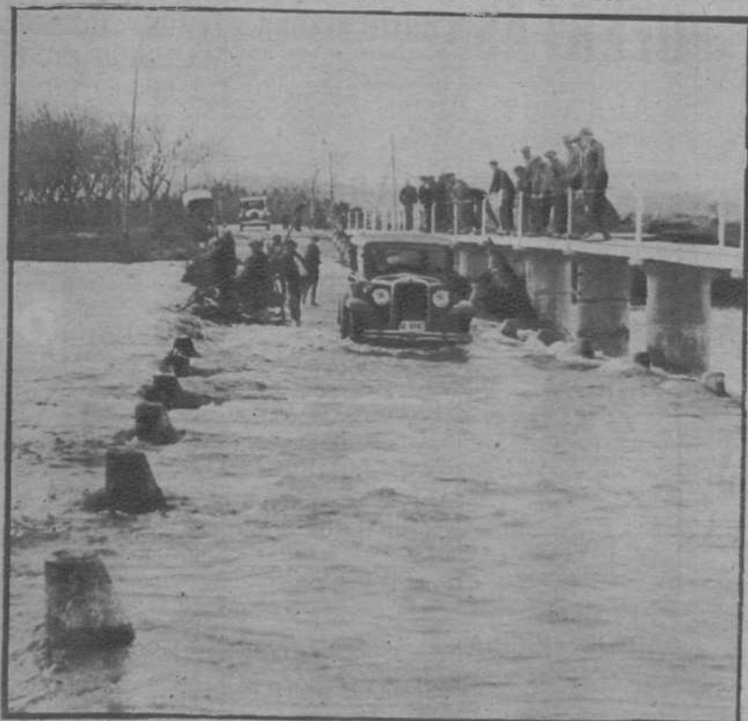
La carretera de Figueras, por donde se hizo casi imposible el tránsito