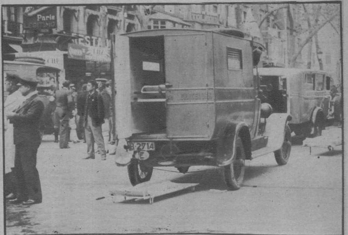
El servicio de Ambulancia, en disposición de actuar.