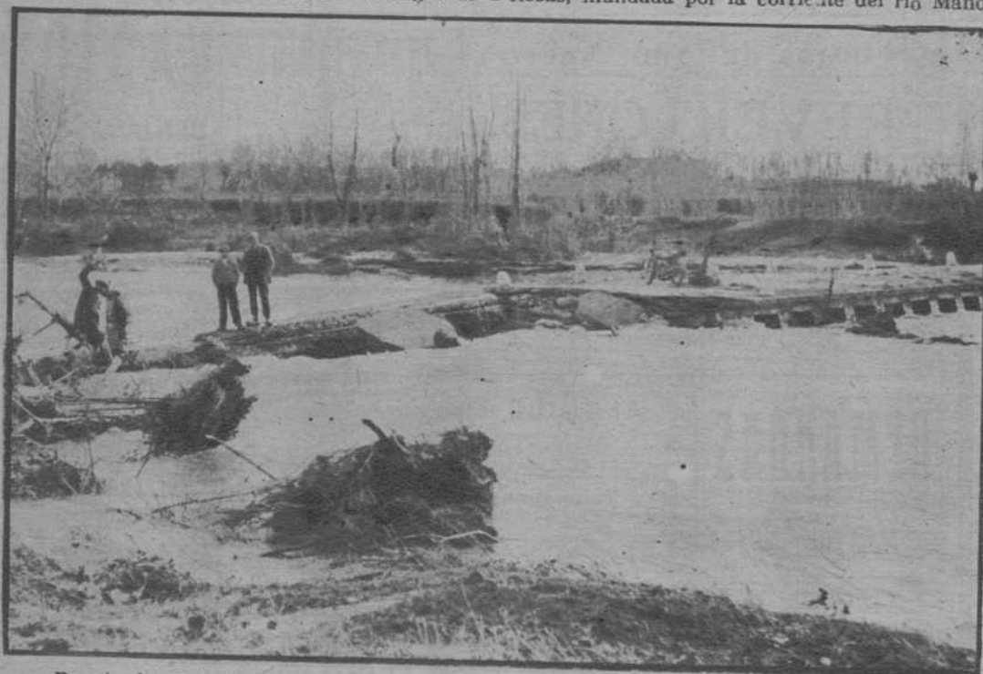
Puente del Príncipe, en la carretera de Madrid a Francia, destruido a causa del desbordamiento del río Manol