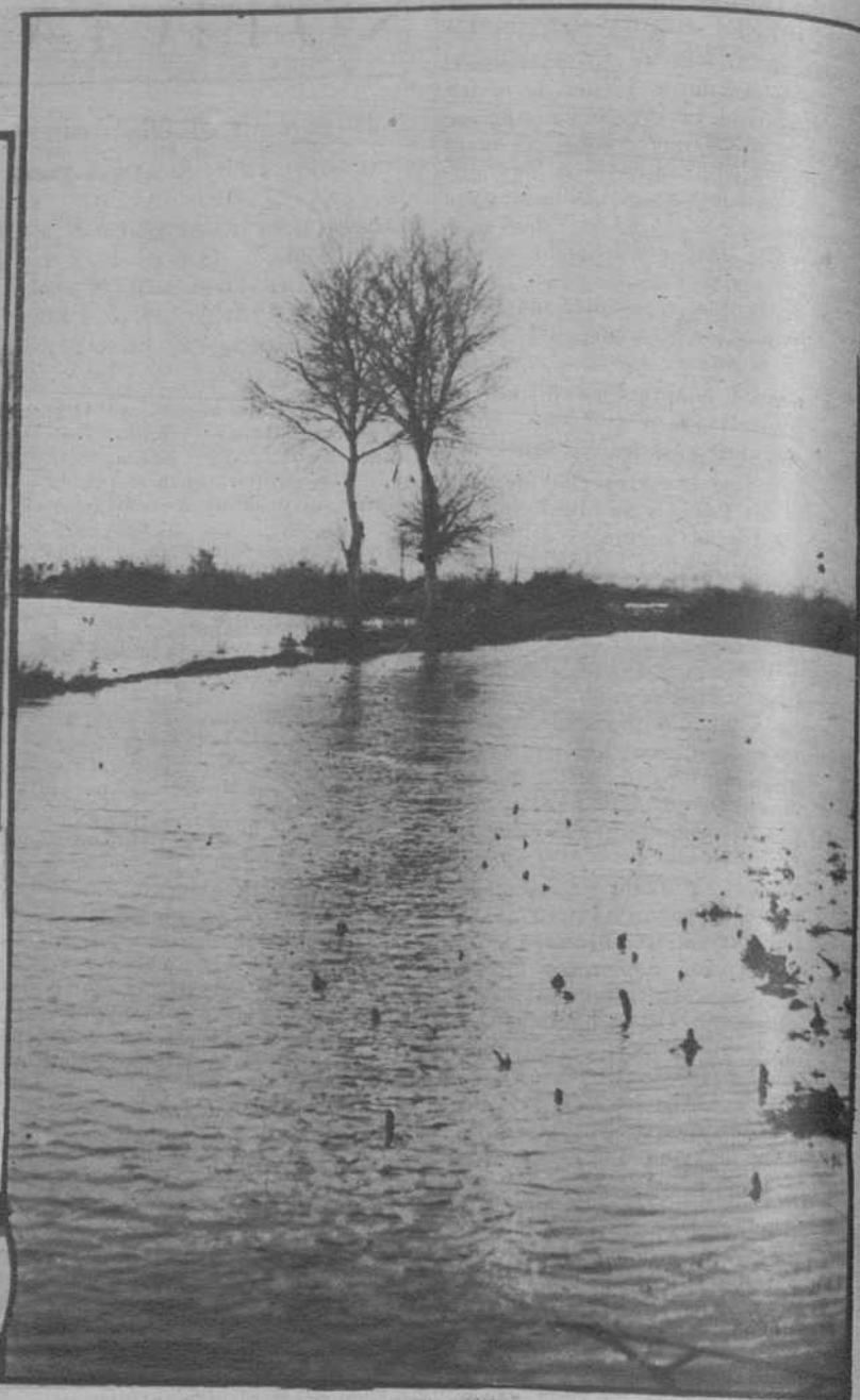
Alrededores de Castelló de Ampurias