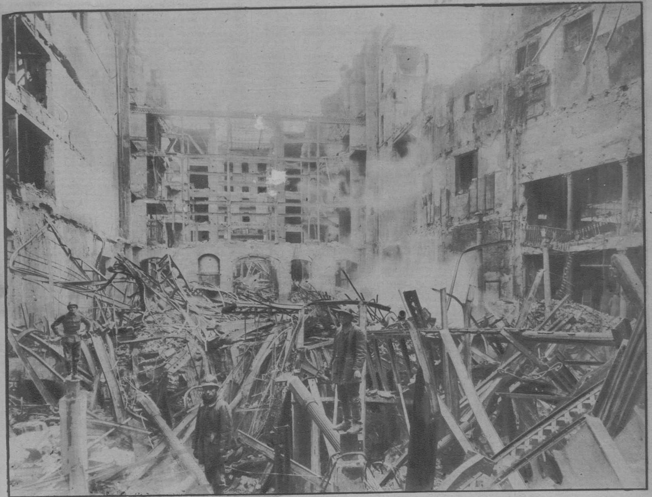
Aspecto de «El Siglo», después del incendio, visto desde la calle de Xuclá, con las paredes de la fachada que da a la Rambla, por fondo

Barcelona, miércoles 28 de Diciembre de 1932