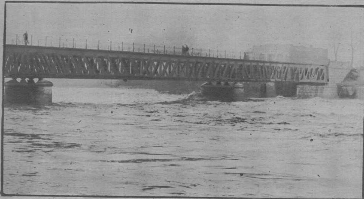
El puente de la carretera de Gerona a Sarriá, al paso de las aguas del río Ter