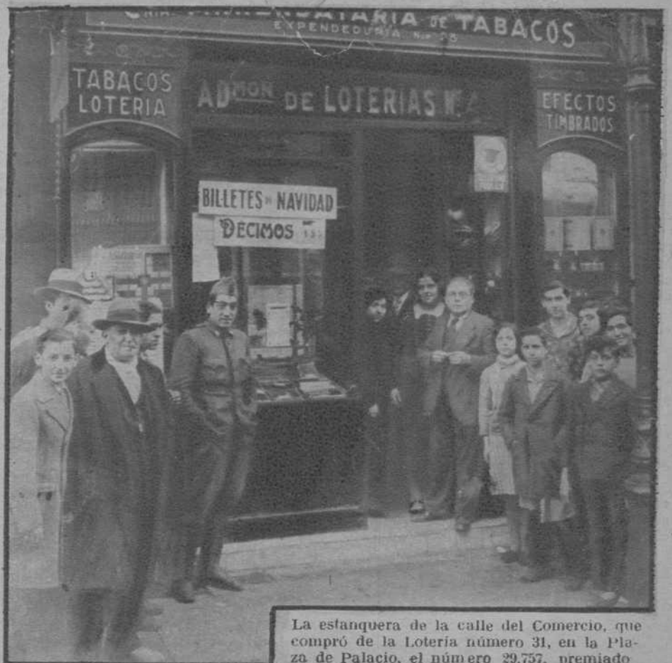
La estantería de la calle del Comercio, que compró de la Lotería número 31, en la Plaza de Palacio, el número 29.757, premiado con el «gordo»