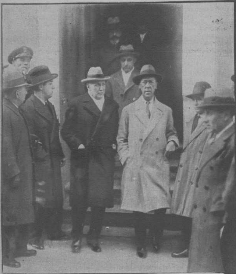
Algunos de los procesados, entre los que se ve a los generales Magaz, Jordana y Mayandía, al salir de Prisiones Militares para ser conducidos al Senado

EN EL PALACIO DEL SENADO, HA DADO COMIENZO LA VISTA DE LA CAUSA CONTRA LOS PROCESADOS POR SUS RESPONSABILIDADES POLÍTICAS EN EL GOLPE DE ESTADO DE 1923 DE LOS GABINETES DICTATORIALES