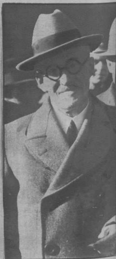
El presidente del Tribunal, señor Franchy Roca, al salir del Senado.

Farmacias, Droguerías y Perfumerías. Pts. 3 botella T E N A S E V I L L A