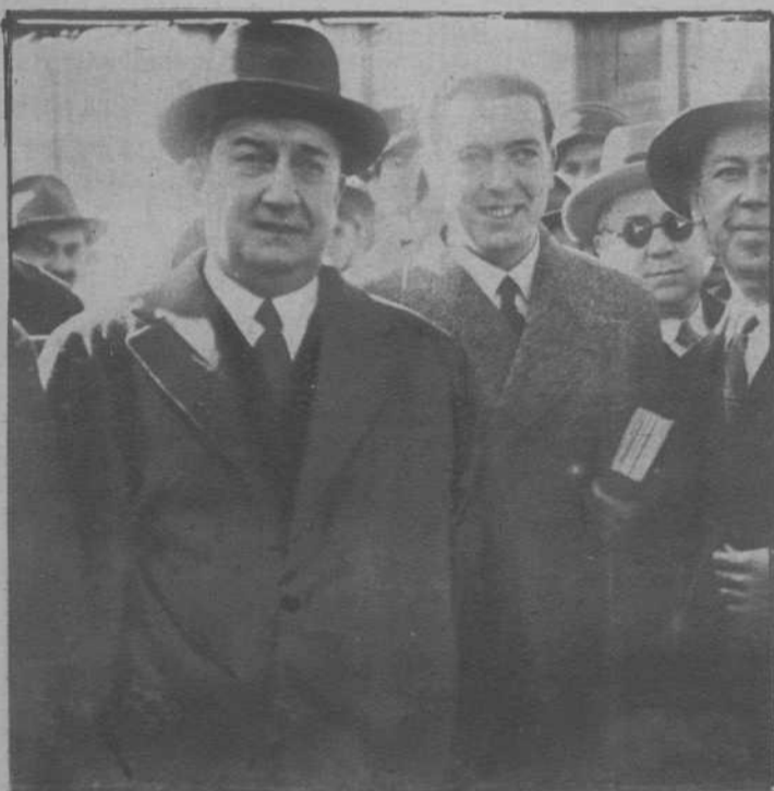
El general don Federico Berenguer, al salir del Senado