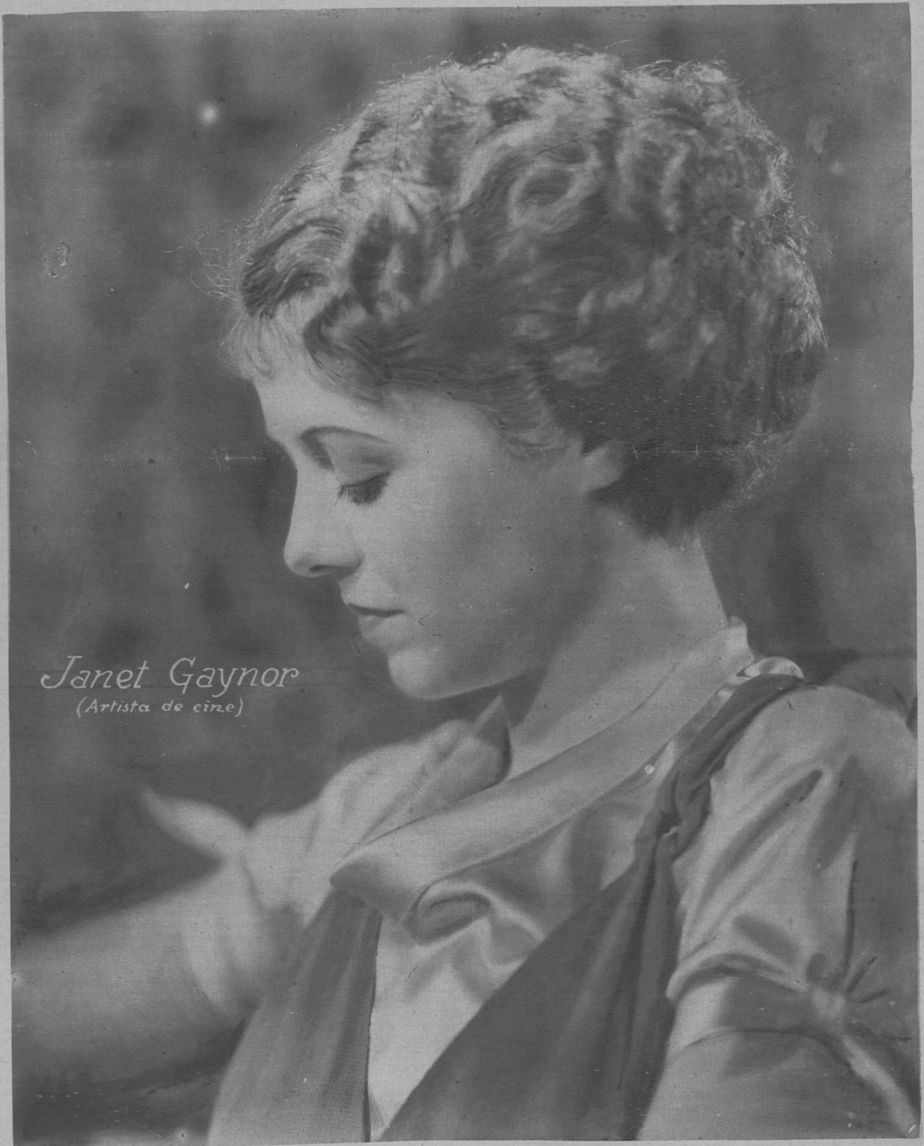
Janet Gaynor (Artista de cine)