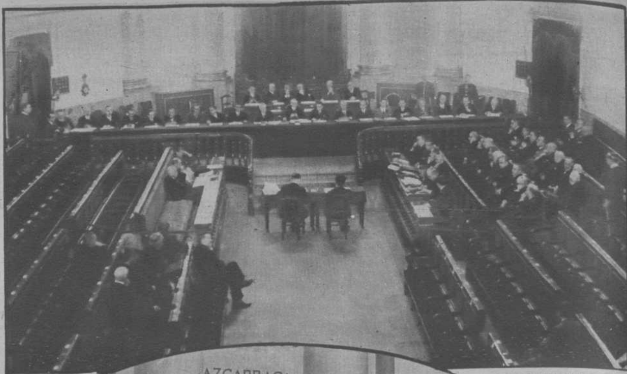
Aspecto del interior del Senado durante la vista de la causa