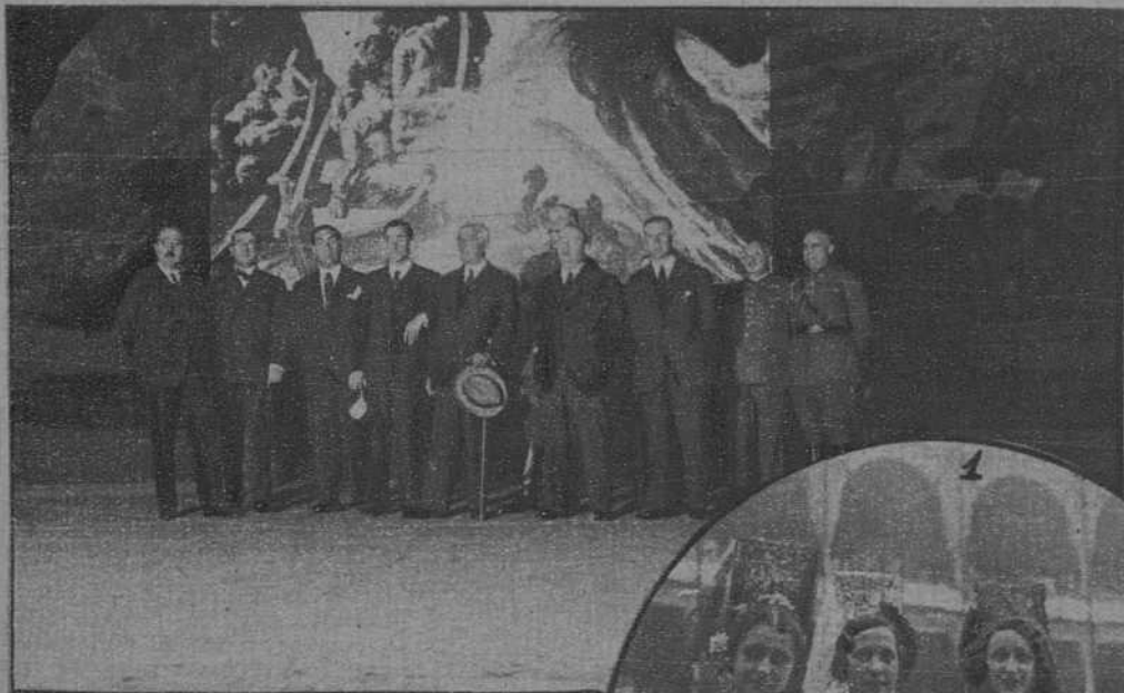
El Jefe del Estado, con los ministros señores Prieto y Zulueta, en su visita a la Abadía de San Telmo