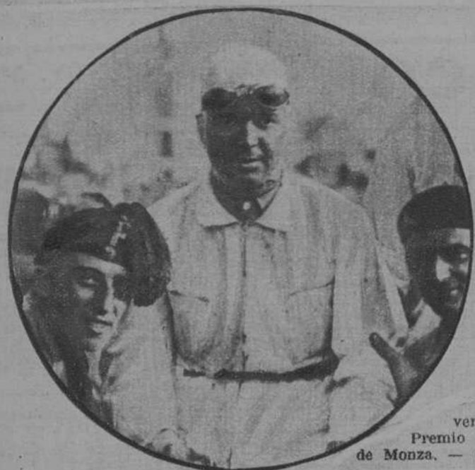
Carracciola, vencedor del gran Premio automovilístico de Monza.