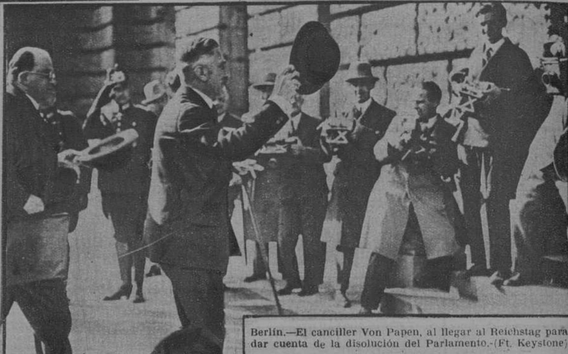
Berlín.—El canciller Von Papen, al llegar al Reichstag para dar cuenta de la disolución del Parlamento.