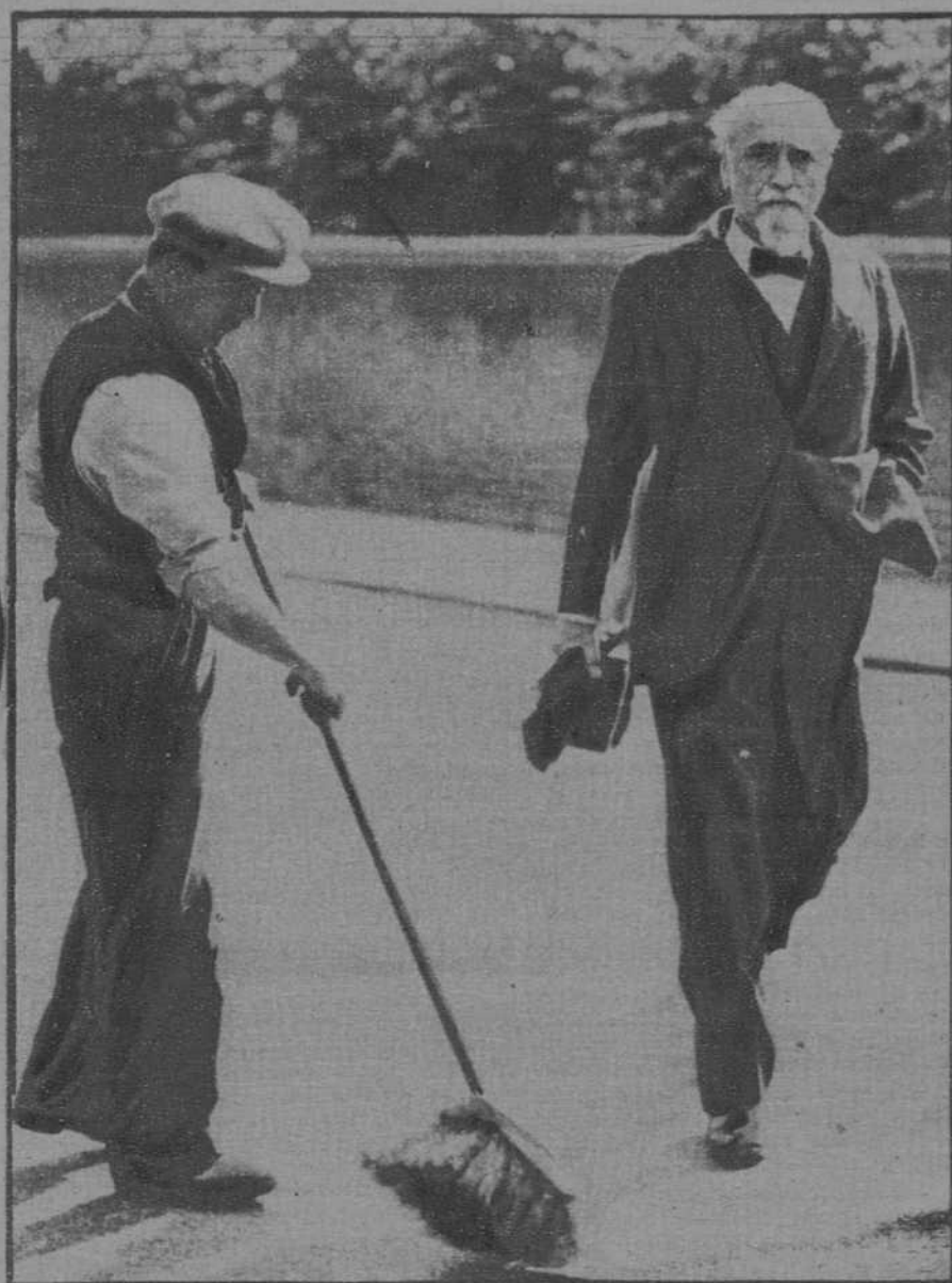
El gobernador del Banco de Inglaterra, Montagu Norman, que hizo un viaje misterioso a los E. U., ha regresado con nombre supuesto, pero no ha podido impedir que un fotógrafo hábil le sorprendiera en una calle de Londres