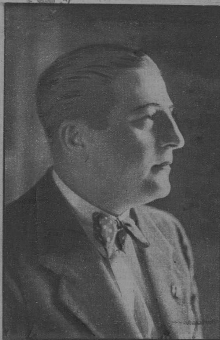
Don Rafael Guariglia, nuevo embajador de Italia en España