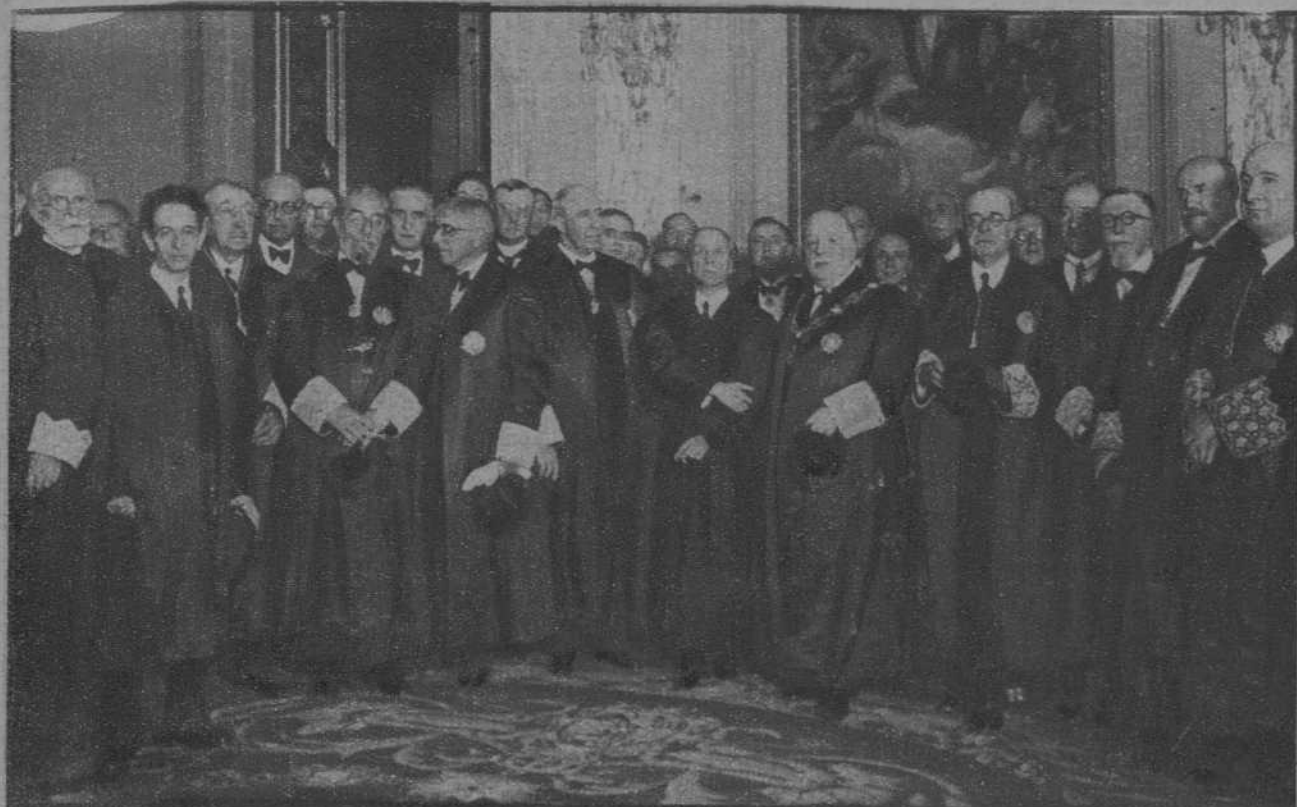
Madrid.—El ministro de Justicia, Sr. Albornoz, con el presidente del Tribunal Supremo, el fiscal general de la República y varios magistrados, que han asistido al solemne acto de apertura de Tribunales.