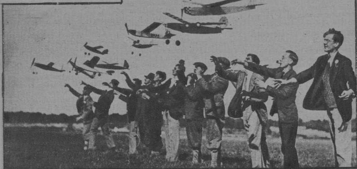
En Brooklands, cerca de Londres, se ha celebrado un concurso nacional de modelos de aviones.