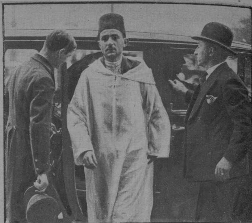
Paris.—Después de un paseo, regresa al hotel en que se aloja el sultán de Marruecos.