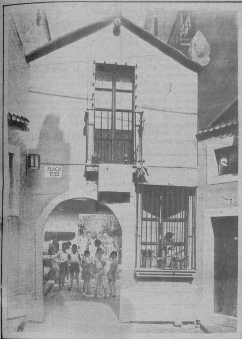
Calle del Progreso, Primer premio