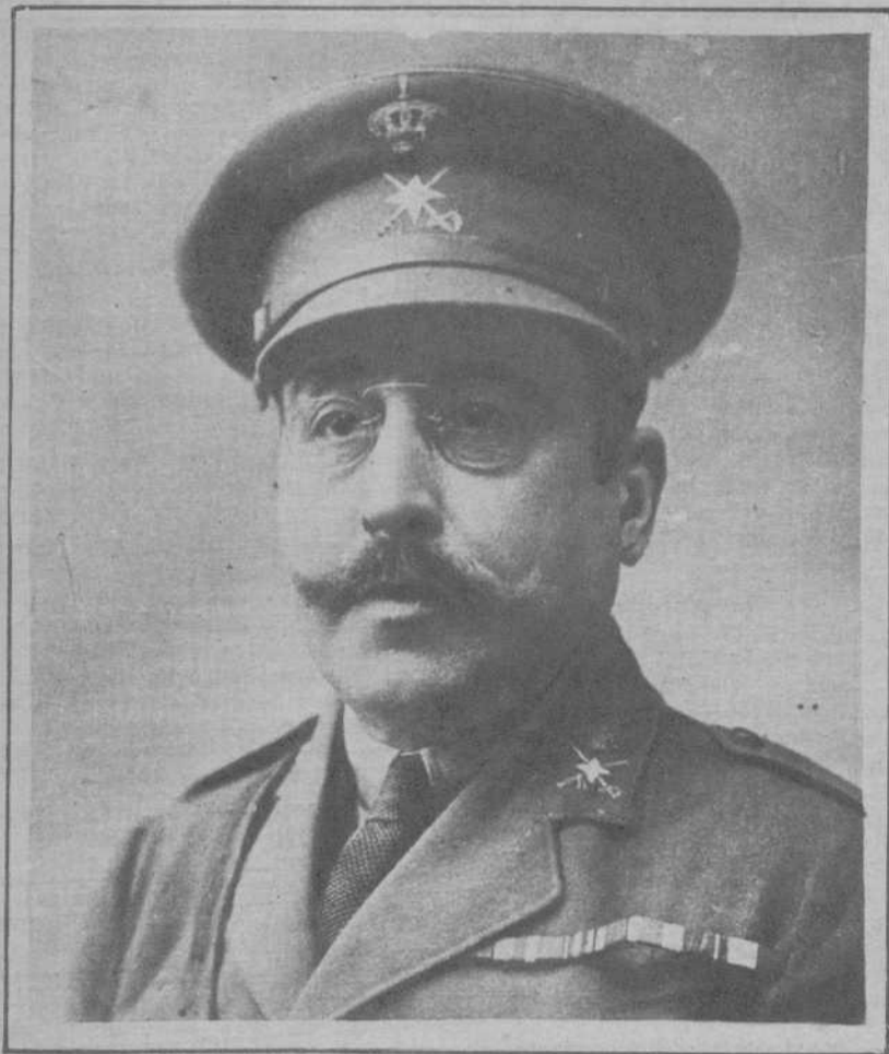
El general Muslera.