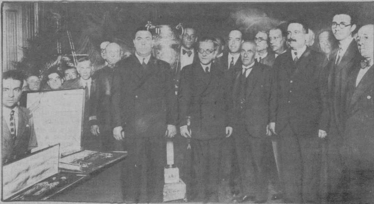
En el Palacio de Justicia. - Homenaje, celebrado ayer, en honor del ex gobernador civil y actual presidente de la Audiencia, señor Anguera de Sojo. El homenajeado, con la comisión organizadora del agasajo, en el acto de hacersele entrega de un artístico y valioso bastón de mando y de una placa conmemorativa.