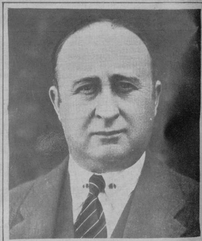
El ex duque de Medinaceli