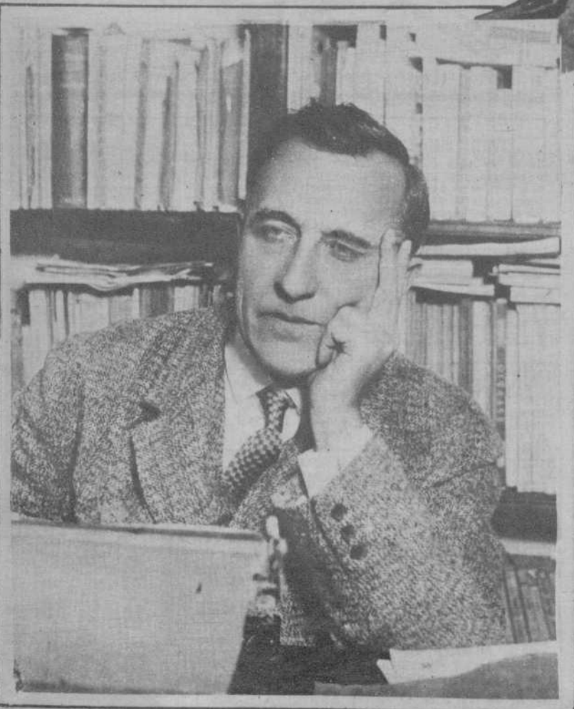
El escritor Ramiro de Maeztu