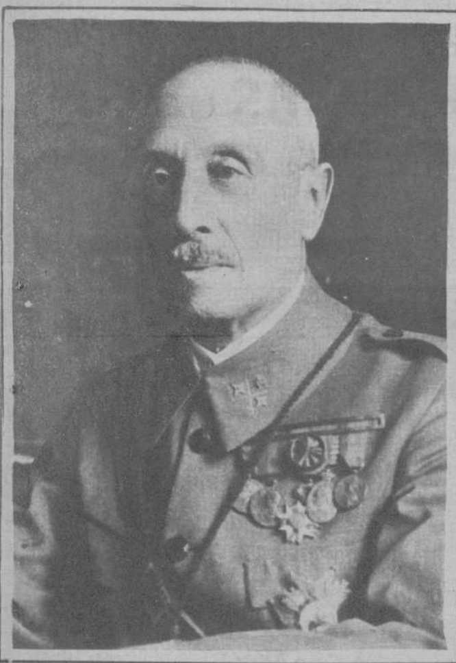
El general Ardanaz

DE LA INTENTONA MONARQUICA. - ALGUNAS DE LAS SIGNIFICADAS PERSONAS DETENIDAS ULTIMAMENTE