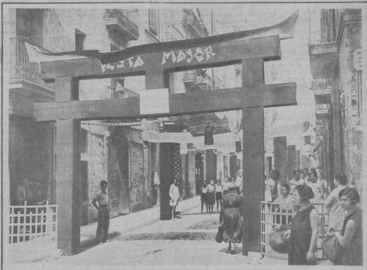
DE LA FIESTA MAYOR DE GRACIA. - LAS CALLES CUYOS ADORNOS HAN OBTENIDO PRIMEROS PREMIOS. - (Fots. Merletti) Calle de Verdi, Tercer premio