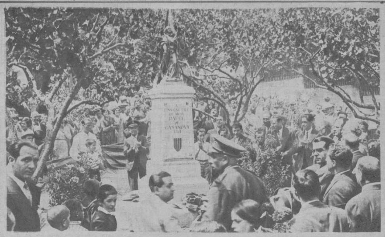
Moyá.—Inauguración del monumento a Rafael de Casanovas, celebrada con asistencia del presidente de la Generalidad, don Francisco Maciá.