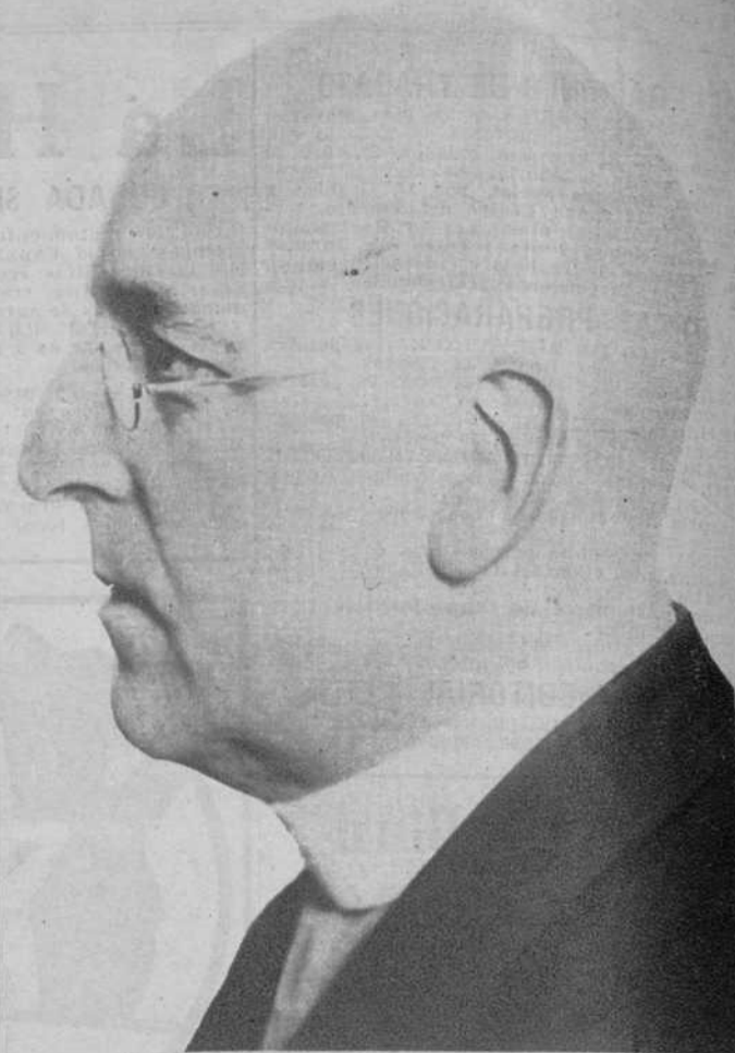
El ex canciller austriaco, Seipel, que ha fallecido en Viena.