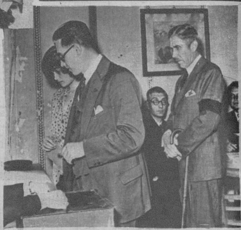
Berlín.—Las elecciones para la renovación del Reichstag. Von Papen (X), canciller del Reich, guardando turno para votar