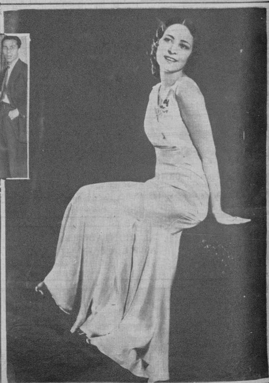
La señorita Kérin Ahais, que representaba a Turquía en el concurso internacional de belleza celebrado en Spa, donde ha sido elegida «Miss Universo 1932».