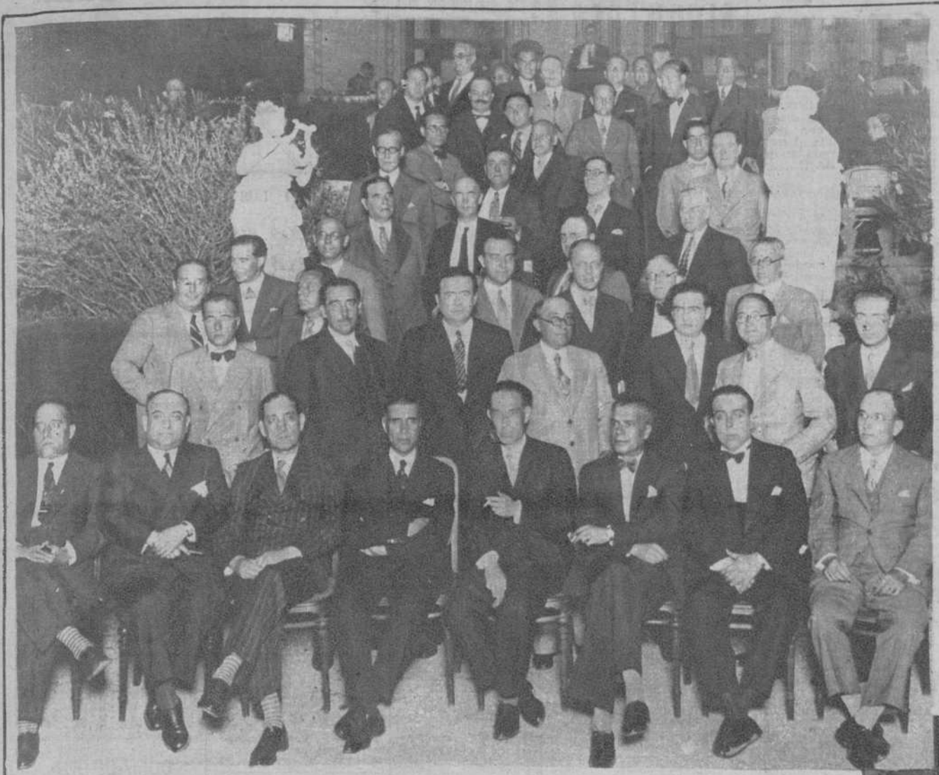
Concurrentes al banquete con que los médicos barceloneses obsequiaron, en la «Font del Lleó», a su compañero, el alcalde de Barcelona, doctor Aguadé.