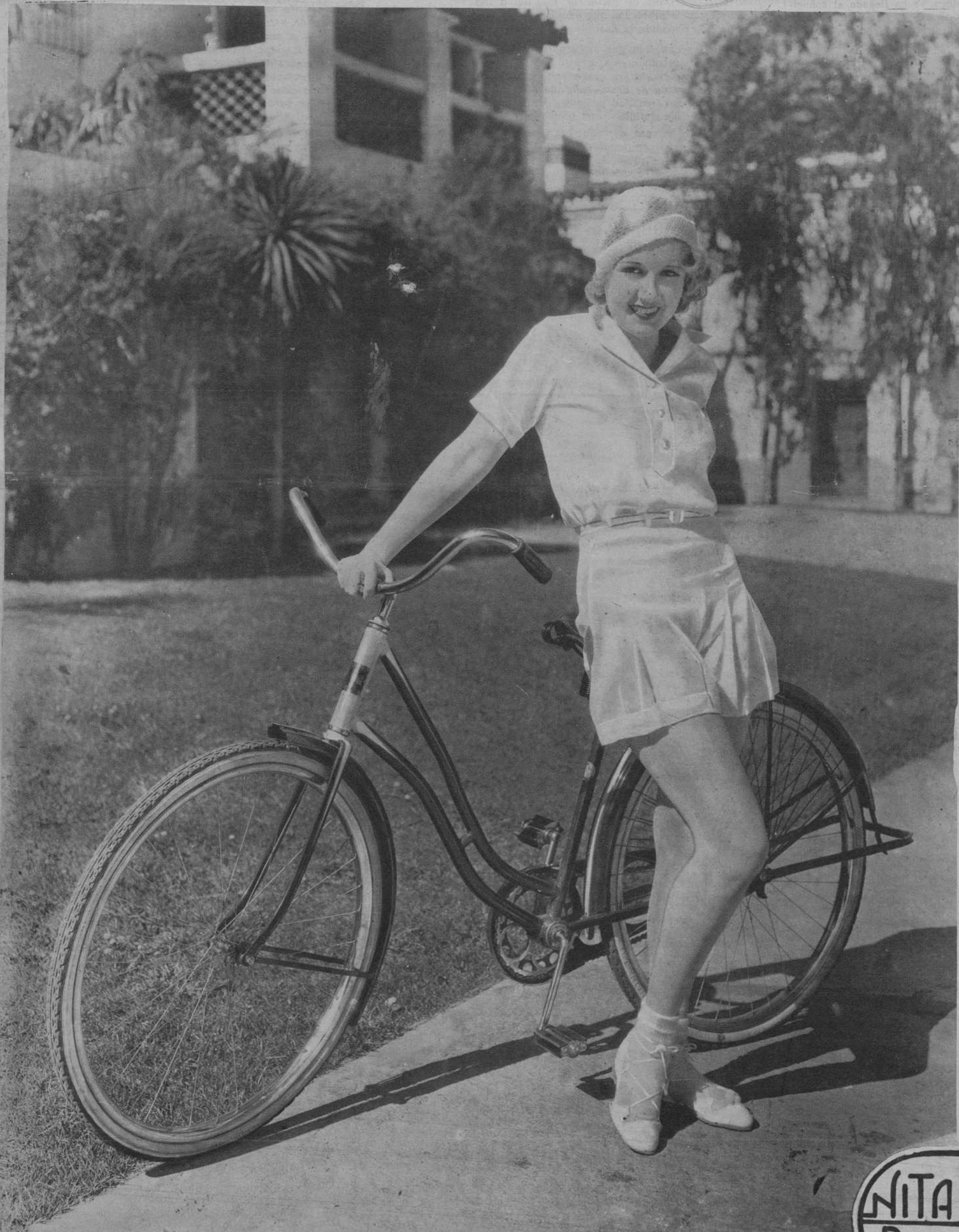
Artista de Cine