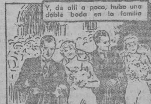
Y, de allí a poco, hubo una doble boda en la familia

El Secreto de Clarita era la "ESPUMA DE CREMA" Con la cual puede Ud. bañar toda la noche en un salón caldeo—jugar al tenis toda la tarde—y conservar la tez tan fresca como al empezar. No brillo en la nariz; no rostros relucientes y grasientos; no necesidad ponerse constantemente polvos. En los Polvos Tokalon la Espuma de Crema está científicamente mezclada con los Polvos aerificados más finos según un procedimiento patentado. Gracias a esto, los Polvos Tokalon no solo se mantienen fijos cuatro veces más tiempo que los demás, sino que, además, procuran a la tez una belleza incomparable, admirada por los hombres y envidiada por las mujeres. Los compactos Tokalon contienen ahora la famosa espuma de crema. Los Polvos y el colorate son ambos sumamente adherentes. Algo nuevo, diferente y mejor.