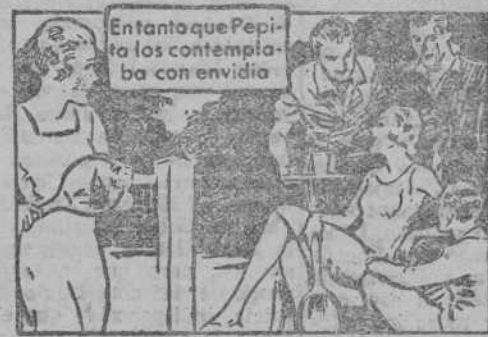
Entanto que Pepita los contemplaba con envidia