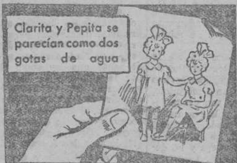
Clarita y Pepita se parecían como dos gotas de agua