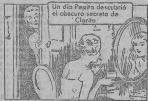
Un día Pepita descubrió el obscuro secreto de Clarita