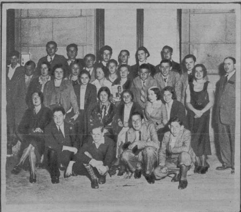
Vigo.—Grupo de alumnos del «Instituto-Escuela», de Madrid, que siguiendo el viaje de estudios que realizan por Galicia, acompañados de sus profesores—que también aparecen en la fotografía—, han llegado a esta población.