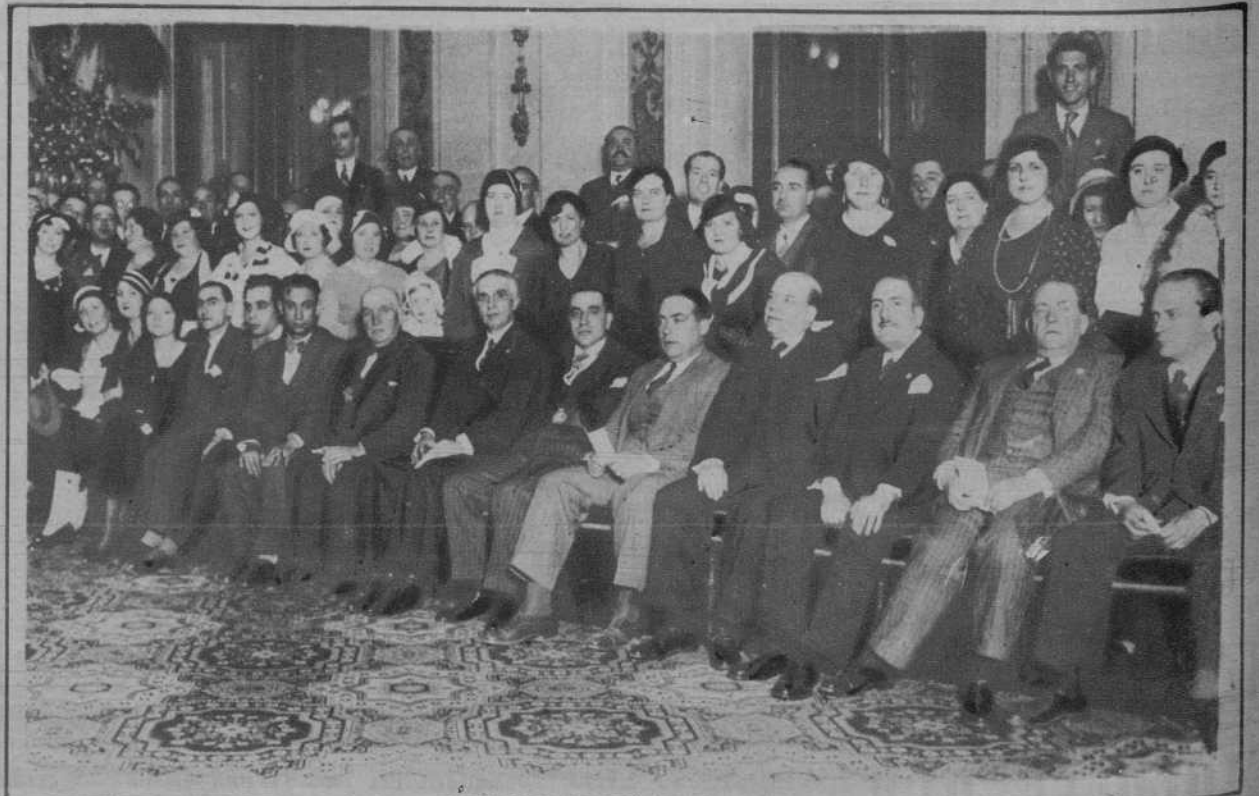
Madrid.—Recepción, celebrada en el Ayuntamiento, en honor de los asistentes a la Asamblea de Titulares Mercantiles.