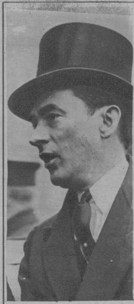
Mr. Walker, alcalde de Nueva York, a quien se inculpa de un grave delito de cohecho.