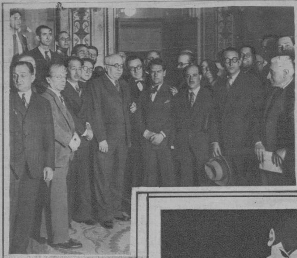
En el Congreso de los Diputados.—El jefe del Gobierno, señor Azaña, con los señores Companys y Nicolau D'Oliver y varios diputados y periodistas, al salir del salón de sesiones, después de pronunciar su magnífico discurso.