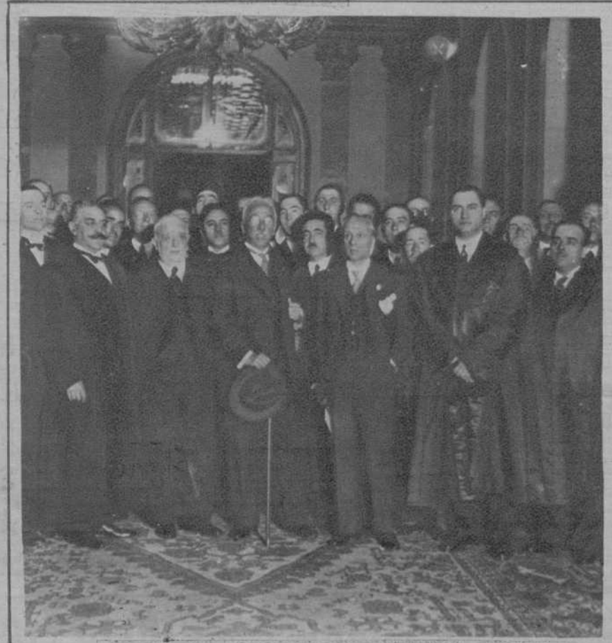
El Presidente de la República, al llegar al Senado