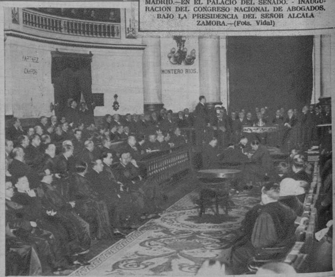
MADRID.—EN EL PALACIO DEL SENADO. - INAUGURACION DEL CONGRESO NACIONAL DE ABOGADOS, BAJO LA PRESIDENCIA DEL SEÑOR ALCALA ZAMORA.