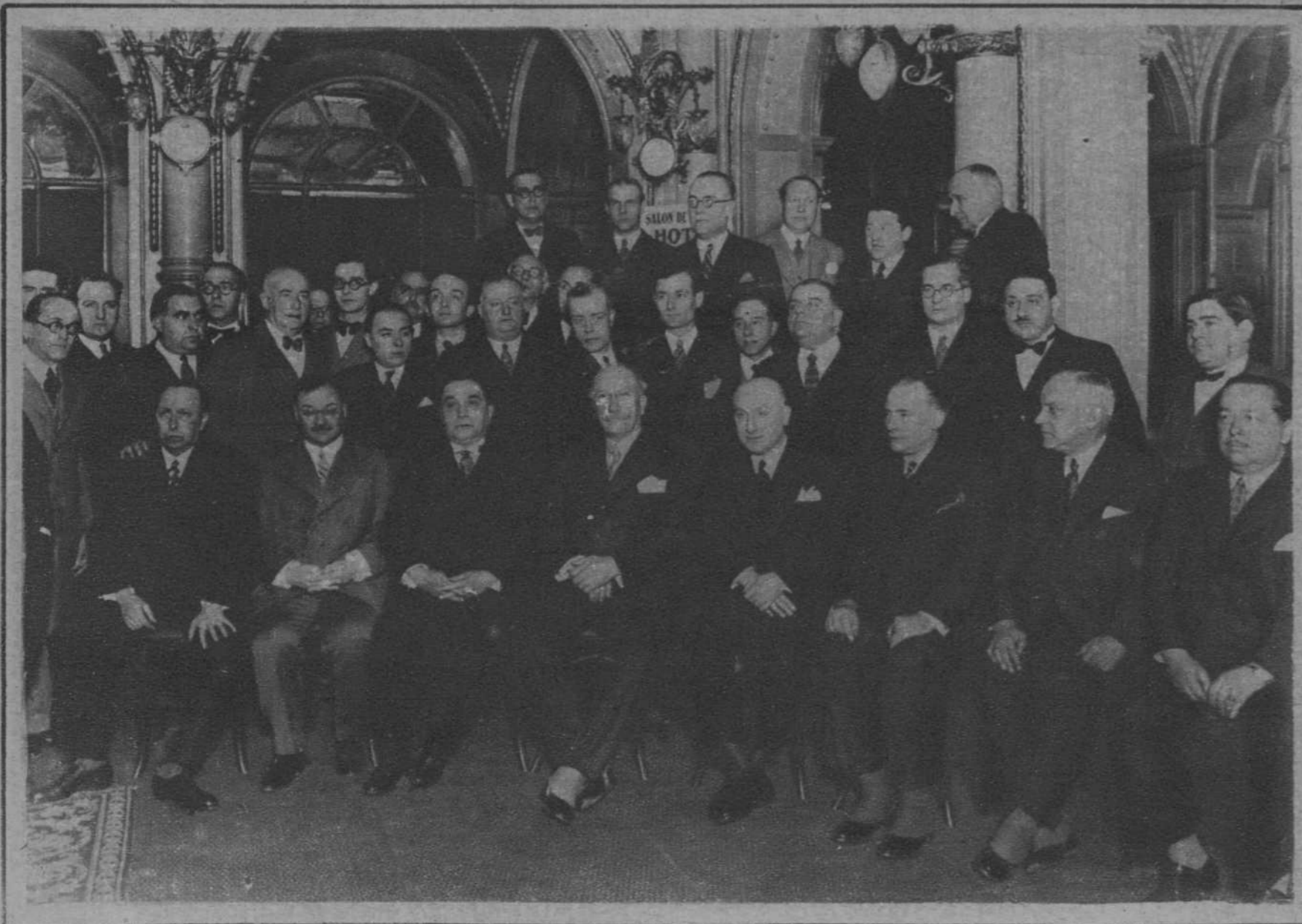
Don Alejandro Lerroux, rodeado de los concurrentes al banquete con que le obsequiaron, en el Hotel Oriente, las entidades periodísticas barcelonesas.