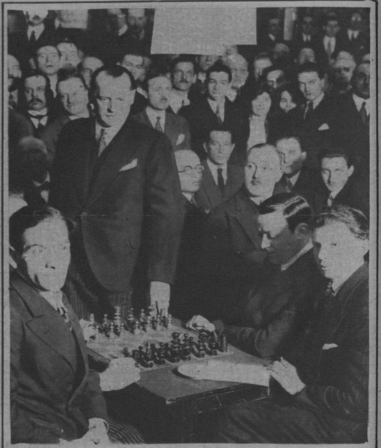
París.—En el Hotel Claridge. El campeón del mundo de ajedrez, Alejandro Alekhine, durante el torneo del noble juego, que ha disputado a 300 adversarios, sobre 60 tableros.