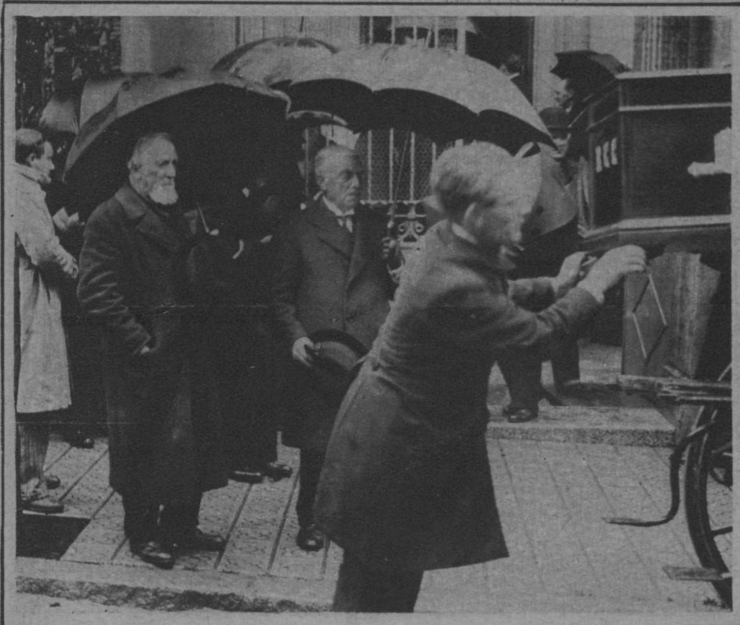
ENTIERRO, EFECTUADO AYER, DEL CADAVER DEL PINTOR CATALAN RAMON CASAS.—Momento de ser depositado el féretro en el coche mortuario. En primer término, a la izquierda, el gran escultor Clarassó, camarada entrañable—con el también glorioso desaparecido Santiago Rusiñol—del ilustre finado.