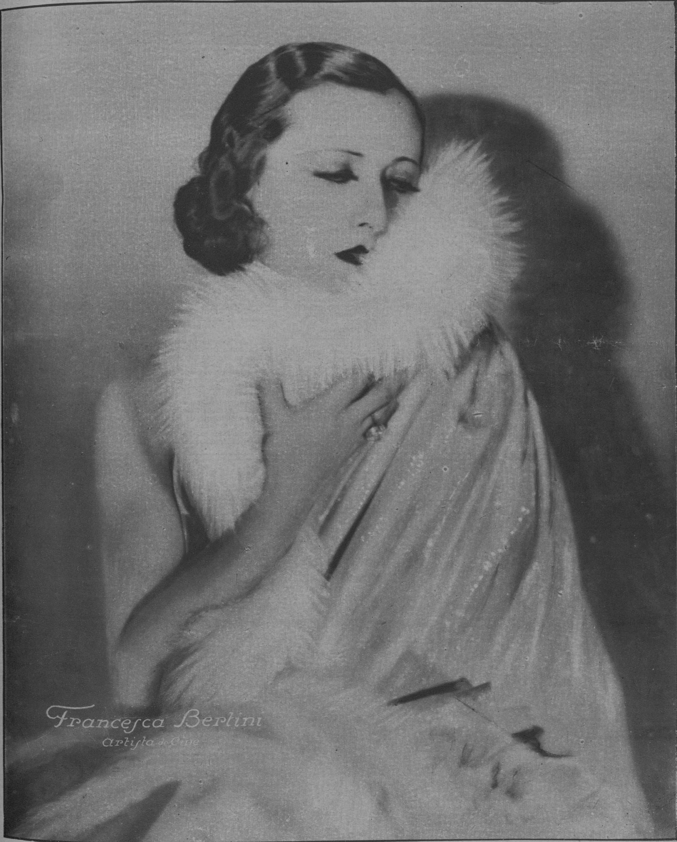
Francesca Bertini Artista de Cine