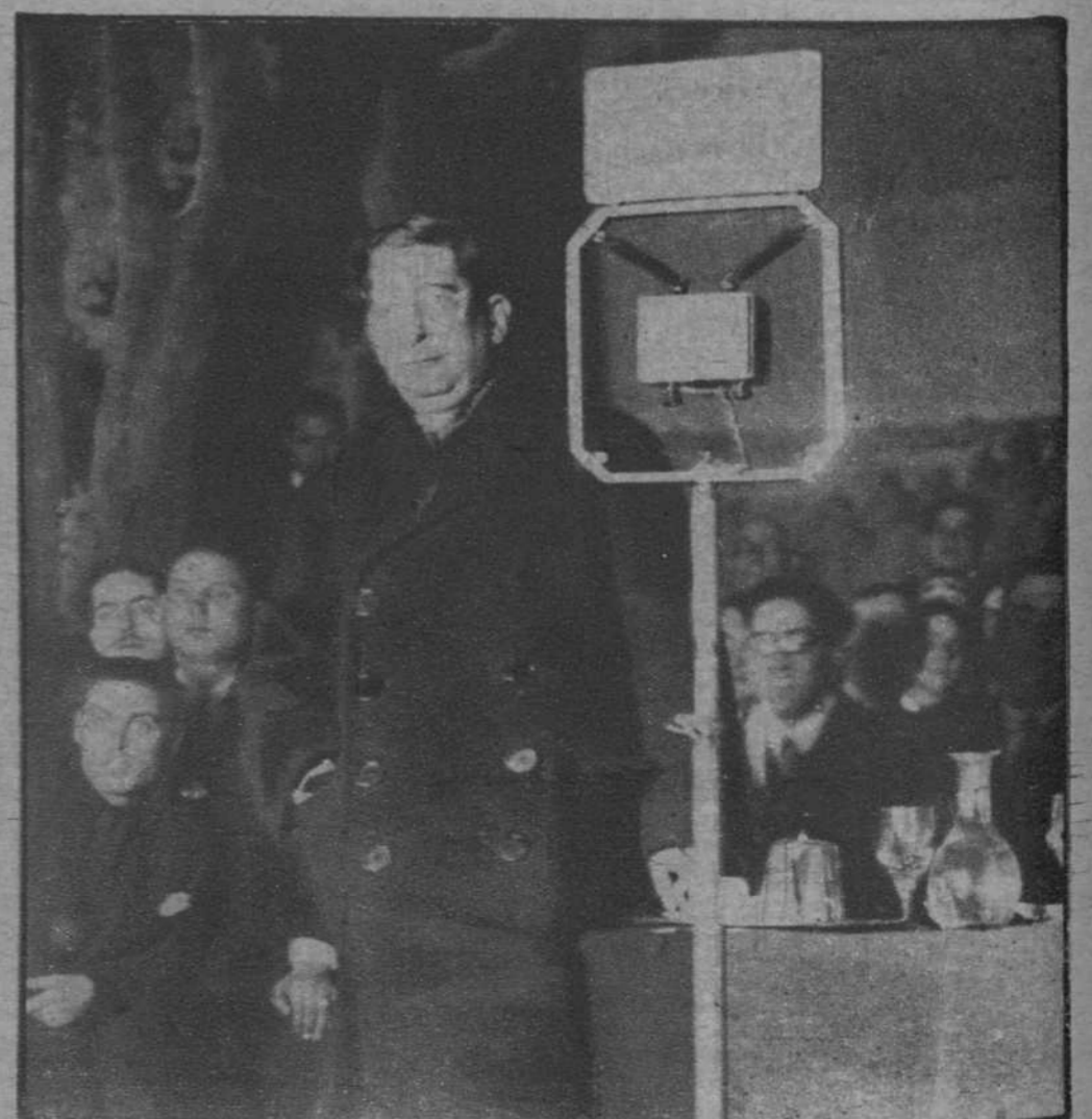
Valencia.—El ministro de Agricultura, don Marcelino Domingo, en un momento del discurso que pronunció en el Teatro Apolo.