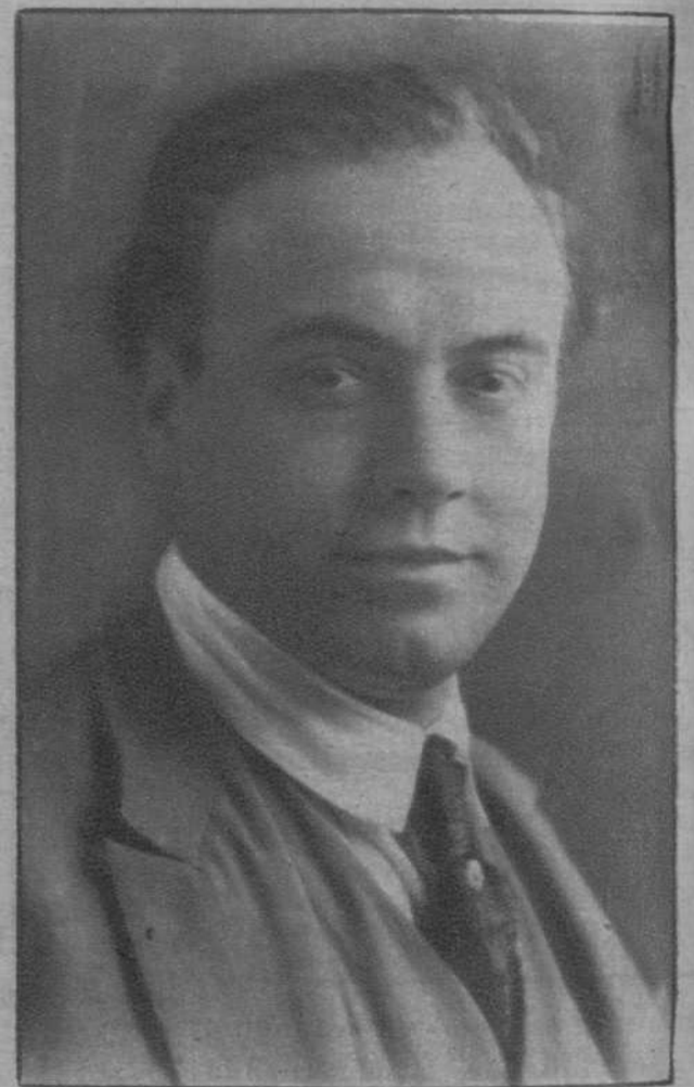
El notable tenor catalán Miguel Mulleras, que actúa con muy buen éxito en el Liceo.