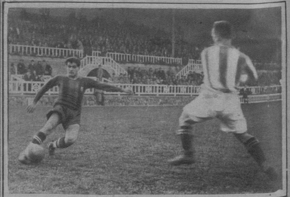
Un chut de Sastre