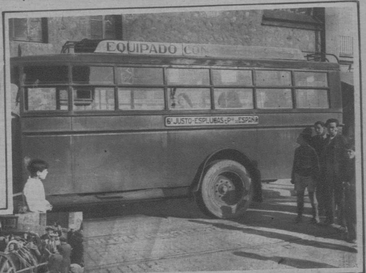
Impactos causados por los disparos hechos en la Plaza de España, en uno de los autobuses que prestan servicio desde San Justo a dicho punto