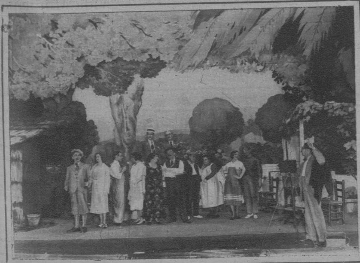
Una escena de «Flors i Papellones», de Lamberto Escaler, la obra que ha obtenido el éxito de risa más franco de la temporada, y que lleva a diario el Teatro Romea