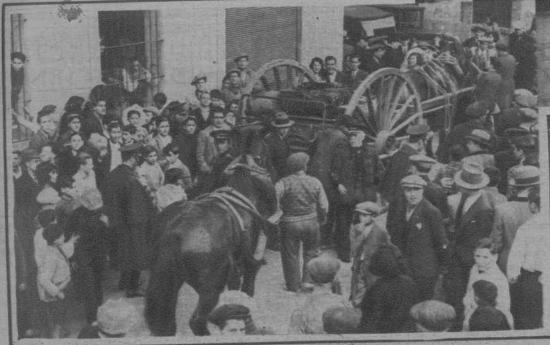
El carro blindado, después de ser cargadas en el mismo las bombas encontradas en la calle de Margarit.