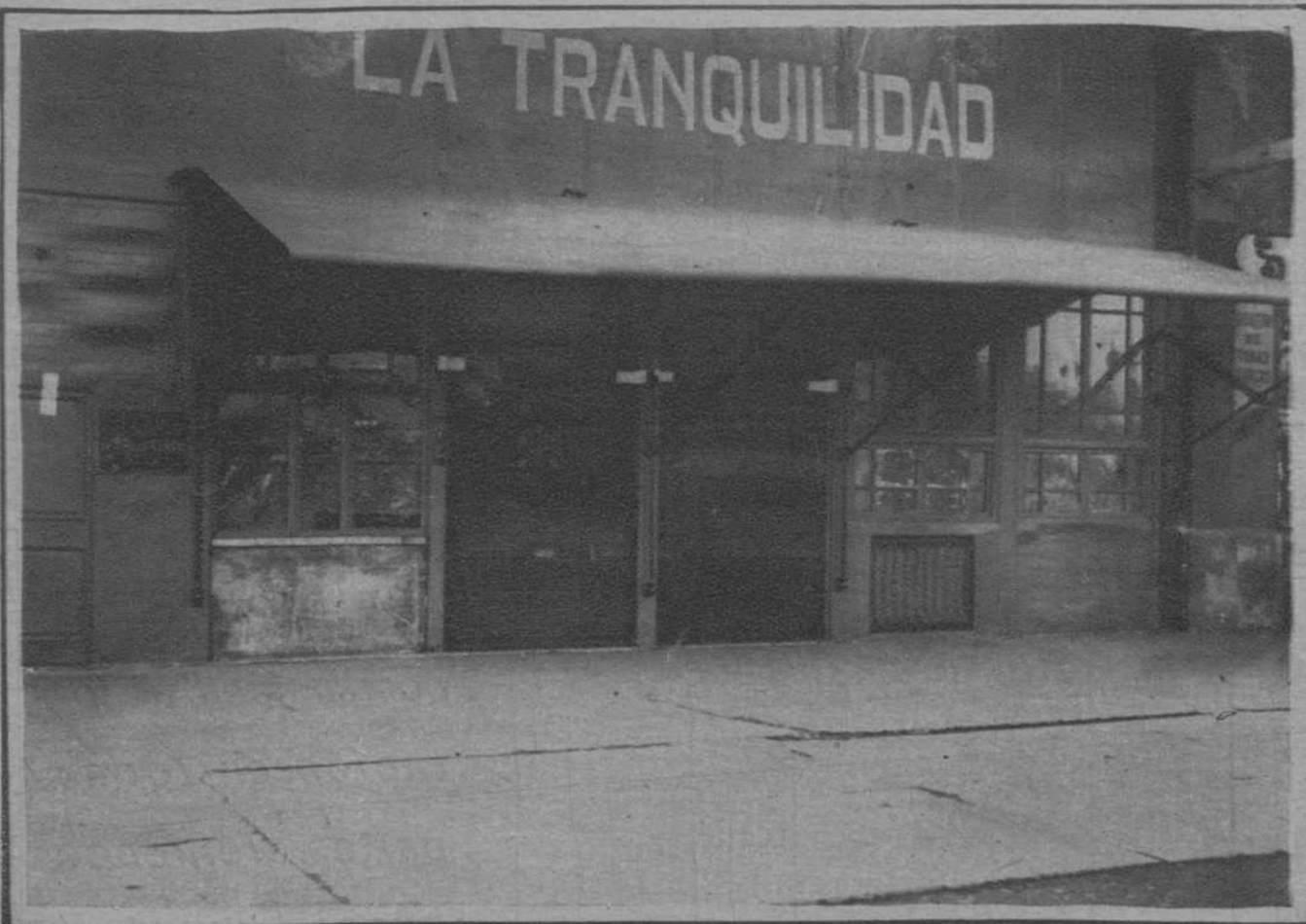
El bar «La Tranquilidad», del Paralelo, clausurado por la autoridad, después de haber sido sorprendida en él una reunión de elemento extremistas, que fueron detenidos.