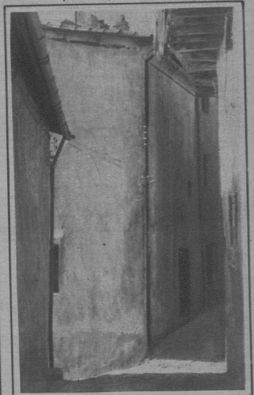
Casa de Berga en la que los revoltosos tenían establecido su cuartel general.