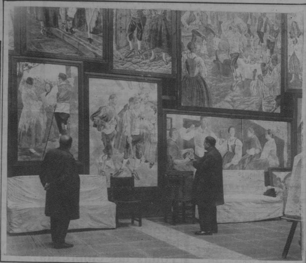
Un aspecto de la Exposición