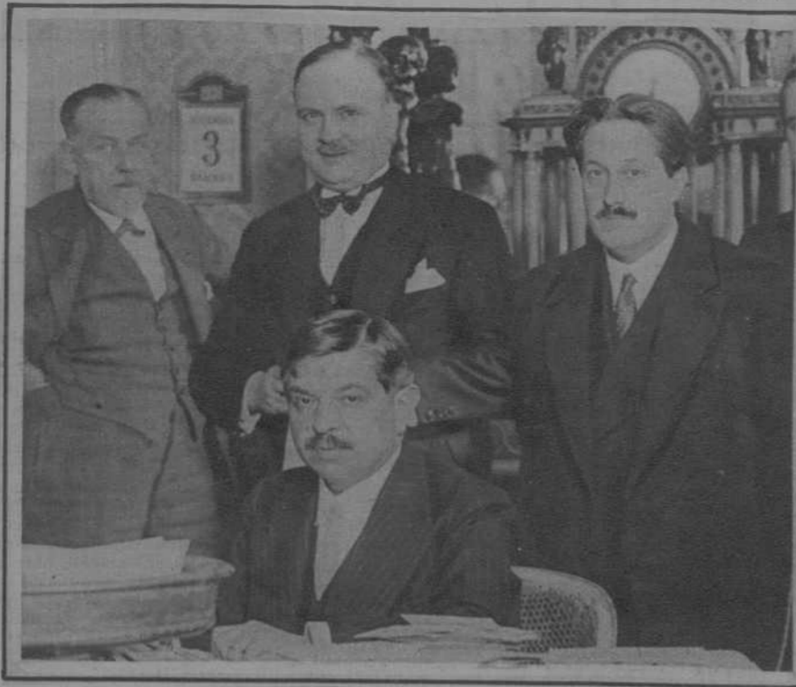
París.—El señor Laval, al terminar el primer Consejo de ministros celebrado después de su regreso de Norteamérica, lee a los periodistas la nota de los asuntos tratados.