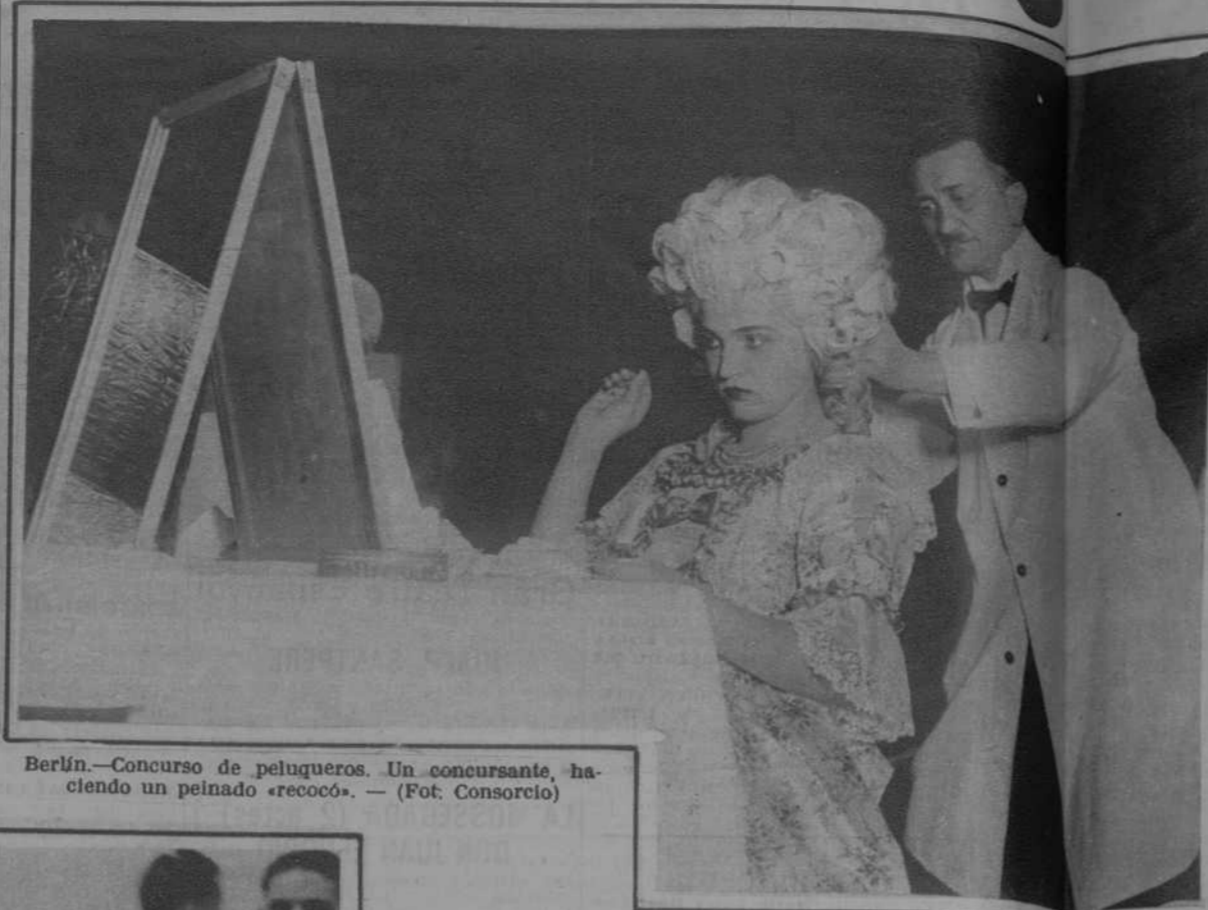
Berlín.—Concurso de peluqueros. Un concursante, haciendo un peinado «recocó».