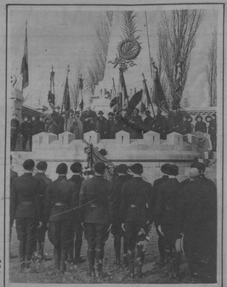
Bruselas.—La colonia francesa de esta ciudad, depositando flores sobre las tumbas de los combatientes de su país, muertos en territorio belga durante la guerra.