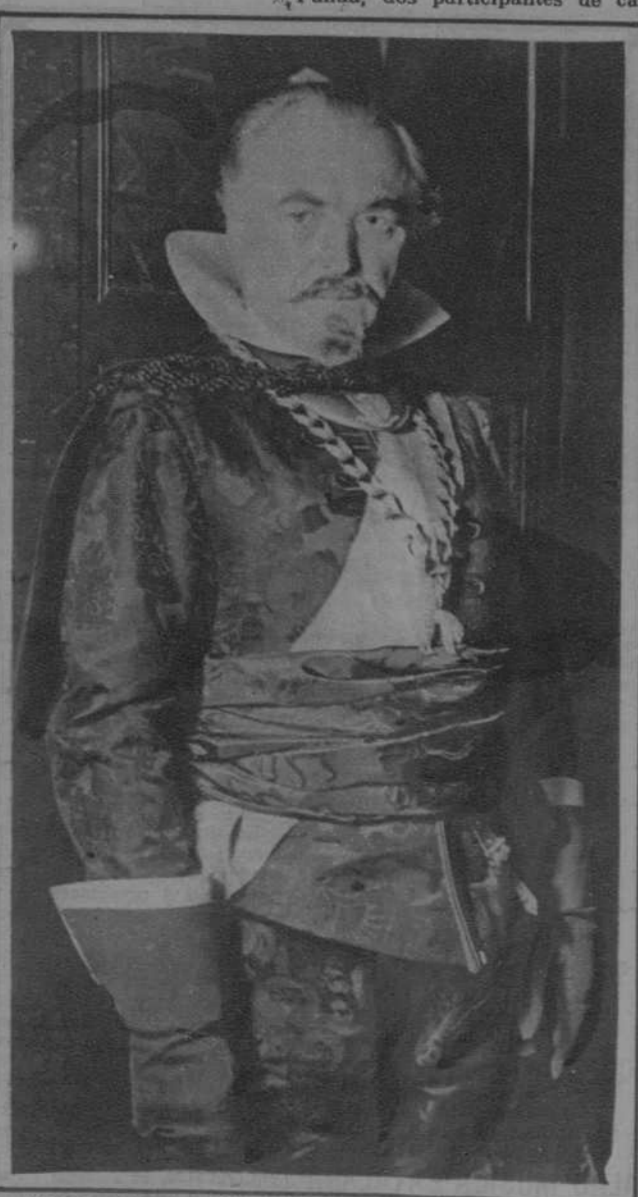
Berlín.—El actor Werner Kraus, en su papel de «Wallenstein», en la obra de Schiller, de este título.