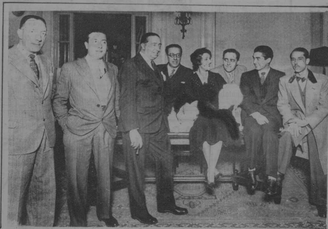
Imperio Argentina, la gentil «estrella» de la pantalla, que se encuentra en Barcelona, conversando con los periodistas en el Hotel Ritz.

MADRID.—LA EXPOSICIÓN DE ACUARELAS Y CARTONES REALIZADOS EN FRAGA DURANTE EL PASADO CURSO DE VERANO POR LOS ALUMNOS DE LA «ESCUELA MUNICIPAL DE ARTES INDUSTRIALES Y CERAMICA».