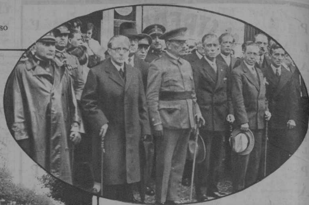
Las autoridades y los familiares de la víctima, presidiendo el duelo.