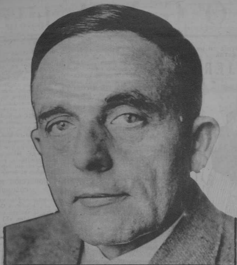
Berlín.—El doctor Otto Warburg, a quien se ha concedido el Premio Nobel de Medicina.